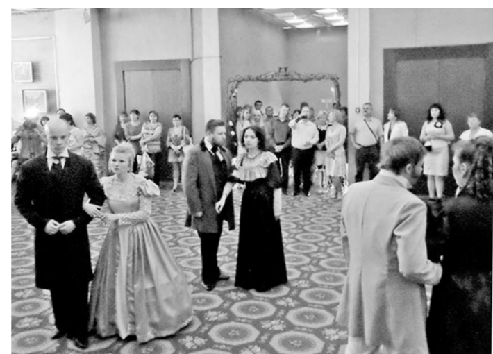
Представление началось ещё в фойе.