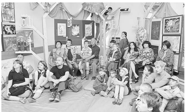
Зрители восторгаются работами юных мультипликаторов.