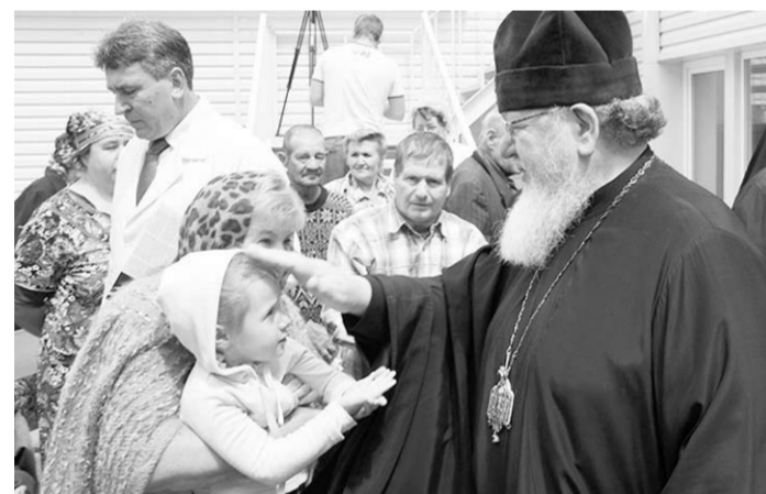
Благословение Владыки Сергея после завершения чина освящения здания.

Высокопреосвященный Сергей, митрополит Воронежский и Лискинский, освятил Воронежский областной клинический онкологический диспансер.