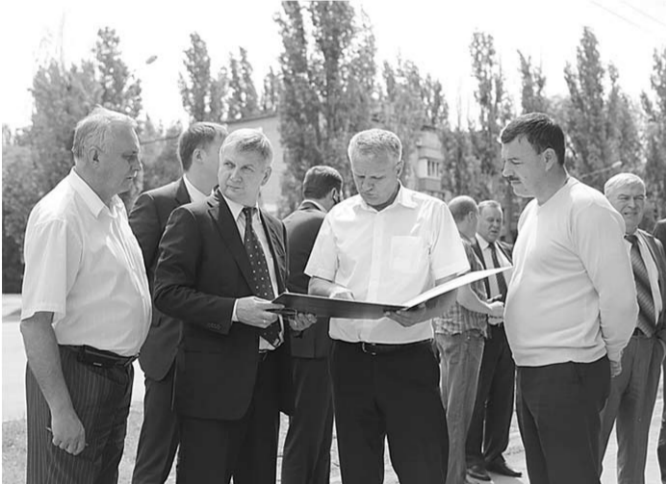
Мэр Александр Гусев инспектирует ход работ.

— Будут и крупные объекты — расширение улиц Ломоносова и Тимирязева. Понятно, что такая масштабная реконструкция связана с неизбежным затруднением движения на данных участках. И здесь очень важным станет разработка такой план организации всех мероприятий, который сведет к минимуму неудобства для водителей и жителей города, — подытожил Александр Гусев.