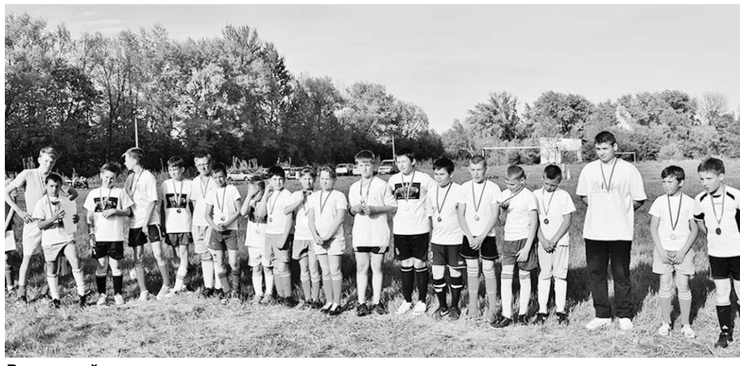
Радостный момент награждения.

Подумал и добавил: – Во многих из нас сидит издвигатель, что вот придет кто-то и за нас всё сделает. Организует для детей спортивную команду, наведёт порядок в сквере... А ведь нужно самим рукава засучивать и всё делать. Тогда и жизнь вокруг будет светлее и радостнее, даже в хмурый и дождливый день.