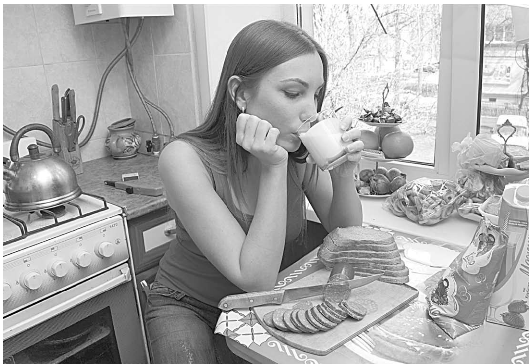
Своё слово должен сказать потребитель, голосуя за продукт рублём.