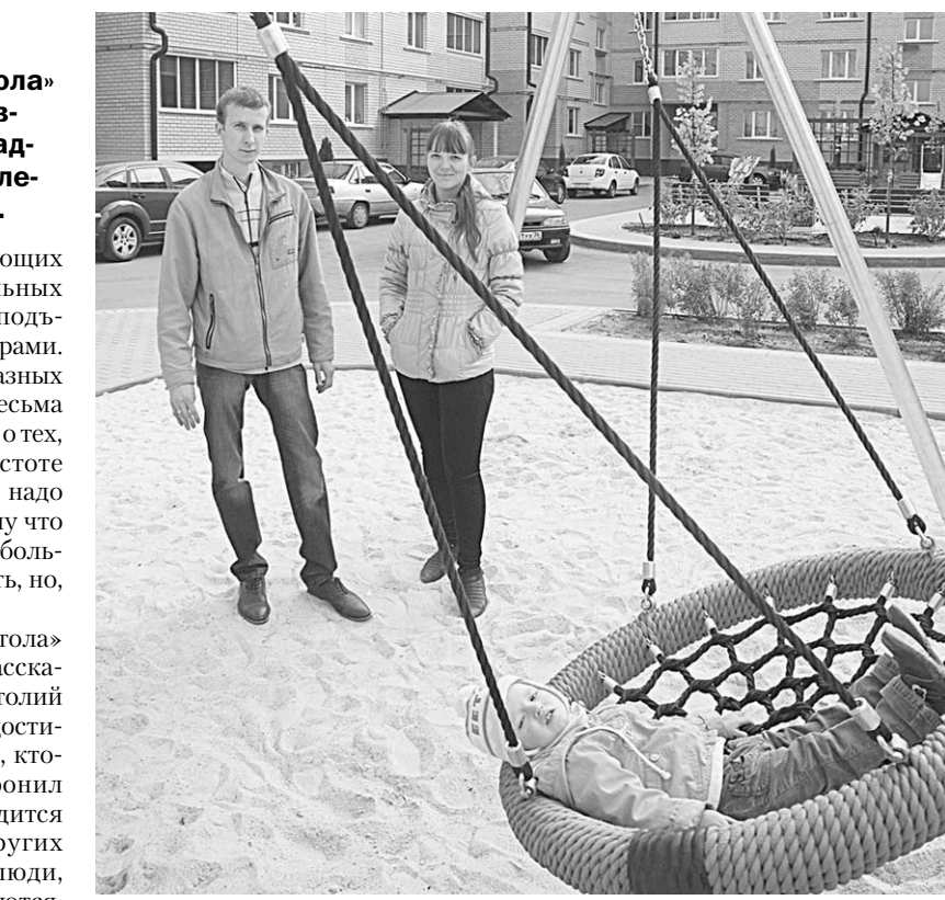
В «Новом квартале» всё радует глаз.

Я в Отрадном! Слово-то какое! Песней уходящее в века, Отсекая жизни всё худое, Наполняя души добротой, Нас качает Времени река.