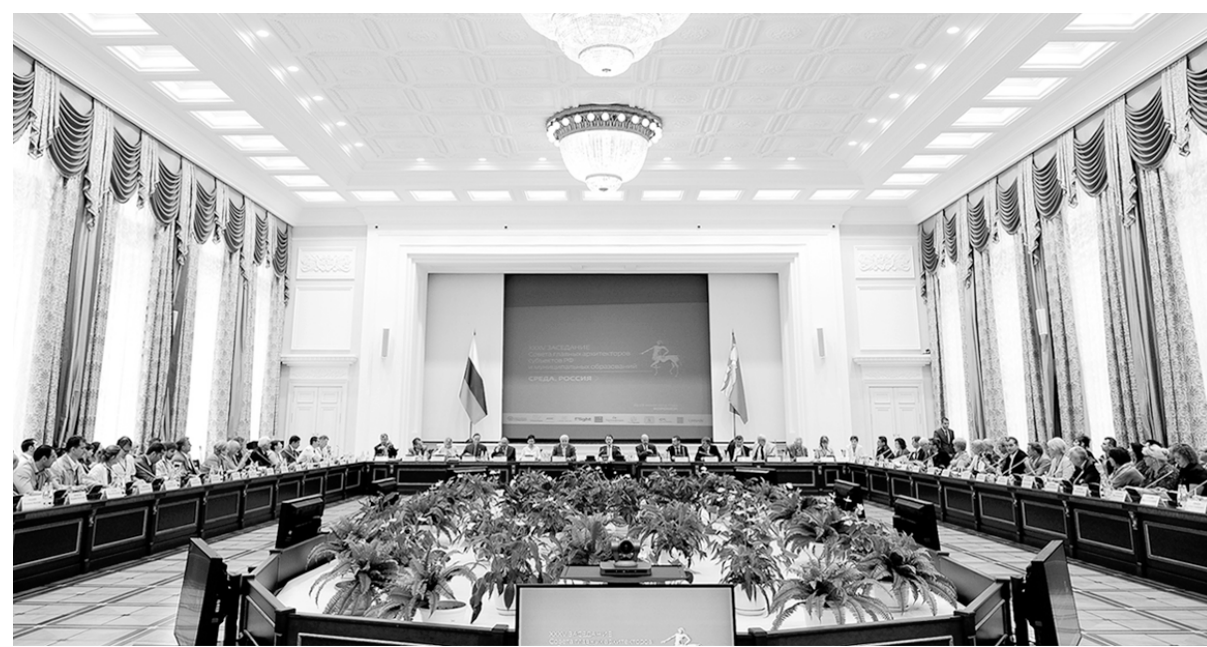
На Совете в Воронеже собрались ведущие специалисты России.

Дальнейшая программа была весьма насыщенной. Съехавшиеся в Воронеж члены Совета приняли участие в работе архитектурного форума «Зодчество VRN-2014», выступив в качестве слушателей, модераторов и экспертов образовательных и дискуссионных площадок.