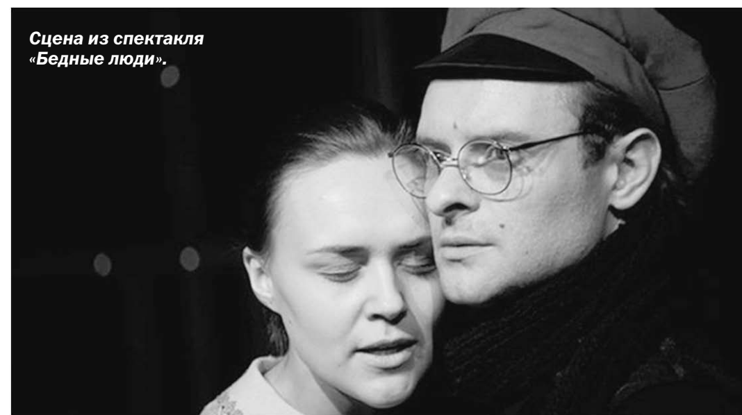
Сцена из спектакля «Бедные люди».

Это по-хорошему наивный спектакль. Но наивность его не от глупости (хотя безмерный цинизм нашего времени, скорее всего, сочтёт героев именно глупыми), а оттого, что люди в отчаянии своей жизни не хотят замечать её двусмысленности. Безмерная нищета не даёт им права ни на что, кроме богатства чувств. И это удерживает их на краю бездны.