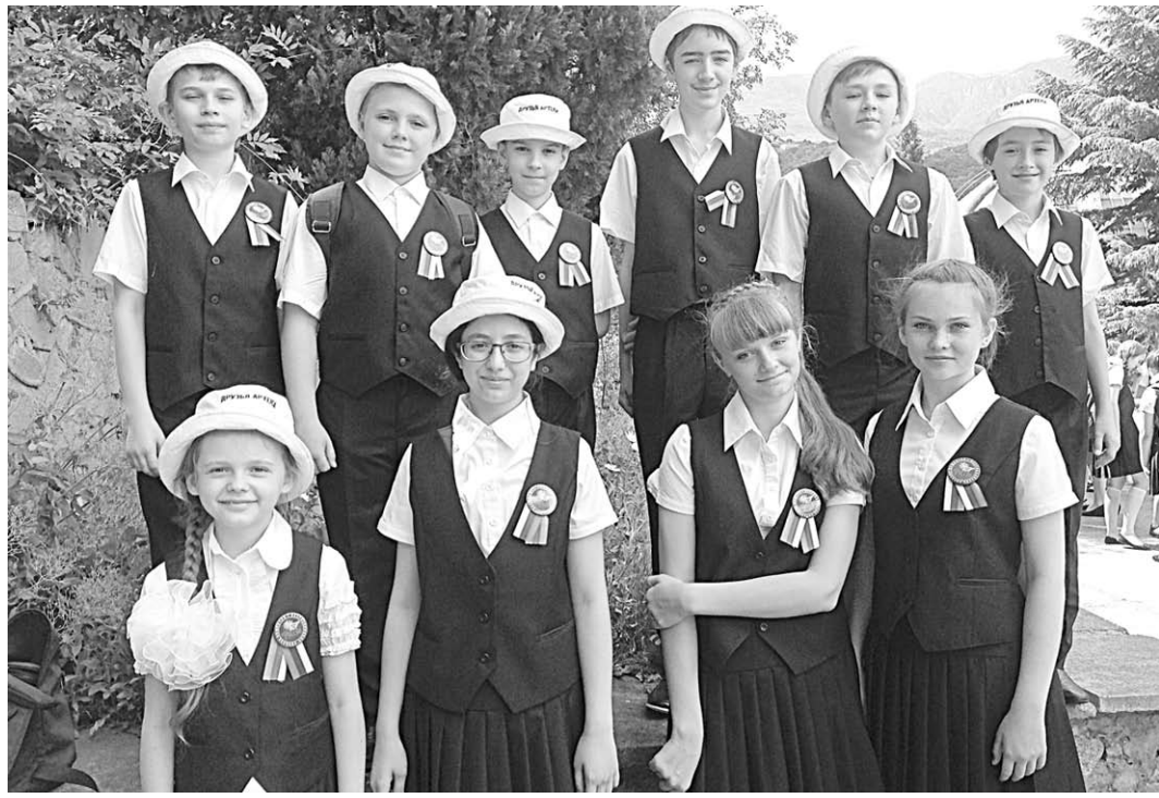
Юные воронежцы на крымской земле.

Второй концертной площадкой для выступления Детского хора России стал город-герой Севастополь, отмечает 15 июля свой день рождения. На заполненной до отказа площади Нахимова дети пели более часа. Исполненные ими 13 хоровых произведений включали всеми любимые детские песни «Крейсер «Аврора», «Орлята учатся летать», «Трус не играет в хоккей». Севастопольцы тепло и радужно приняли выступление Детского хора России, дружно аплодировали ребятам