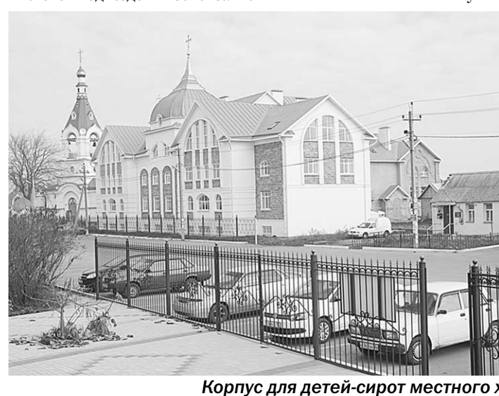
Корпус для детей-сирот местного храма.

Все гости отмечают чистоту улиц, зелень многочисленных сквериков и красоту цветочных клумб. А жилой массив «Нового квартала» с его клумбами, фонтанами, красивыми скамейками для отдыха, идеальной чистотой подъездов вызовет зависть