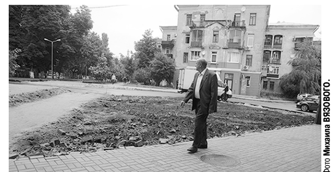
Улица К.Маркса – излюбленное место прогулок для воронежцев.

Остановить реконструкцию пешеходной зоны на улице Карла Маркса в Воронеже и провести общественные слушания по этому вопросу – такого решения добиваются активисты, обратившиеся к региональным и муниципальным властям.