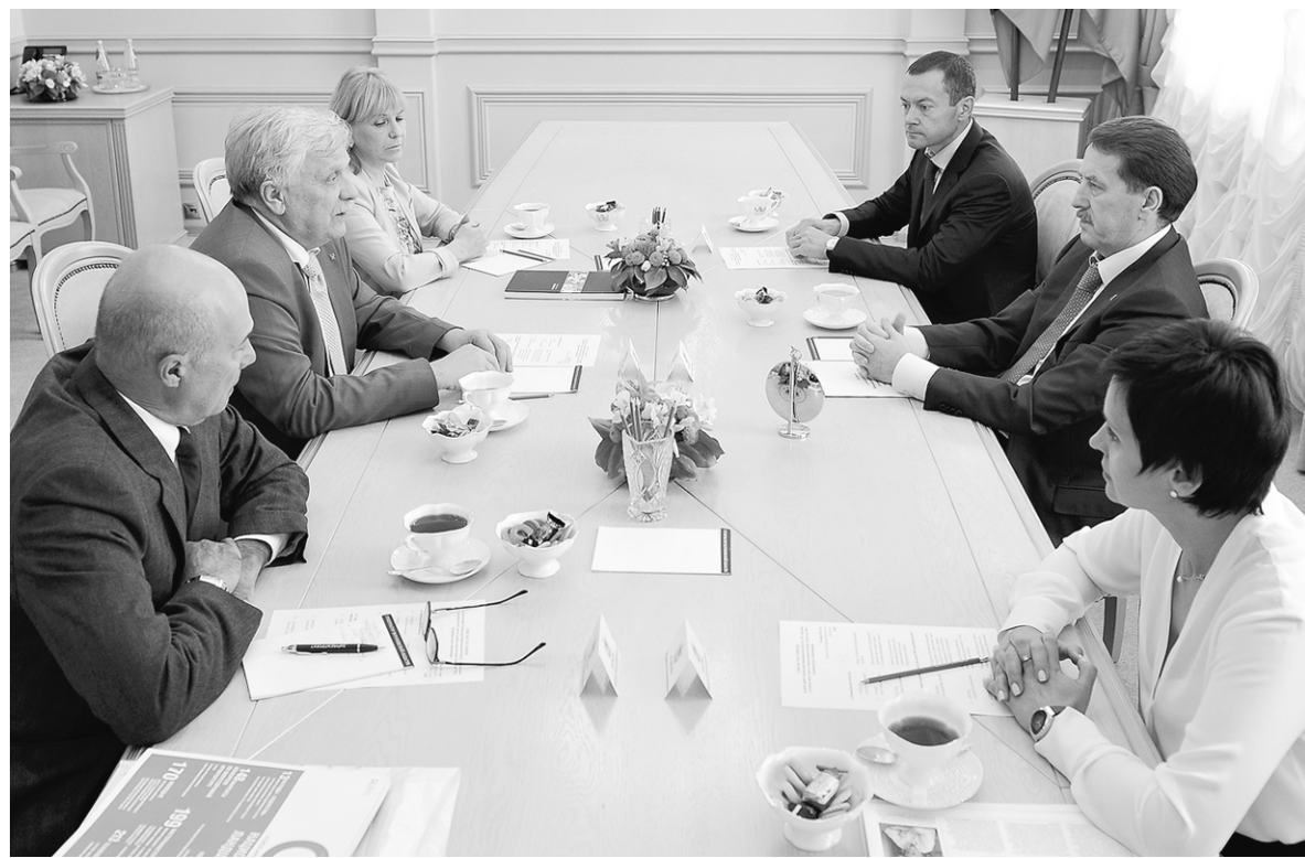
Встреча врио губернатора Алексея Гордеева с архитекторами.

Для нас почетно, что столь крупное мероприятие проходит именно в столице Черноземья, – подчеркнул Алексей Васильевич. – К архитекторам я отношусь как к особым людям! Именно вы задаёте тон не только градостроительной политике, но и определяете будущее социально-экономического развития региона и городов. Мы это очень хорошо чувствуем сейчас, когда стали открываться новые предприятия, и к нам поехали специалисты. Их в первую очередь интересуют вопросы среды обитания, того пространства, в котором они живут и работают. Дело не только в эстетике – хотя