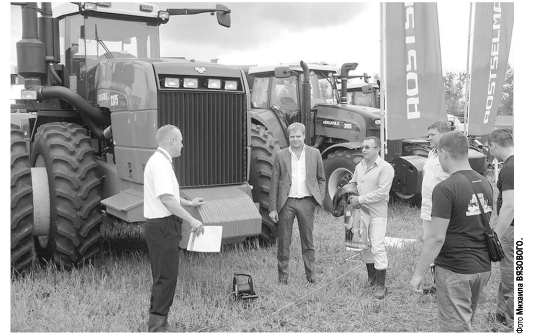
Тракторы VERATILE вызывают всё больший интерес у воронежских аграриев.

На Дне воронежского поля было представлено сразу несколько таких красивейших тракторов VERATILE в комплекте с задними спаренными колёсами. Тракторы от 335 до 400 лошадиных сил могут работать как с прицепными, так и с навесными агрегатами шириной до 12 метров. Серия ННТ объединяет тракторы мощностью в 435, 485, 535 и 575 л.с., специально разработанные для выполнения самых энергоёмких операций. Даже при глубоком рыллении почвы такие тракторы расходуют не более 14 литров дизельного топлива на гектаре, а при работе с посевным комплексом – всего 5 литров на гектаре. Выделяется и то, что при гигантской мощности даже 575-сильные, на восьми колёсах тракторы VERATILE имеют радиус разворота менее пяти метров.