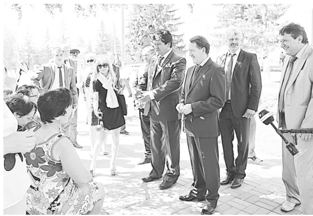
Алексей Гордеев отметил оптимистичный настрой жителей Нижнедевицка.

жал министр строительства и ЖКХ Российской Федерации Михаил Мень, с которым мы обсуждали программу «Чистая вода». Очень важно, что Правительство РФ решило продолжить эту программу.