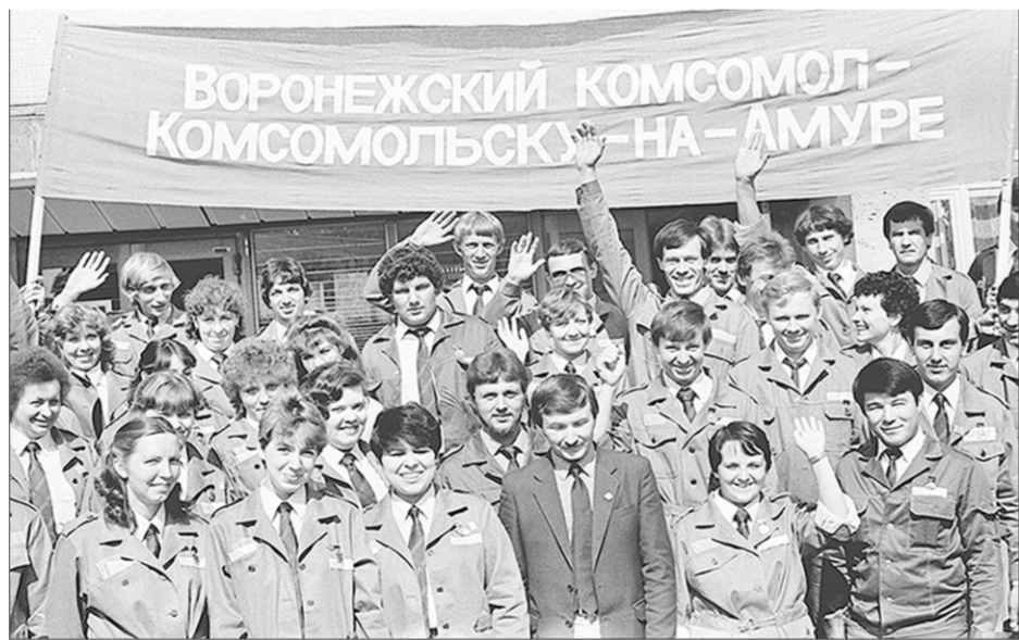
Этот снимок сделан нашим фотокорреспондентом Михаилом Вязовым 40 лет назад.

Но, несмотря на все трудности, вспоминается и то, как замечательно, дружно и весело жили и трудились. И отдыхать уметь! Конечно, приезжали с концертами многие известные артисты, но и самодеятельность своя была.