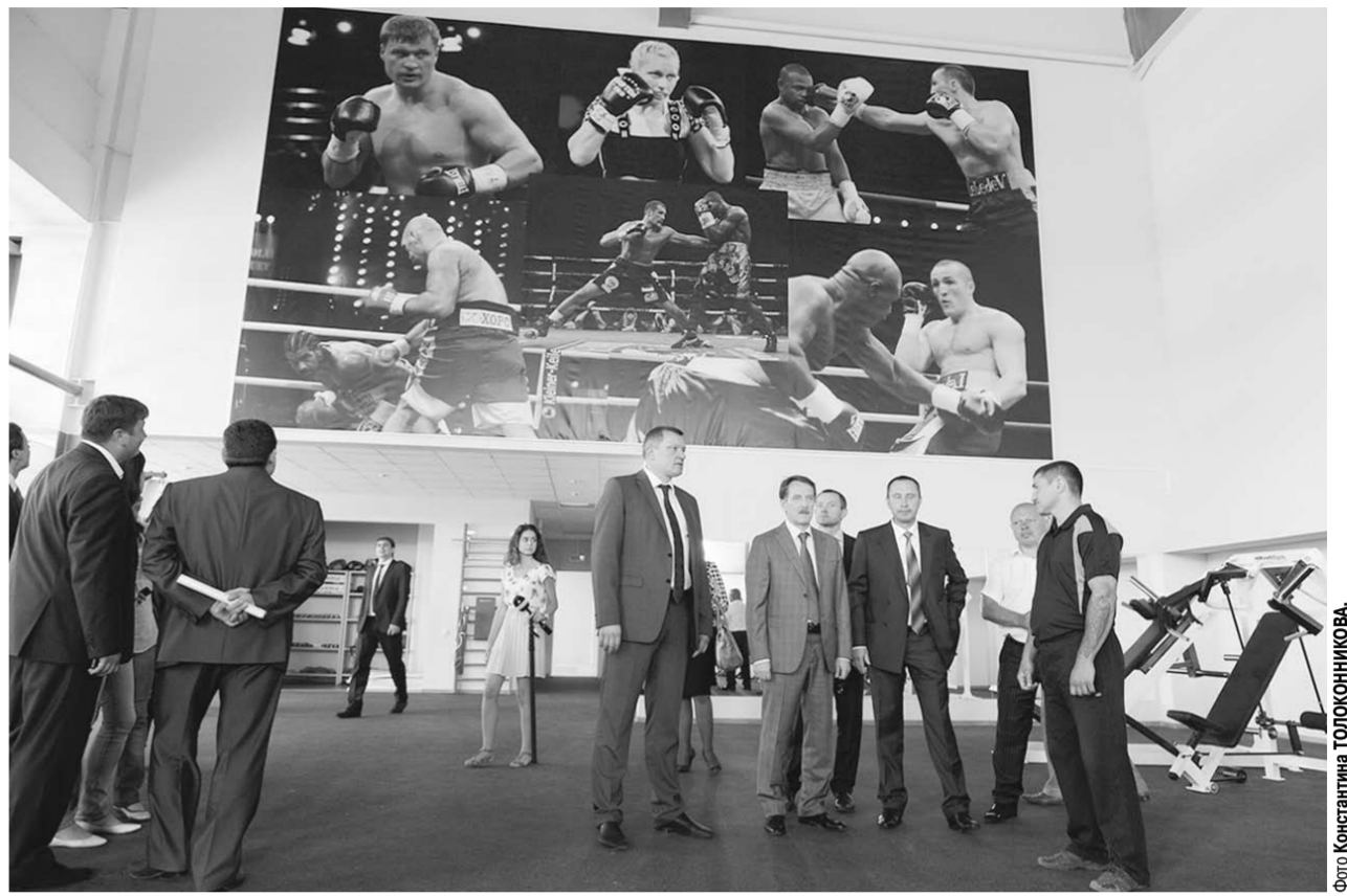
Алексей Гордеев знакомится с новыми спортивными сооружениями.

Увиденное, несомненно, впечатлило. Тем более, мне довелось писать о рабочей поездке Алексея Гордеева в город атомщиков в январе 2012 года. Тогда он посетил старое спортивное сооружение, которое у главы региона вызвало удручающее впечатление. Обновления требовало буквально всё, и губернатор, ознакомившись с уже готовым проектом по реконструкции стадиона, принял решение реализовать его поэтапно совместно с государственной корпорацией «Росатом». По сути, предстояло построить новый, современный комплекс мирового уровня.