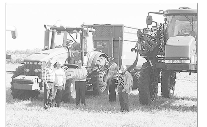
Новая техника – новые возможности.

В минувшую субботу в Эртиле прошёл День эртильского поля. Этот праздник, начало которому было положено четыре года назад, в районе становится всё более популярным, и не только у аграриев. С особым удовольствием, например, на него приходят и дети, которым в этот день можно забраться в кабину современного комбайна, посидеть за рычагами тракторов.