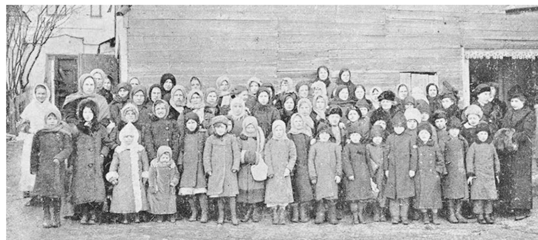
Дети призванных на войну посещали столовую Воронежской общепедагогической организации.

С особой серьёзностью власти относились к конфликтам между рабочими и начальством. В таких случаях ВГЖУ старалось действовать на опережение и в кратчайшие сроки предотвращать назревающие события. Так, полицейский агент на заводе Столла и К° по агентурному псевдониму Понельников донёс в ВГЖУ, что 7 ноября 1915 года по при-