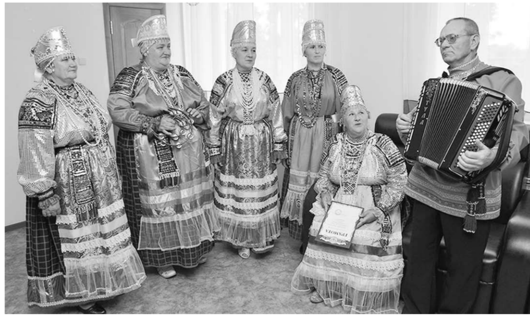
Местный фольклорный ансамбль.