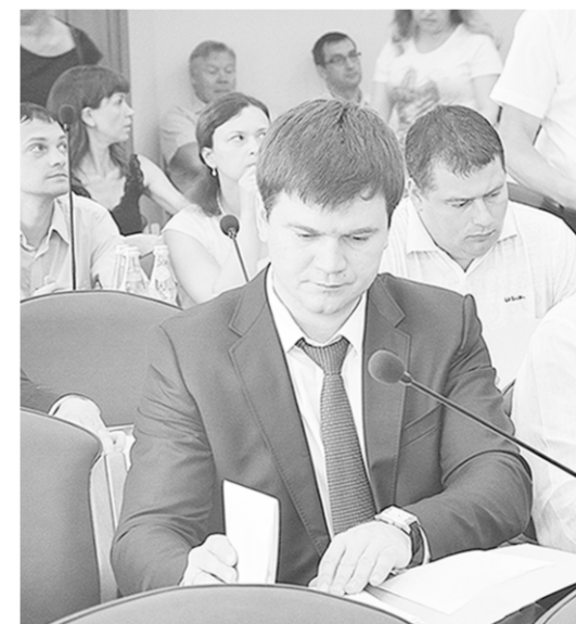
Отчёт мэра был одобрительно воспринят депутатами.

В ходе заседания были согласованы предложенные изменения в структуре городской администрации. Как уточнил Александр Гусев, отвечая на вопросы депута-