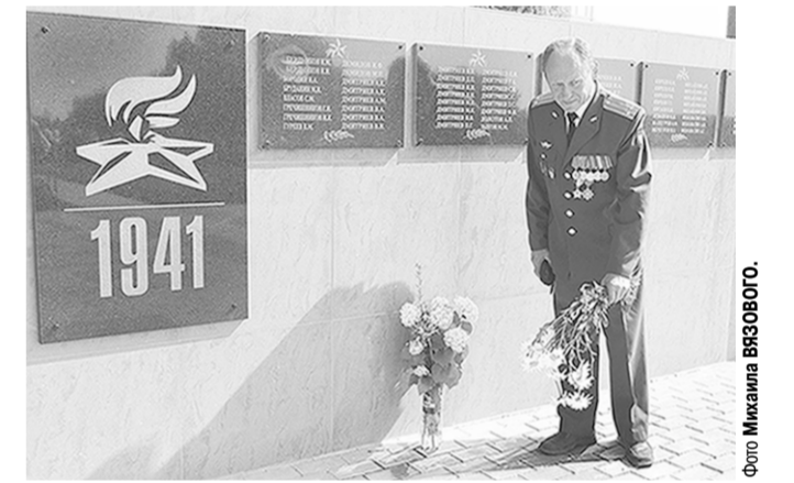
В селе Горки открыли отреставрированный памятник жителям села, погибшим на фронтах Великой Отечественной войны.