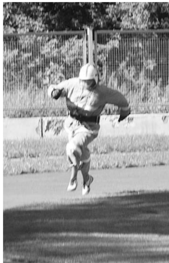
Огнеборец на полосе препятствий.

На городском стадионе «Урожай» состоялся ежегодный смотр-конкурс среди добровольных пожарных дружин Калачеевского гарнизона пожарной охраны Воронежской области. В соревнованиях участвовали тринадцать команд, представленных городским и сельскими поселениями.