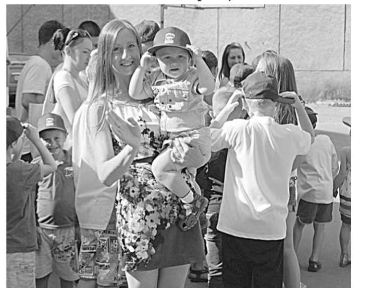
Бейсболки прилипли по душе.

«Единая Россия» благодарит всех, кто не оставил людей один на один со своей бедой и оказал им поддержку.