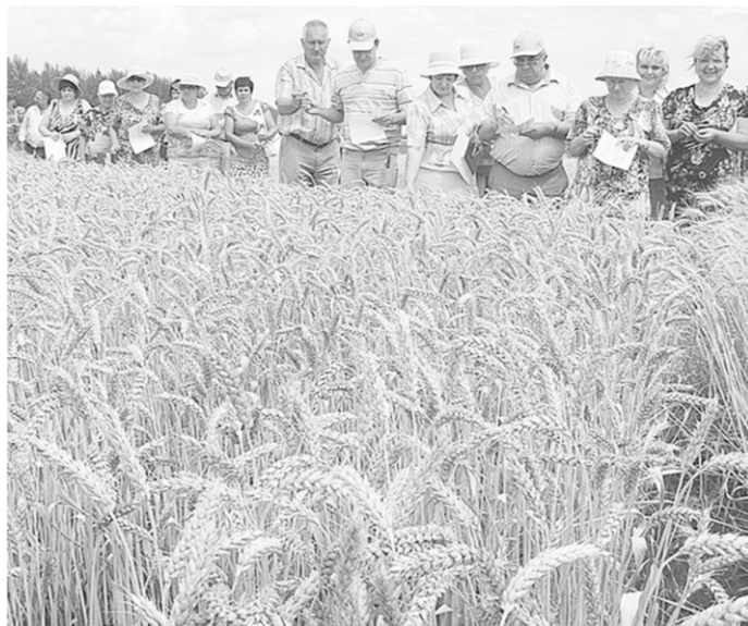
На демонстрационных участках озимой пшеницы.

А на полях области набирает силу жатва. И опытные руководители и агрономы, глядя на поля, на демонстрационные участки «Павловской нивы», не сходят это за труд, а расстояние за расстояние, выбирают семена для скорого – не успеешь оглянуться – сева озимых.