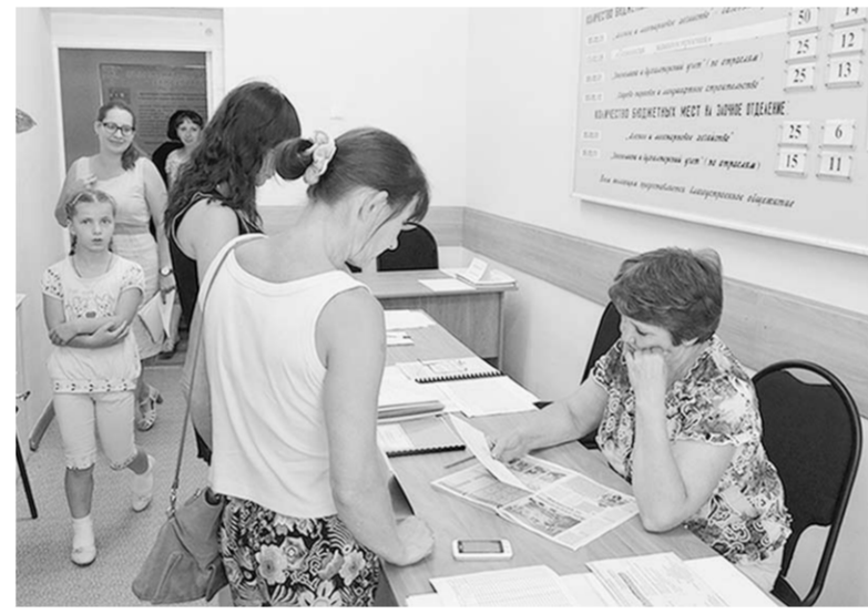
В приёмной комиссии.