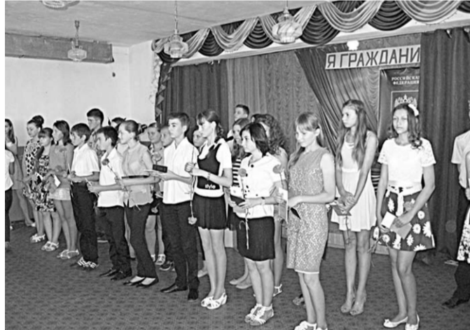
Юные калачеевцы с паспортами в руках.

Торжественная церемония вручения паспортов школьникам прошла в районном Дворце молодежи в праздничной обстановке. Ребята получили не только свой главный документ, но и Конституцию России и сувениры на память.