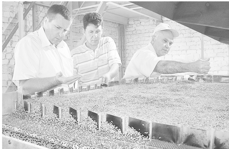
Пневмопостол – «визитная карточка» семенного завода.

Сегодня и завтра АПК | В безупречно правильной постановке семеноводства, тесной связи его с наукой и самой современной практикой – ключ к повышению эффективности аграрного комплекса