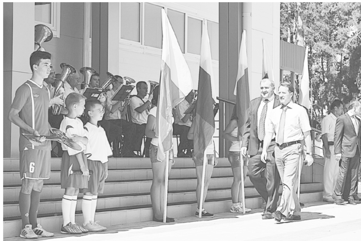
Открытие ФОКа стало в Павловске большим праздником.

Мы взяли курс на то, чтобы сделать Павловск городом красивым и современным, городом, в котором