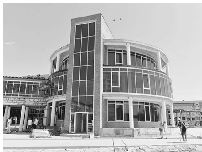
Во Дворце культуры уже идут отделочные работы.