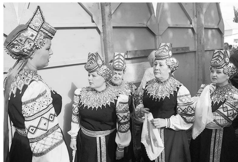
Соллисты Павловского хора имени М.Н. Мордасовой перед выступлением на Российском фестивале памяти М.Е. Пятницкого.