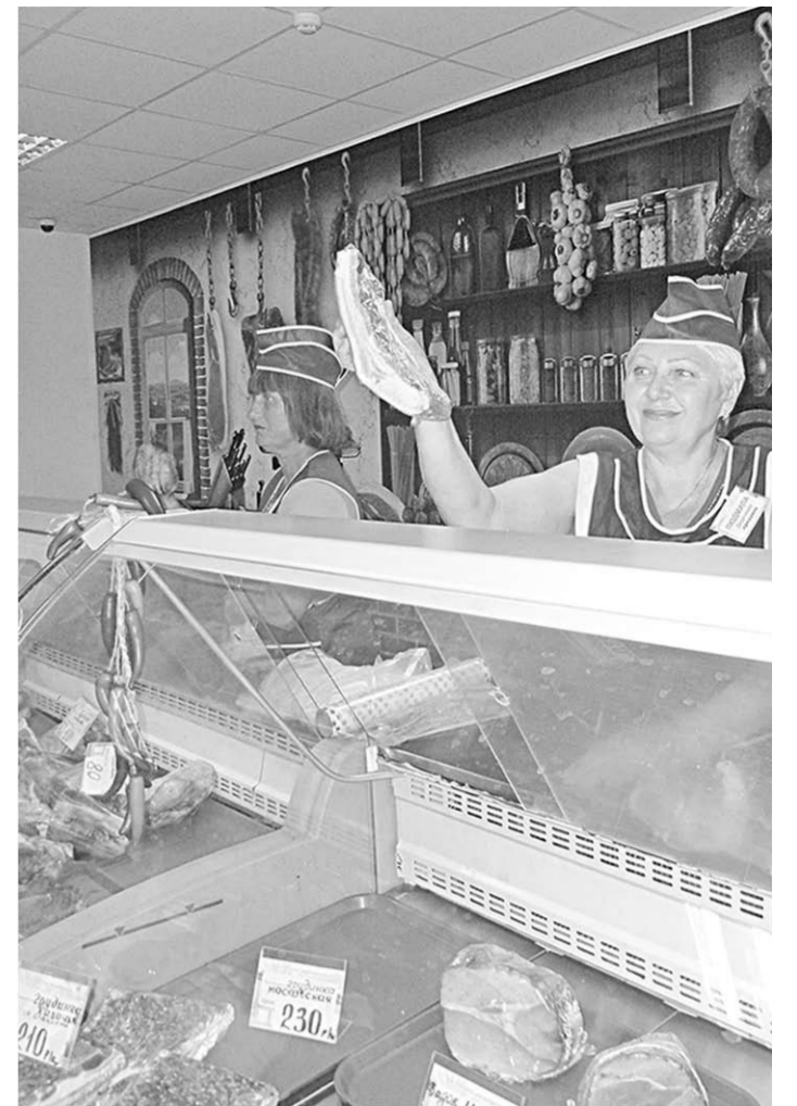
Даже самый взыскательный покупатель найдет в магазине всё, что душе угодно.

За работу здесь держатся, качества кадров практические