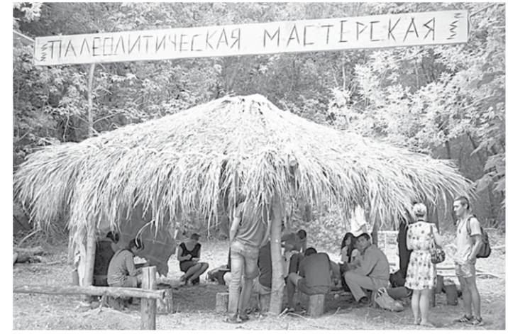
Мастер-класс помог что-то понять о жизни первобытного человека.

Что же касается описанного выше мастер-класса, тот в музее-заповеднике вовсе не последний. Они ещё будут проводиться в течение всего экскурсионно-туристического сезона – по предварительной записи.