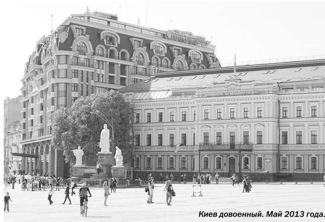
Киев довоенный. Май 2013 года.

Не поверив самому себе, позвонил украинским друзьям, спросил: «Неужели и впрямь существует в народе такая песня?» И услышал в ответ: «Да что ты! Нет такой песни