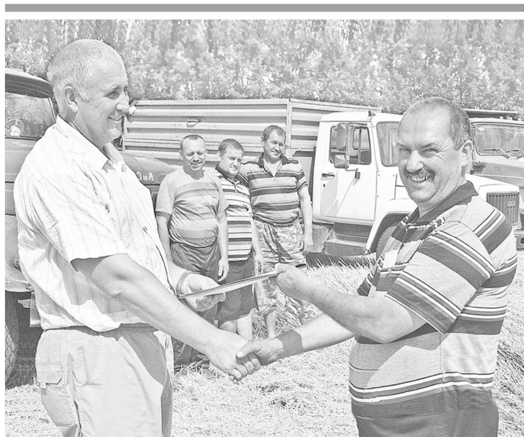
А через минуту – вновь за работу.

«КОММУНА» – САМОЕ ЦИТИРУЕМОЕ В РОССИИ ВОРОНЕЖСКОЕ ПЕЧАТНОЕ ИЗДАНИЕ ИСТОЧНИК: результаты мониторинга компании «МедиаЛогик» за I квартал 2014 г.