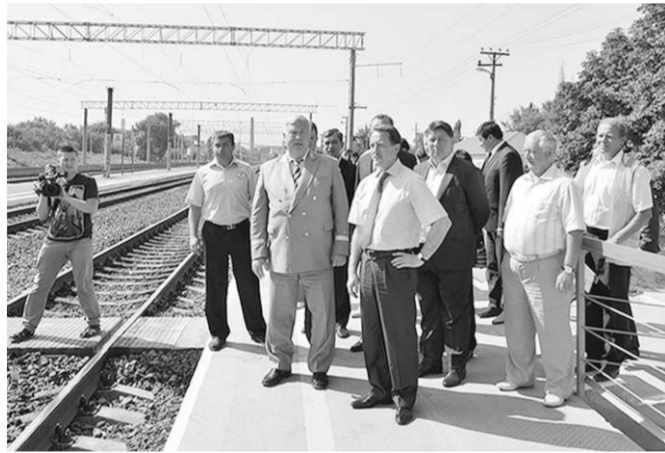
Алексей Гордеев на железнодорожной станции Подгорное.

Глава региона ознакомился с проектом строительства автомобильной дороги восточного обхода посёлка Подгоренский. Пуск новой технологической линии на цементном заводе требует большей пропускной способности. Существующие дороги не рассчитаны на всё более возрастающую загруженность тяжёлым автотранспортом. Руководство холдинга «ЕВРОЦЕМЕНТ групп» и глава администрации Подгоренского муниципального района начали совместную деятельность по решению этой проблемы. Врио руководителя департамента транспорта и автомобильных дорог Воронежской области Александр Деметьев доложил Алексею Гордееву, что «ЕВРОЦЕМЕНТ групп» профинансировал проектирование новой дороги на сумму свыше 16 млн. рублей. В данный момент