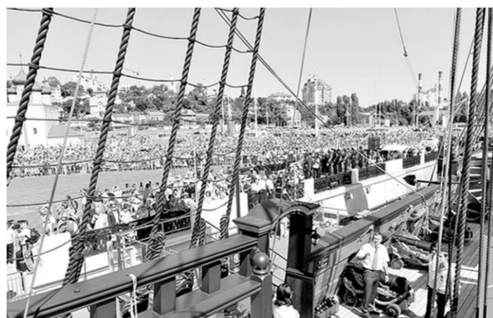
На открытие корабля собрались сотни воронежцев.

К гостям праздника с приветственным словом обратился митрополит Воронежский и Лискинский Сергей: — Сегодня мы словно возвращаемся в начало истории нашего края, когда Воронеж был форпостом Отечества, большим пограничным городом. Им он остаётся и в наше время, в XXI веке. История повернулась так, что мы снова стоим на границе. И мы должны помнить заветы