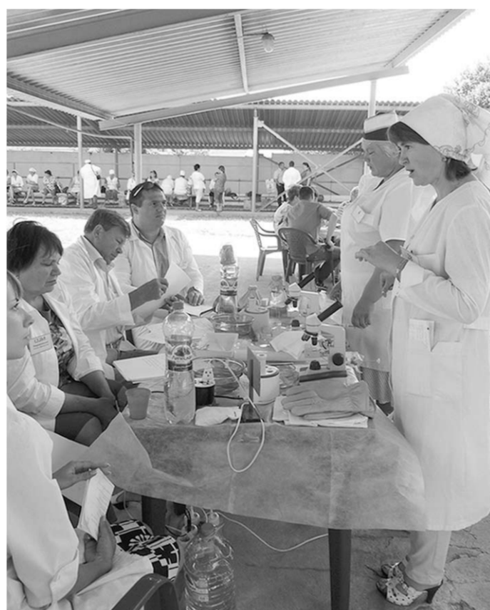
Проверка на знание теории.

Почему искусственное осеменение так важно для молочного производства? А