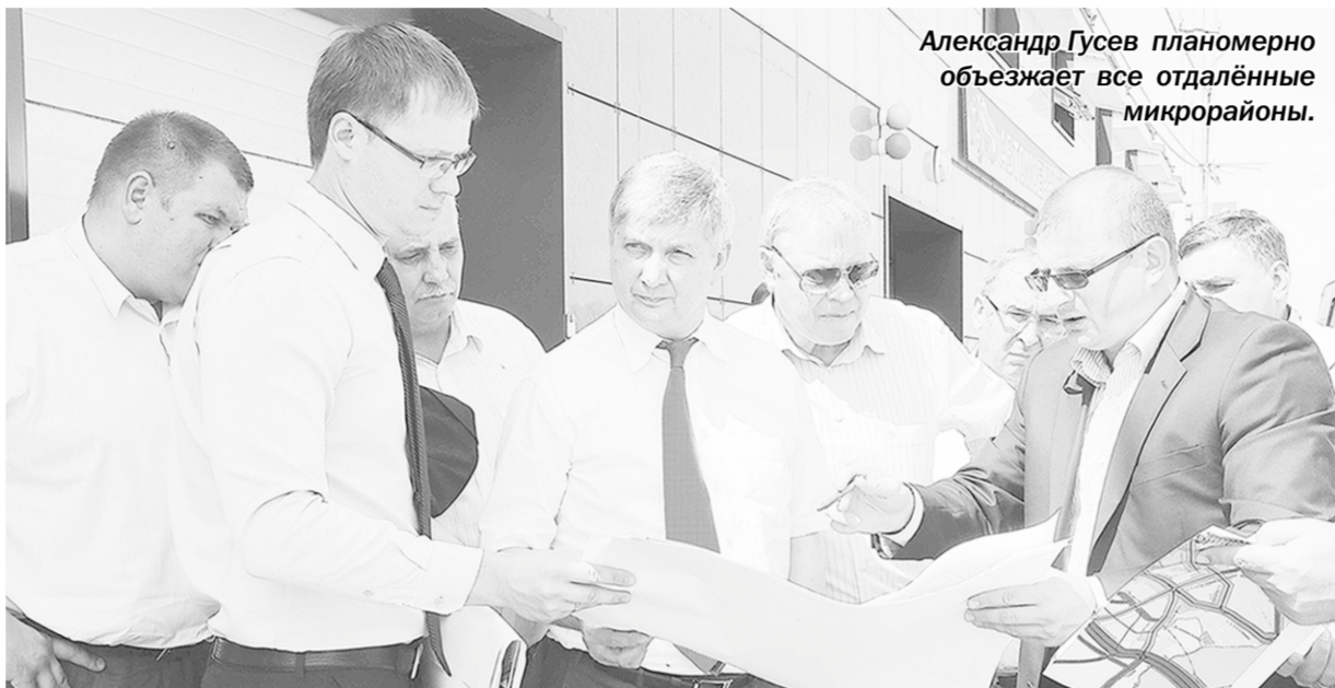
Александр Гусев планомерно объезжает все отдалённые микрорайоны.

Мегаполис | Главными проблемами отдалённых территорий Воронежа по-прежнему остаётся развитие социальной инфраструктуры и дорожно-транспортной сети