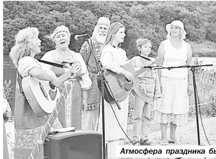
Атмосфера праздника была душевной и искренней.

Праздник удался и стал своеобразной точкой отсчёта. И хуторяне решили, что отныне День Атамановки станет у них традиционным.