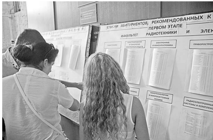
Вузы готовят списки поступающих абитуриентов.

В Воронежском государственном архитектурно-строительном университете в лидеры выбыл архитектурный факультет - в среднем семь человек на место. В лесотехнической академии большинство абитуриентов выбрали автомобильный факультет. А в Воронежской государственной академии искусств за место на актёрском факультете боролись три человека.