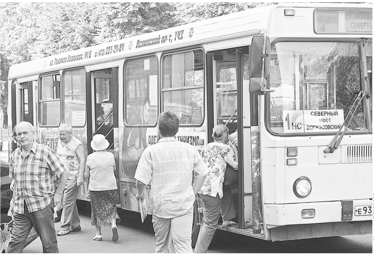
Чтобы не нагнетать страсти, хочу сразу сказать: региональное правительство не планирует закрытие проекта «Народный маршрут» в ближайшее время. Однако проблемным сей проект не назовёшь, а горожане не зря советуют органам власти присмотреться к опыту других городов – об этом речь идёт, к примеру, на портале улучшения делового климата в Воронежской области.

Экспертиза «Коммуны» | Более десяти лет в Воронеже выходят на линию «народные» автобусы. Властям спасибо за заботу, но почему же сейчас в городе циркулирует идея: отменить такой транспорт и ввести проездные билеты для льготников?