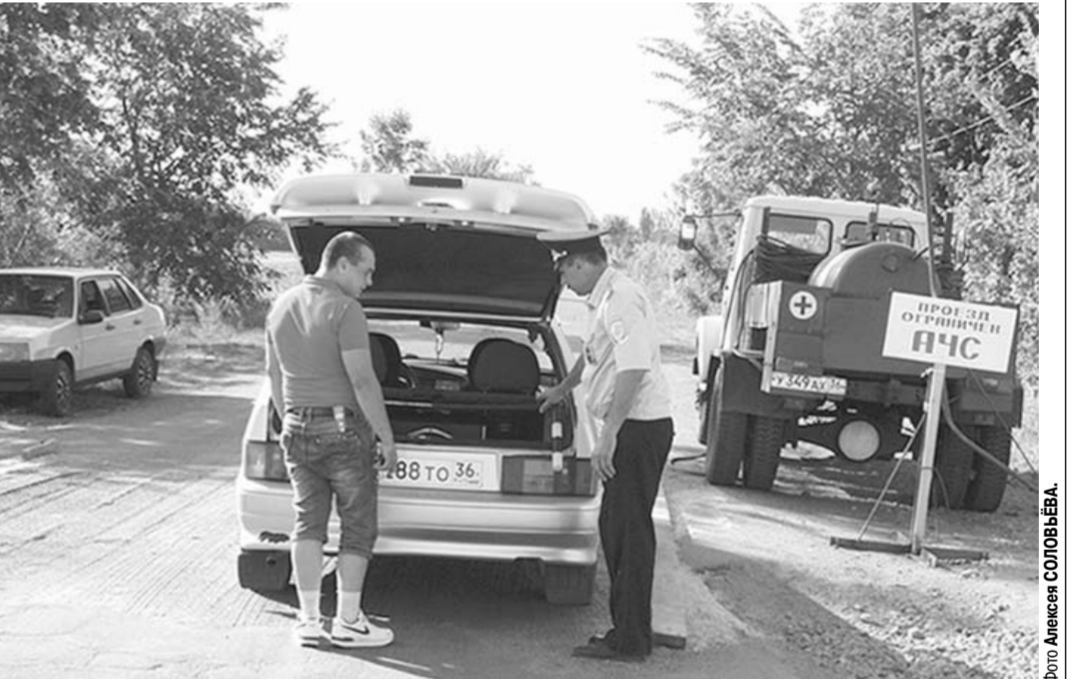
Проверка транспорта в зоне повышенной опасности.

Это ряд хозяйств в Верхнехавском районе – ООО «Спектр», ООО «Випшевский», ООО «Селекционно-гибридный центр», в Бобровском районе – ООО «МясокOMBИНАТ «Бобровский», ООО «Специализированное хозяйство Московское», в Рамонском – ООО «ТК «Мираторг», в Россоханском – ООО «АгроБизнес», Воронежский филиал ЗАО «Губинский мясокOMBИНАТ». А еще подразделения