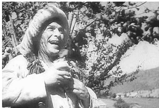
Кадр из фильма «Весёлые ребята».

По крайней мере, очень хочется, чтобы так оно и было.