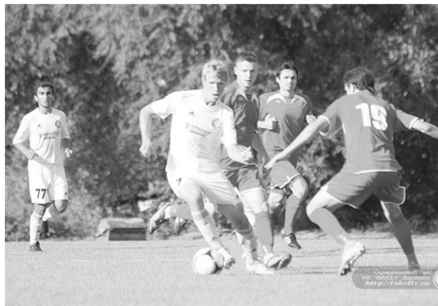
Пожалуй, тренерскому штабу «Факела» стоит пристально присмотреться к своим воспитанникам.