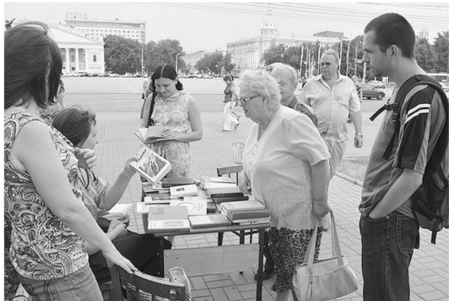
Случайных прохожих заинтересовала «Открытая читальня».

В сентябре в конференц-зале библиотеки имени И.С.Никитина, рассчитанном на 250 человек, в рамках Большого книжного фестиваля планируется проведение музыкальных концертов. Вход будет свободным.