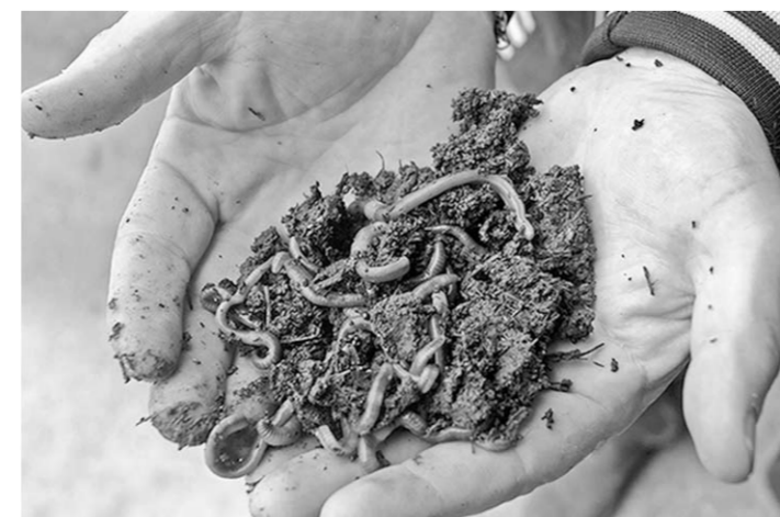
Его подопечные создают главное составляющее для любой почвы.