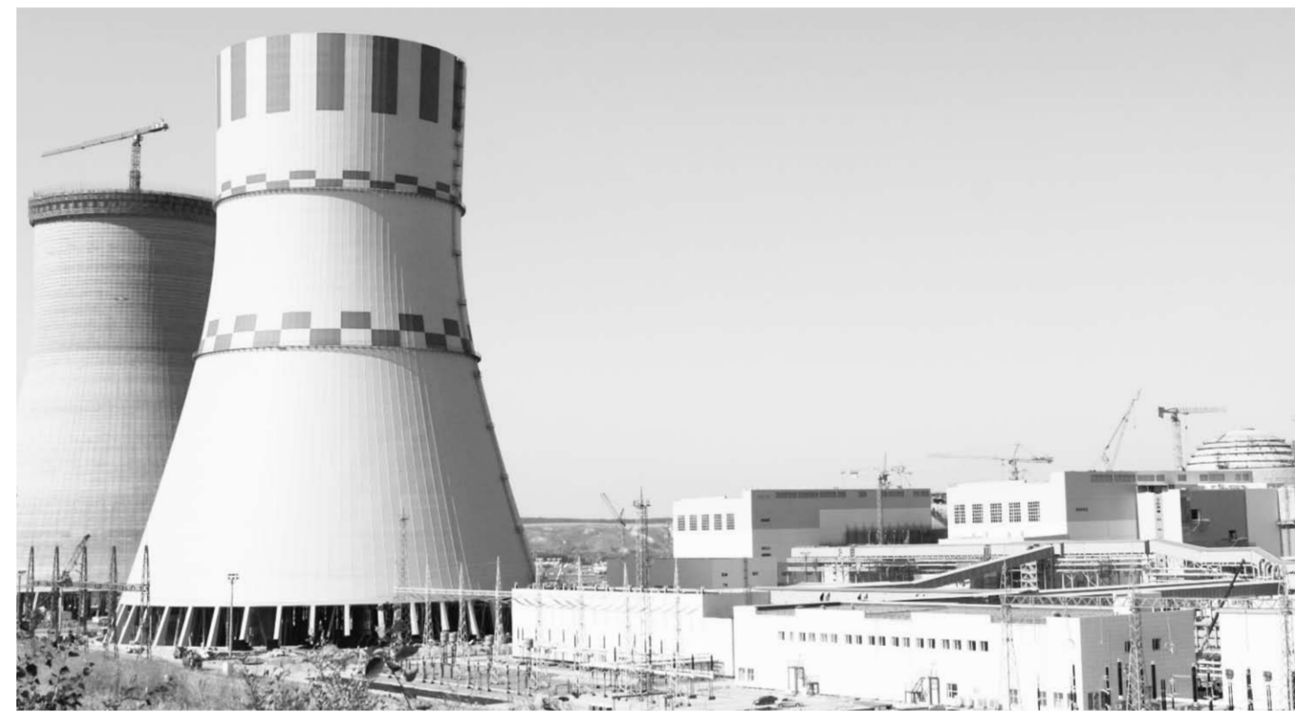
На строительной площадке НВ АЭС-2.