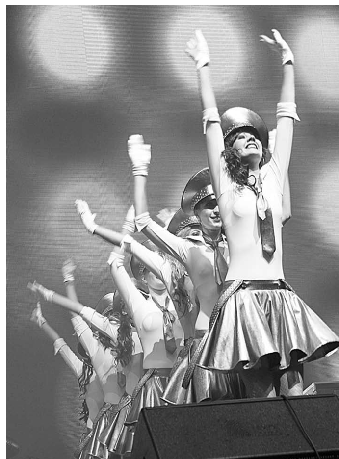
Воронежские таможенницы талантливы в самых разных сферах.

Мы привыкли видеть сотрудников таможи мурмыри, не всегда приветливыми, может, даже скучными людьми. На днях у воронежцев была возможность узнать их с другой стороны. Оказывается, среди таможенников много талантливых, творческих, ярких людей, которые приехали из разных городов (Москва, Белгород, Тверь, Ярославль, Тула, Смоленск, Курск и, конечно, Воронеж), чтобы показать, на что они способны.