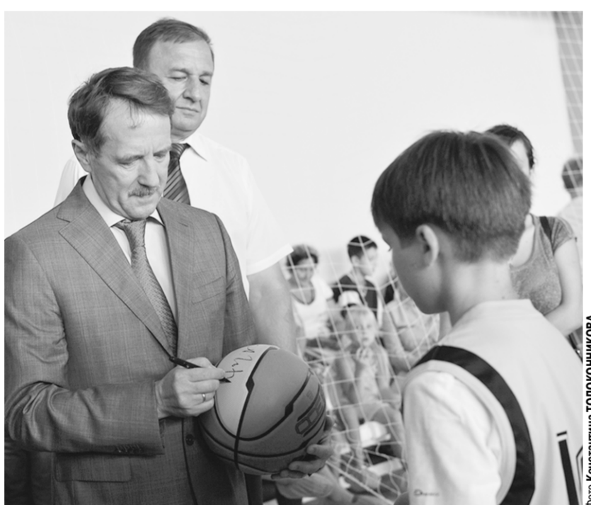
Алексей Гордеев оставил автограф на память юным спортсменам.