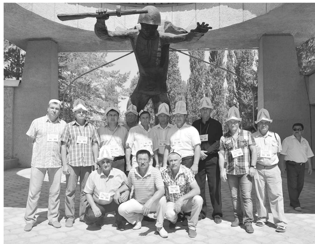
Представители киргизских диаспор у мемориала «Защитникам Сторожевского плацдарма».