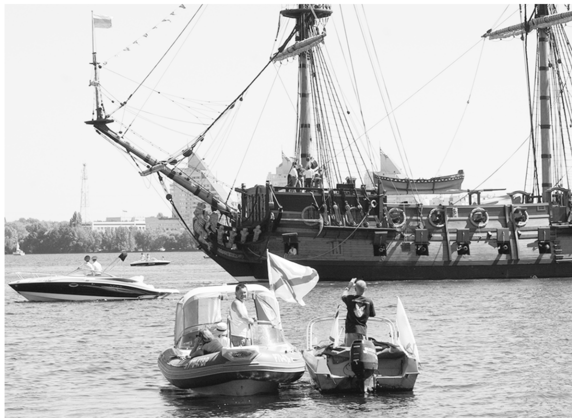
У Воронежа есть все возможности для развития водного туризма. В этом убеждаешься, глядя на меняющийся облик Воронежского водохранилища.

На первом этапе необходимо проработать наиболее перспективные туристические маршруты. Они должны обязательно стартовать из Воронежа и охватывать наиболее привлекательные места в городе и области. На втором этапе потребуются привлечение частных инвесторов. Ведь на «Гото Предестинация» и единственным курсирующим по глади Воронежского водохранилища теплоходе речной туризм не построишь. Необходимо привлечение частного капитала для повышения транспортной доступности. А чтобы инвестору было выгодно подобное вложение денег, следует проработать ряд мер муниципальной и городской поддержки (субсидии, налоговые льготы, упро-