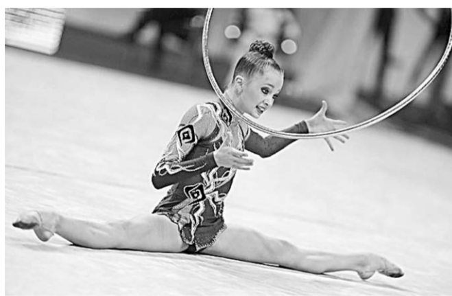
Воронежская гимнастка Дарья Дубова - победительница II летних юношеских Олимпийских игр.