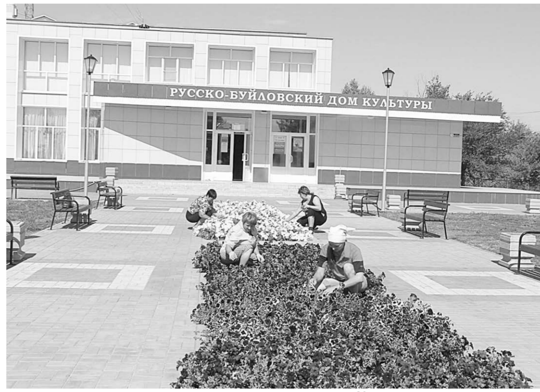
Украсим село своими руками.

недавно в этой связи вижу задачу в том, чтобы сделать комфортными для проживания все отдалённые уголки села. Чтобы на каждой улице для дворов была организована зона отдыха. Чтобы дорожное покрытие было хорошим. Чтобы водопроводная сеть благополучно расширилась. В этом году нам удалось проложить водопровод по одной из улиц села (всего за последние годы проложено 12 километров сетей). В перспективе у Русской Буйловки – строительство новой пожарной части, приобретение техники, которая облегчит работу наших коммунальщиков. Так, во время недавней поездки в Краснодарский край увидел машину, которая помогает превращать спилленные деревья и ветки в щепу. Полезная техника, сразу взял на вооружение.