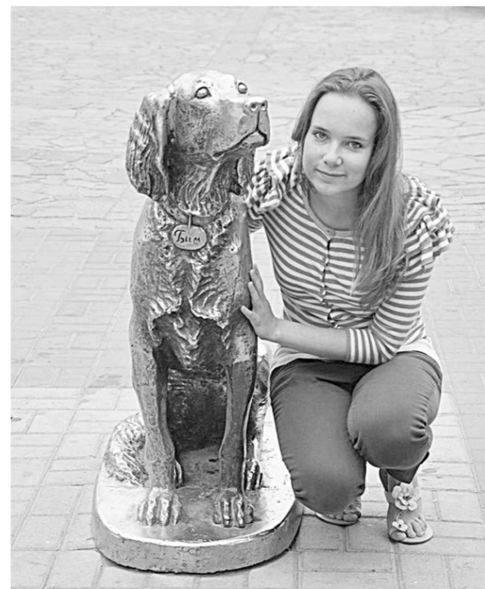
Автор зарисовки со своим любимым литературным персонажем.