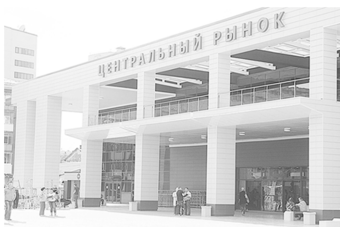
Так выглядит Центральный рынок с улицы...

Обновленный рынок – это 800 торговых мест и подземный паркинг на 667 машиномест, организованных на «минусовых» ярусах для удобства покупателей. Реконструкция обошлась в 1,363 млрд рублей,