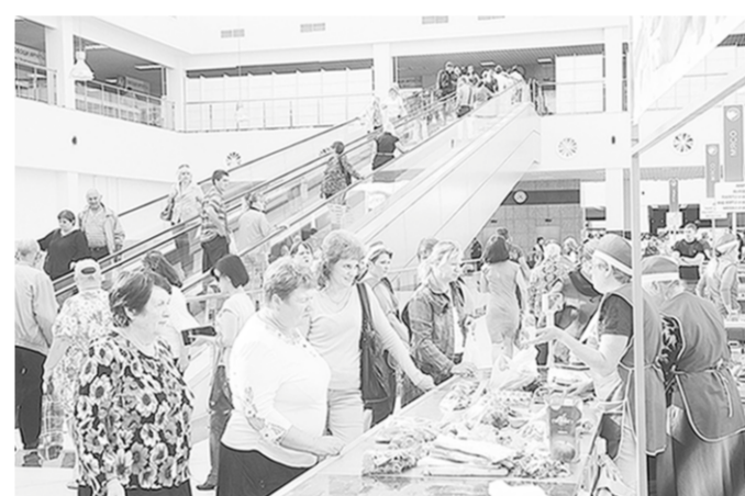
...а так внутри.

качественной и натуральной. Это подчеркнул губернатор Алексей Гордеев, который также был в числе первых посетителей. Он прошел по всей территории рынка, посмотрел