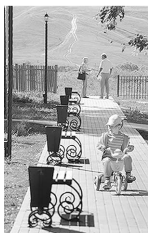
Парк села Верхнее Турово.

Преобразился и сквер возле памятника павшим в селе Верхнее Турово. Здесь оборудовали новые детские площадки, и теперь малышам тут раздолье.