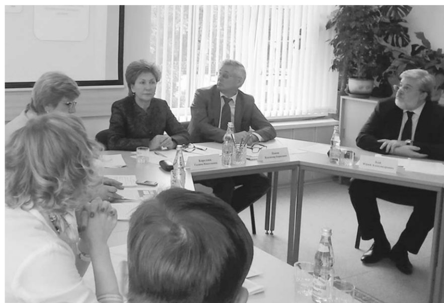
В ходе тематического «круглого стола», посвящённого важной проблеме межведомственного взаимодействия в вопросах социальной реабилитации и занятости инвалидов, были услышаны все стороны.

В регионе среди детских учреждений социальной защиты базовым звеном определён областной центр реабилитации для детей и подростков с ограниченными возможностями «Парус надежды». Молодые люди с ограниченными возможностями здо-