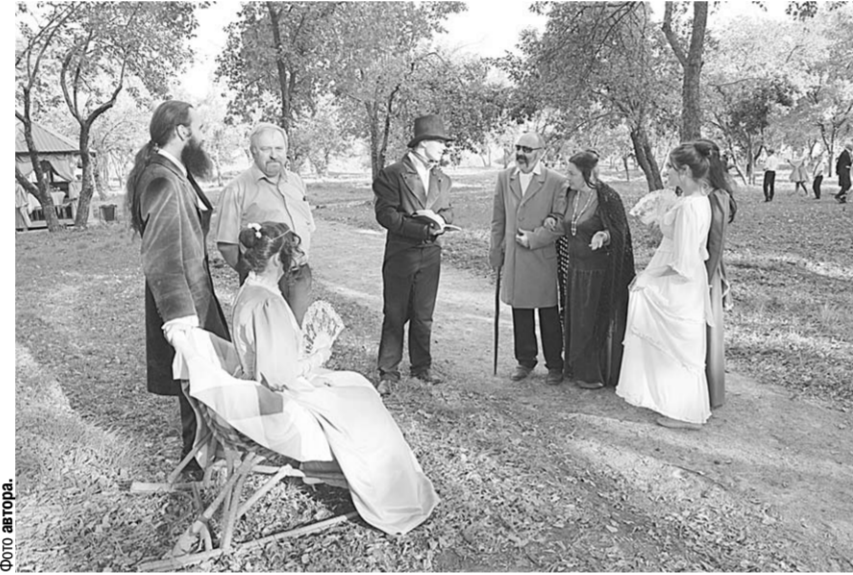
На аллеях парка легко можно было встретить «барина и его гостей», одетых по моде XIX века.

«Пожелай же нам, листопад, - вдохновения и будущих встреч», - пел местный солист со сцены. Пожалуй, своими словами он передал общее настроение. Придет время и «Удеревский листопад» снова позовет нас на встречу.