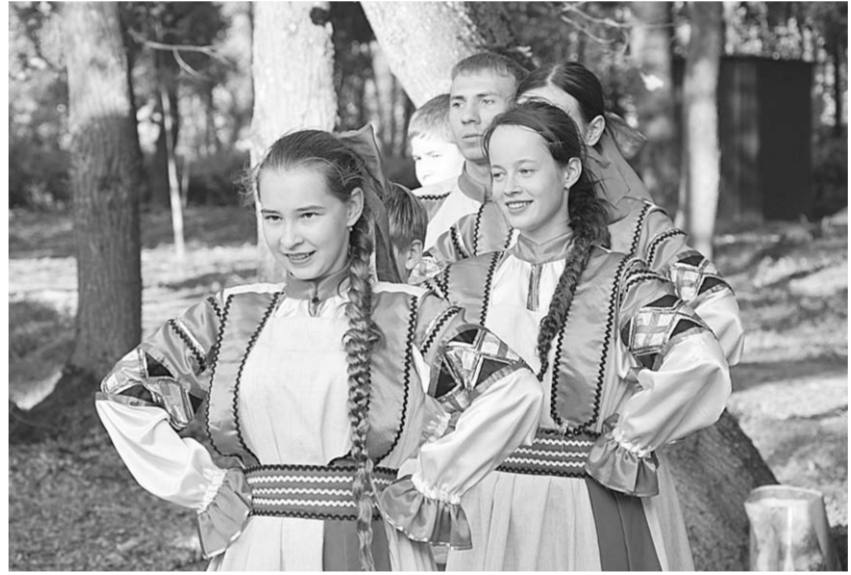
Студенческий ансамбль «Раздолье» из Алексеевского филиала Белгородского университета был одним из украшений праздника.