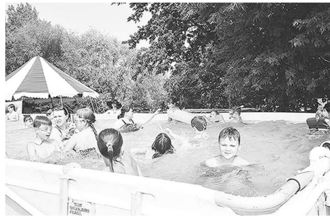
Лето - 2014: дети работников ОАО «Минудобрения» на базе отдыха «Дон».

Заводчанам доступны самые разные виды обследования: сердца – с помощью электрокардиографа и аппарата Холтера, желудочно-кишечного тракта фиброгастроэскопом и колоноскопом, а также бронхоскопия и проверка органов дыхания на цифровом флюорографе.