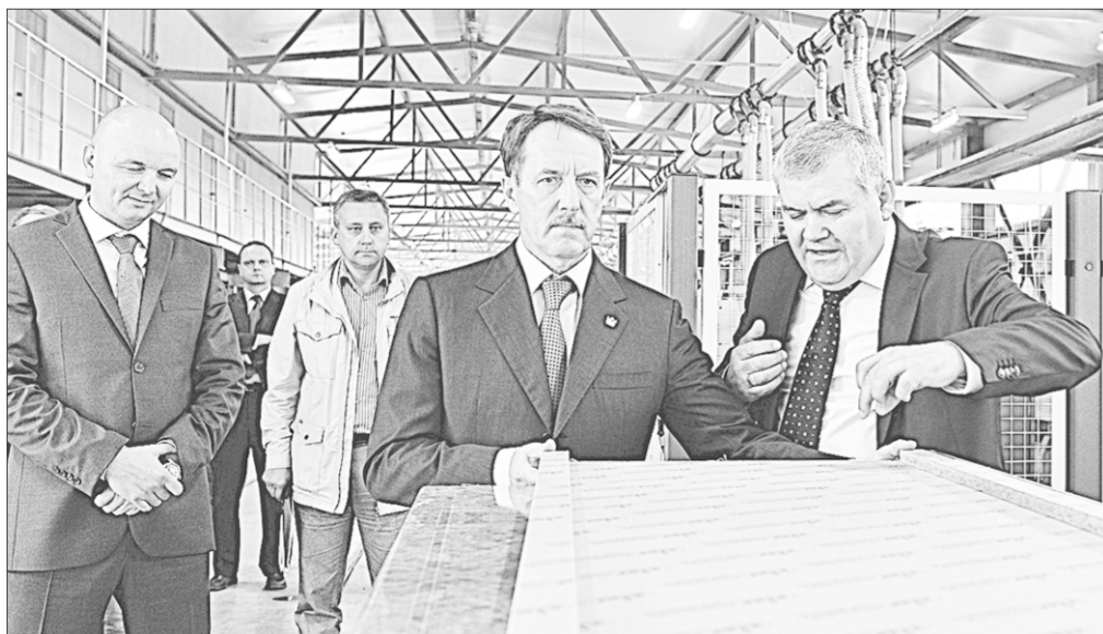
В «Кедре» Алексей Гордеев оценил качество производимой продукции.

Рабочую поездку Алексей Гордеев начал с посещения средней школы в селе Губарево, которая открылась первого сентября. Здание возвели за короткий срок, а ранее школьникам разных поколений на протяжении пятидесяти лет приходилось ютиться в старинной усадьбе Сомовых, где не было не только спортивного зала, но даже столовой и канализации.