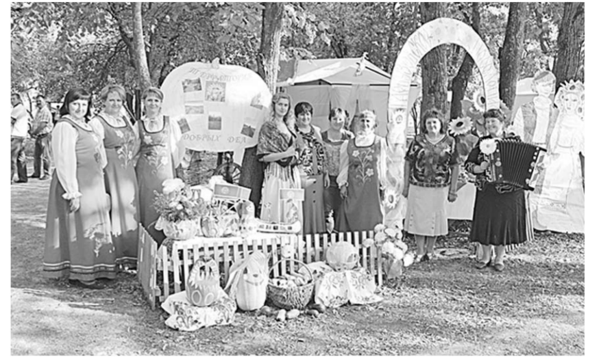
Участник фестиваля народного творчества - самодеятельный коллектив из Гарбузовского сельского поселения.

Была ли в царившей в усадьбе обстановке какая-то наигранность?