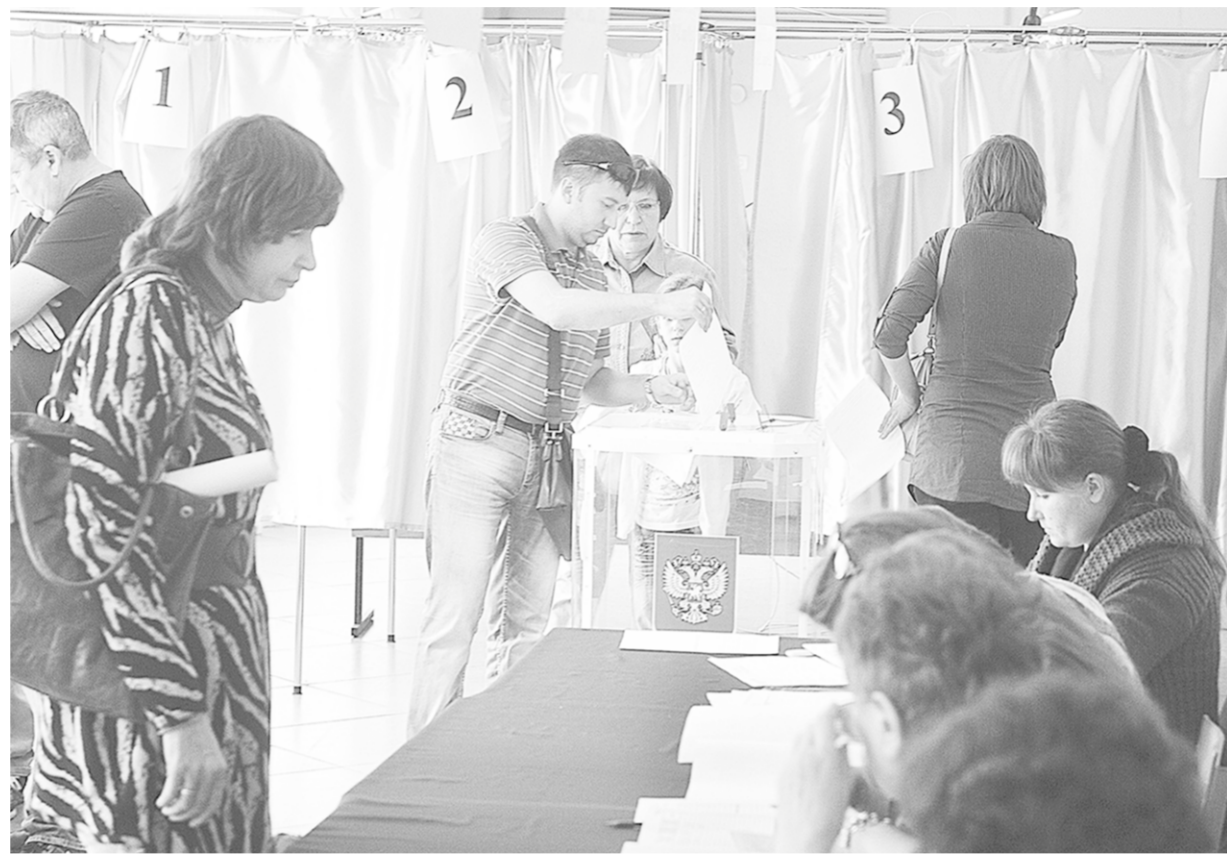
На одном из избирательных участков Воронежа. Люди выбирают губернатора.

Выборы-2014 | В Воронежской области определили лидера на ближайшие пять лет