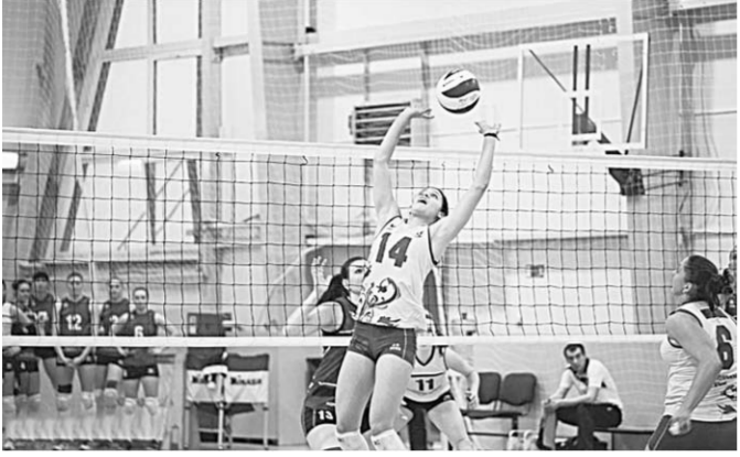
Родные стены помогли воронежским волейболисткам занять первое место.

Женский волейбольный клуб «Воронеж» стал победителем Кубка Федерации волейбола Воронежской области. Наш сильно обновлённый коллектив поочередно обыграл белгородскую «Альтернативу» - 3:0, курский «Политех» - 3:1, нижегородскую «Спарту» - 3:0 и ВК «Обнинск» - 3:1. Надо отметить, что все четыре команды соперниц были ниже по статусу ВК «Воронеж», которому в этом сезоне предстоит дебют в суперлиге. Процесс комплектования команды идёт полным ходом, и времени для этого у тренерского штаба вполне достаточно. Сезон в элитном дивизионе стартует 22 октября. В первом матче подопечные Лёвона Джагяниана на своей площадке примут челябинский «Авгатор-Метар», знакомый нашей команде ещё по выступлениям в высшей лиге «А». Ну а пока в планах тренерского штаба ВК «Воронеж» проведение контрольных игр и участие в предсезонном турнире в Белоруссии.