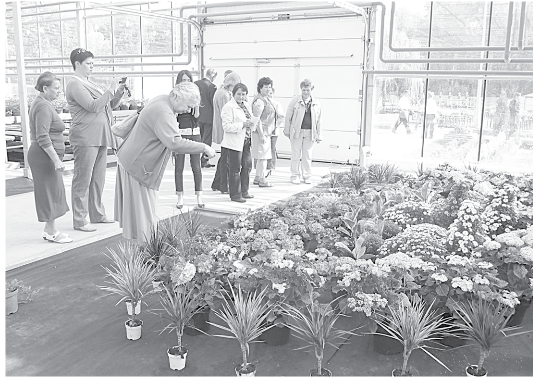
Первые посетители питомнического комплекса.

– Мысль много возникло, но пришли к самому разумному и оптимальному решению: академия заключила отношения с региональным Центром кластерного развития, благодаря которому были акмулированы усилия власти, бизнеса и науки для создания условий вузовского потенциала, – про-