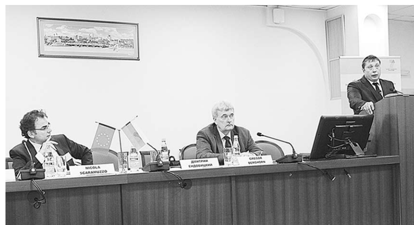
Информационная сессия «Европейские программы в области образования и науки».

Культура, образование – это те сферы, на которых и дальше будут строиться взаимоотношения, – отметил в свою очередь г-н Скарамуццо. – Здесь важно один раз увидеть, чем сто раз услышать. Когда человек знакомится с другой культурой, он становится в неё богаче. Каждая страна строит свои