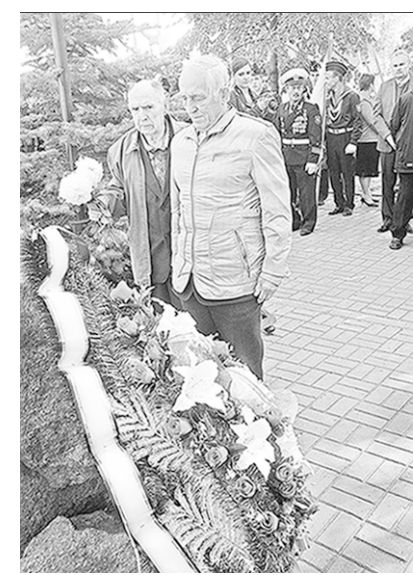
У памятного камня.

Вчера в сквере у Благовещенского кафедрального собора воронежские ветераны подразделений особого риска отметили три памятные даты.