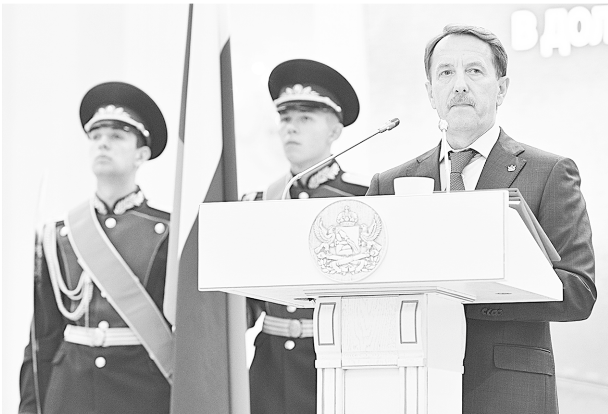
Торжественный момент принятия присяги и вступления в должность. 20 сентября 2014 г.

С приветственным словом выступил заместитель полномочного представителя Президента РФ в Центральном федеральном округе