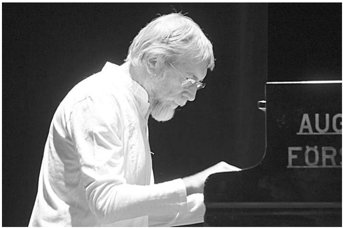
Владимир Мартынов, композитор и идеолог.

Оттого такие тревожные песни звучали: про стылую землю, про то, что «зимы не будет» (хотя, казалось бы, так ли это плохо?). «Далеко, далеко далеко, одиноко ли, ой одиноко». «На смерть, на смерть держи равнение, певец и всадник бедный». Но сквозь эту тоску