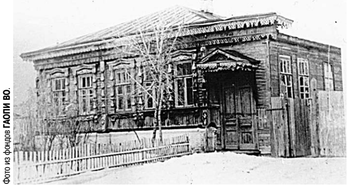
Здание, в котором в 1918 году располагался Борисоглебский уком РКСМ.

Реакция аудитории во время представления была крайне непривычной для актёров: зал дружно ухотывался над умирающим персонажем и молчал там, где следовало смеяться. По словам Виолетты Гудковой, «прежняя сцена и обновлённый зал говорили на разных языках. Пластика (психология) актёра старой реалистической школы, воспитанного на высоких классических образцах, диссонировала с поведенческими привычками «сырого зрителя» улицы». В то же время «появилось множество самодельных спектаклей и собственноручно сочинённых пьес, будто вся страна превратилась в сценические подмостки, на которых разворачивалась самозабвенная игра». Опыт Народных домов оказался гораздо более ценен для новой власти, чем опыт академических театров.