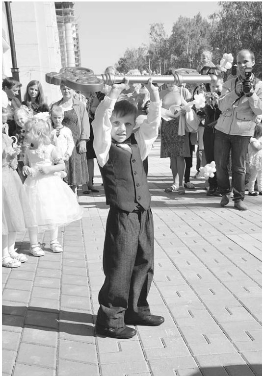
«Лесная сказка» теперь в руках детей.