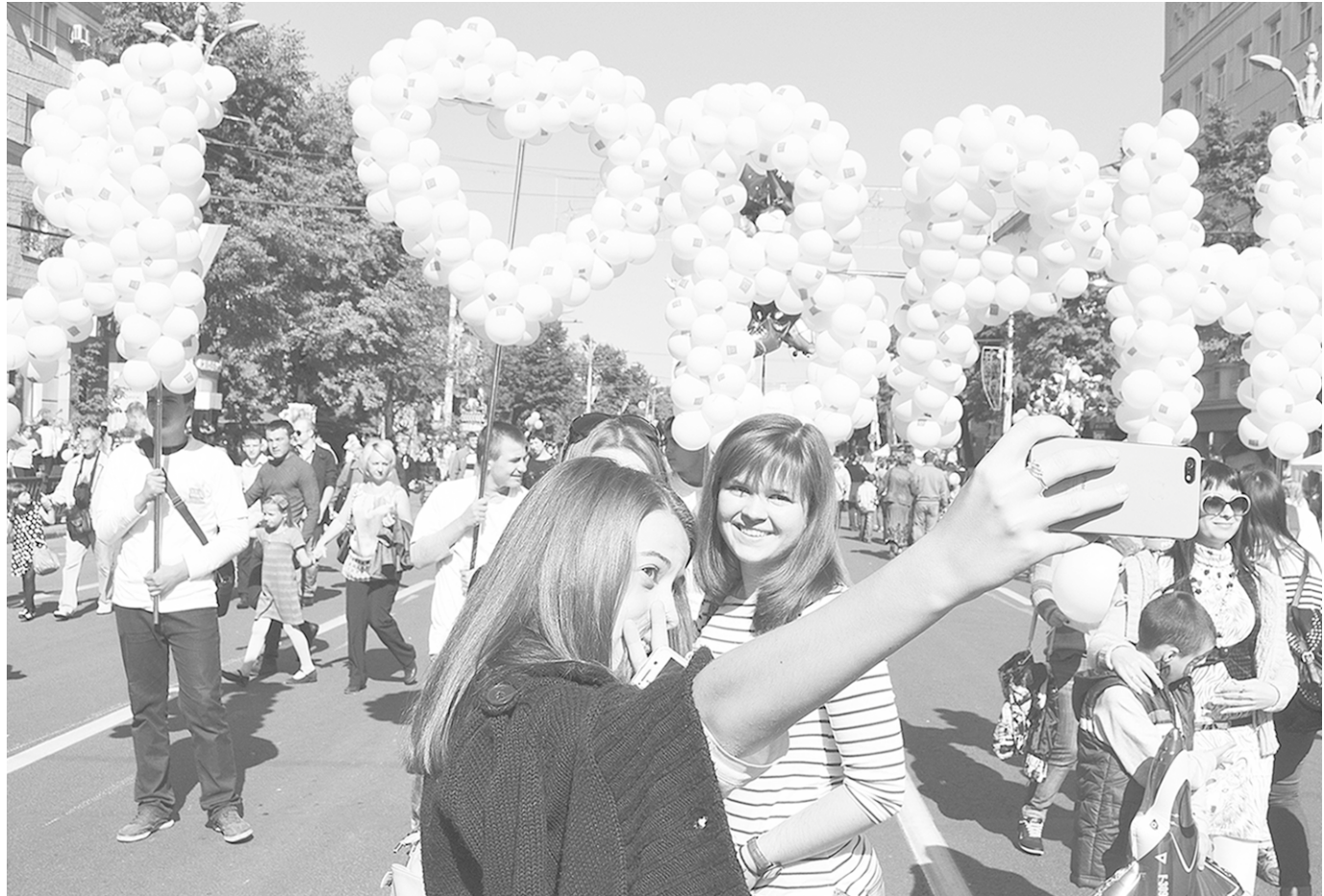
«Я люблю Воронеж!» — такие признания красовались на транспарантах и звучали из уст горожан.

Следующий номер «Коммуны» выйдет 26 сентября