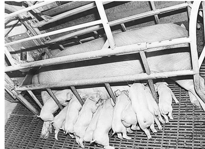
Только в идеальных санитарно-гигиенических условиях можно вырастить здоровое поголовье.

– Основными нарушениями, выявленными в ходе проверок, явились нарушения в сфере содержания, разведения и убоя свиней, а также хранения и реализации продукции свиноводства. – И насколько удовлетворили вас их результаты? – Основными нарушениями, выявленными в ходе проверок, явились нарушения в сфере содержания, разведения и убоя свиней, а также хранения и реализации продукции свиноводства.