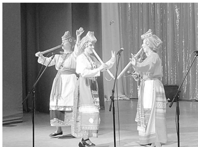
На фестивале представлено всё многообразие живущих в области национальностей.

Зрители познакомились с культурными традициями людей, которые проживают в Грибановском, Поворинском, Эртильском, Панинском, Верхнехавском, Аннинском, Терновском, Новохопёрском муниципальных районах и Борисовском городском округе. Представители национальных диаспор показали в стенах районного Дома культуры подлинное национальное искусство и предметы декоративно-прикладного творчества, угостили гостей блюдами национальной кухни. Затем состоялся концерт - в нём приняли участие пять творческих коллективов,