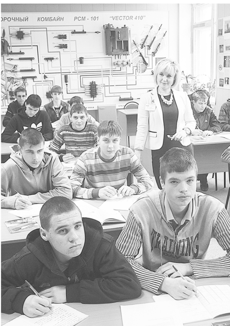
Аннинское профтехучилище готовит механизаторов для села. В отличие от современных менеджеров они владеют профессией и всегда будут востребованы.

Когда родители, которые хотят своим детям лучшей доли, тянутся изо всех сил и тратят большие деньги на обучение детей, а те потом работают по нелюбимой специальности, – разве это тоже не проблема? Только порождает её не общество, а сам человек. Впрочем, тезис этот спорный, поскольку известно: «ещё