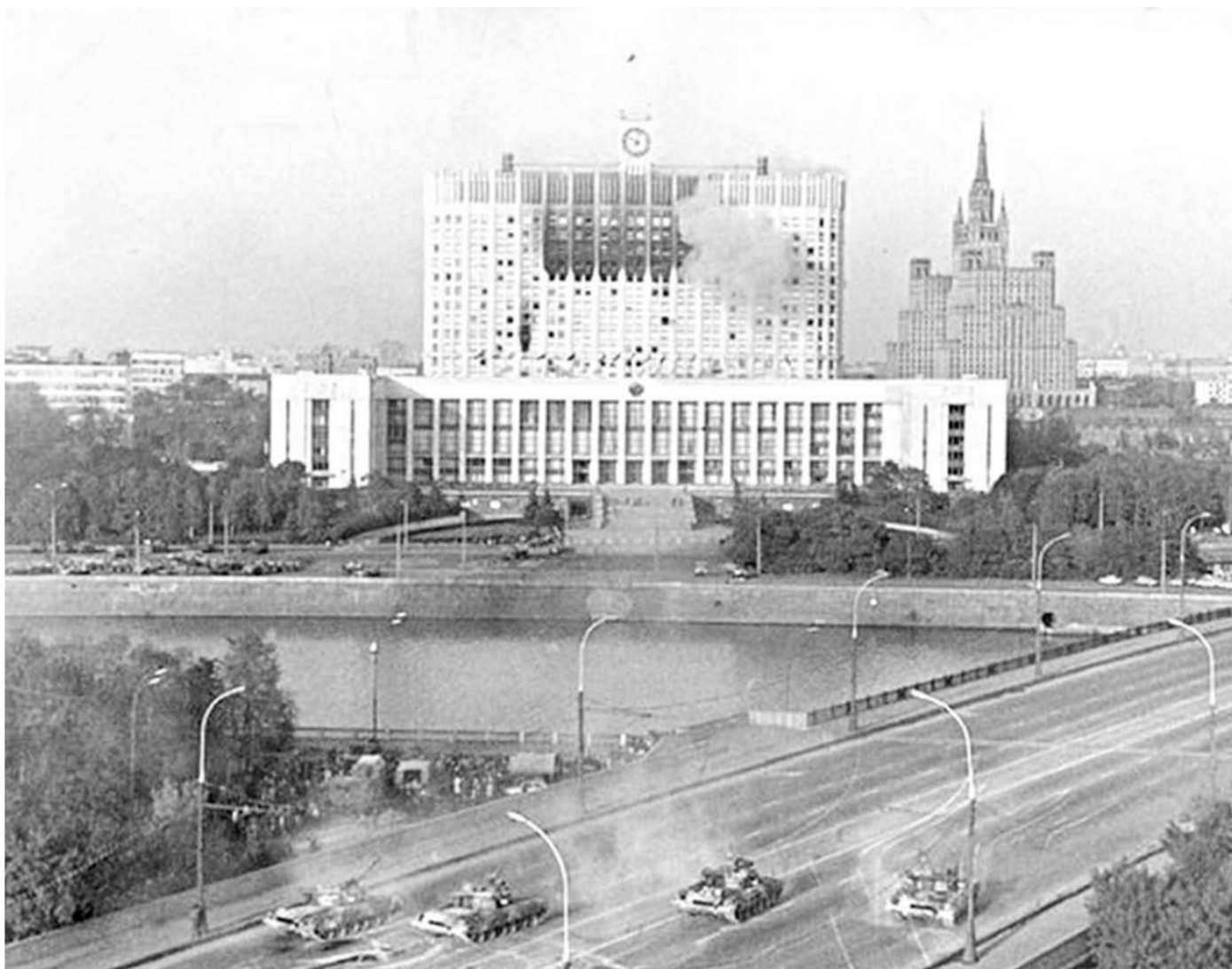
Москва, октябрь 1993 года.

Первый расстрел практически безоружных защитников баррикады произошёл 3 октября в 15.30 возле мэрии. Из окон лужковской котловы открыли автоматный огонь, а потом из гостиницы «Мир» — пулемётный. И тут же с крыши жилого дома в Большом Девятинском переулке стал бить снайпер. Ельцинские журналисты писали, что это был снайпер, посланный генералом Альбертом Макашовым из Белого дома. Враньё! Я сам был свидетелем того, что в запущенных улочках и переулках вокруг здания парламента находилось столько милиции и внутренних войск, что ни один посторонний человек не смог бы проникнуть на крышу. Жителям ближайших домов велено было занавесить окна и не подходить к ним. Кто рисковал выглянуть, мог получить пулю снайпера, которую всегда можно объяснить случайностью. Об этом в те дни писали журналисты «Советской России». Причём огонь вёлся не только с крыш жилых домов, но и с крыши американского посольства. И этот факт никем не опровергается. Наши заклятые друзья делали всё, чтобы разжечь в стране огонь