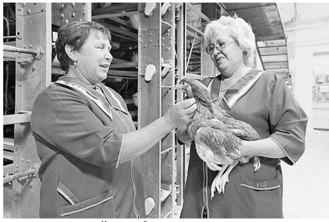
Качество яйца – результат правильного отношения к птице.

Добиться высочайшего качества продукции предприятию помогает эффективный организованный производственный процесс, контроль на всех этапах производства, работа с молодняком, который тщательно отобран на специализированных фабриках. Есть здесь своя лаборатория, которая отслеживает качество продукта. А оно, в свою очередь, во многом зависит от условий содержания птицы (чистый воздух и вода) и от её рациона. Куры яйцескород пород более чувствительны к внешней среде, а также деликатны в отношении питания. Поэтому высококачественные яйца – это всегда результат правильного отношения к птице. В компании всегда помнят