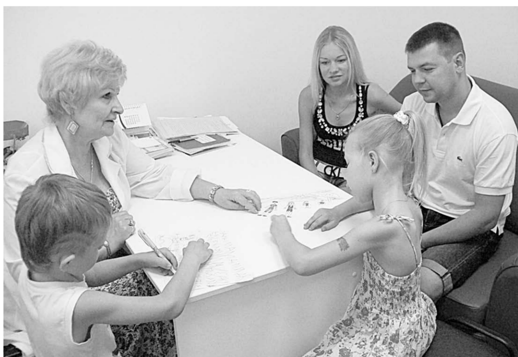
В Детском центре заботятся не только о физическом, но и о психическом здоровье пациентов. На приёме у психолога.

В результате лечебно-профилактической деятельности нам удалось оказаться на пути к снижению смертности населения и повышению рождаемости, увеличился показатель естественного прироста населения.