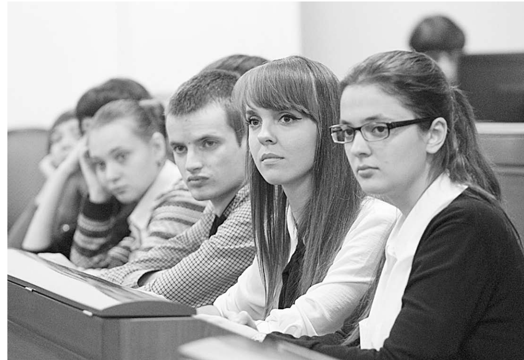
У студентов к обсуждаемой теме неподдельный интерес.

– Всплеск интереса к ОРФ в первые годы работы про-