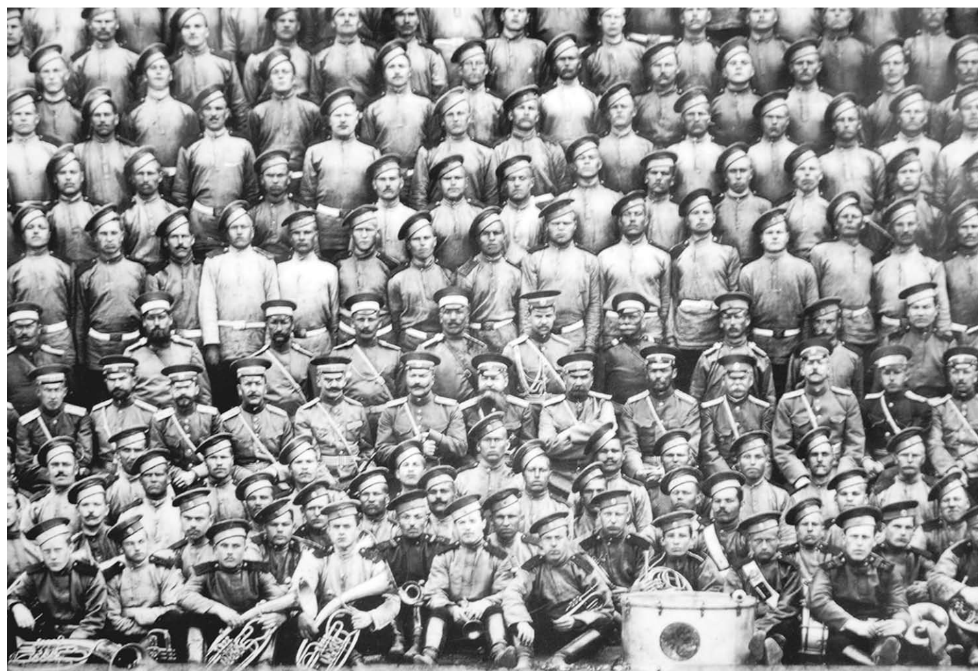
Эта фотография – только фрагмент большого снимка.