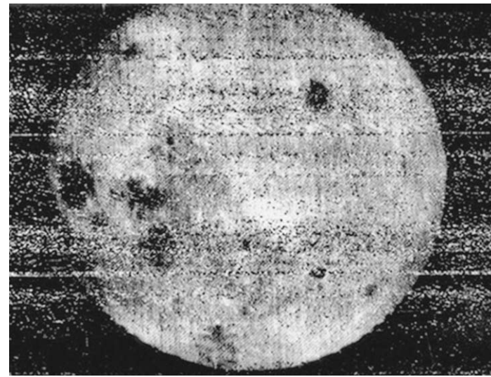
Тот самый снимок. И качество фотографии того времени.

В начале работы система ориентации прежде всего прекратила произвольное вращение АС вокруг её центра тяжести, возникшее в момент отделения от ракеты-носителя. После этого с помощью солнечных датчиков была осуществлена ориентация на Солнце таким образом, чтобы автоматическая станция была обращена к Солнцу своим днищем. При таком её положении оптические оси фотоаппаратов оказались направленными в сторону Луны. Затем соответствующее оптическое устройство, в поле зрения которого Земля и Солнце уже не могли появиться, отключило датчики ориентации на наше светило, направив фотоаппараты станции точно на Луну. Поступавший с оптического устройства