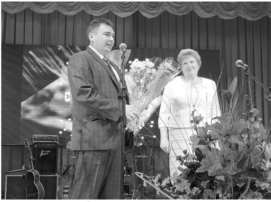
Виновникам торжества – цветы и поздравления.

За значительные успехи в совершенствовании учебного