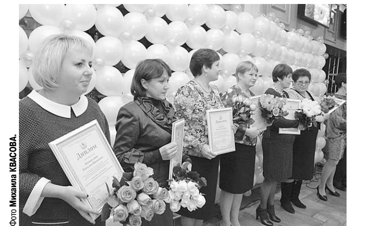
В центре внимания – лучшие учителя Воронежской области.

Уверена, что такие же слова можно адресовать всем победителям этого конкурса.