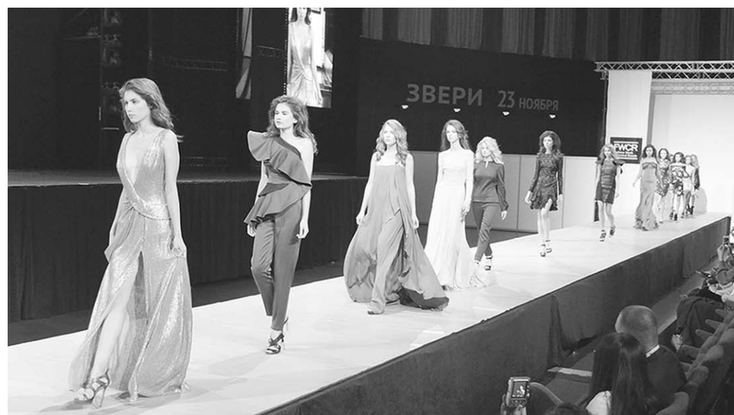
Дефиле на воронежской сцене.

Премия за достижения в сфере модной индустрии «Золотая Венера» была вручена Игорю Чапурину.