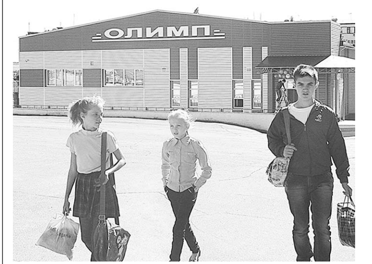
Спортивный комплекс «Олимп» в Лисках.