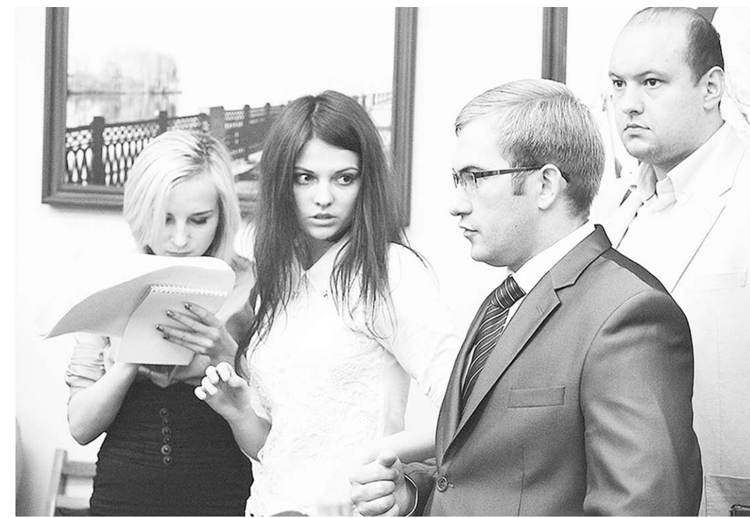
У активна воронежской молодёжи далеко идущие планы.

Наши активисты – признанные лидеры молодёжного движения в Центральном федеральном округе. Для нас, опытных политиков, крайне важно иметь прямую связь с молодёжью. Сегодня ни один нормативный акт, связанный с