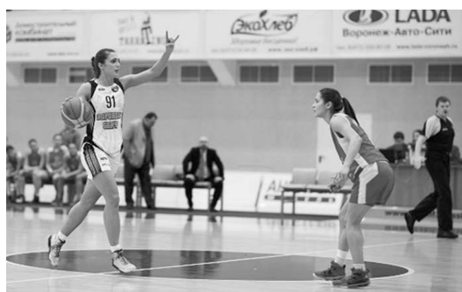
Воронежские баскетболистки продолжают борьбу за почётный трофей.