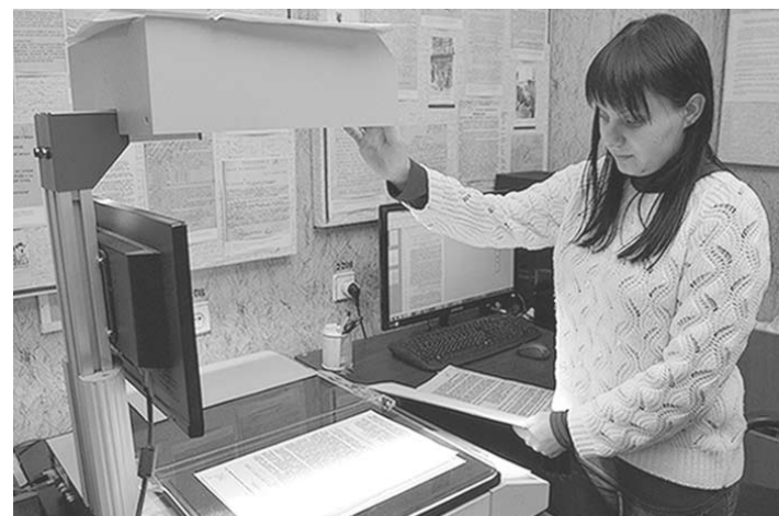
Ещё одно дело сегодня будет отсканировано.