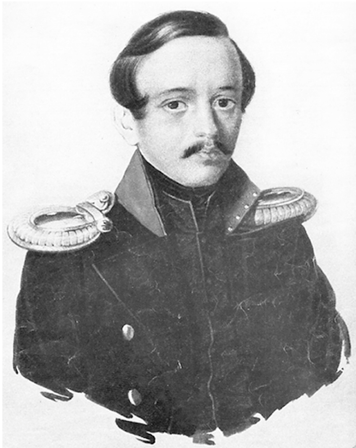
А.И.Кливер. Портрет М.Ю.Лермонтова в ордене лейб-гвардии гусарского полка.