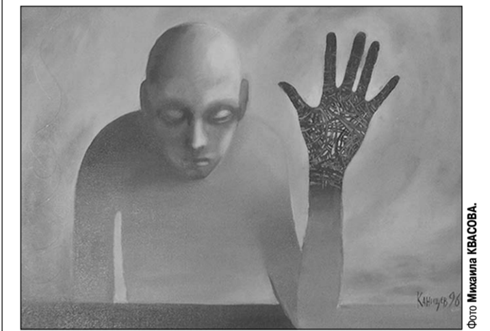
Одна из работ выставки.

Михаил Шемякин поделился ближайшими планами работы. Особо отметил, что будет много работы на пленэре. В ноябре вся его группа приедет к нему на занятия во Францию.