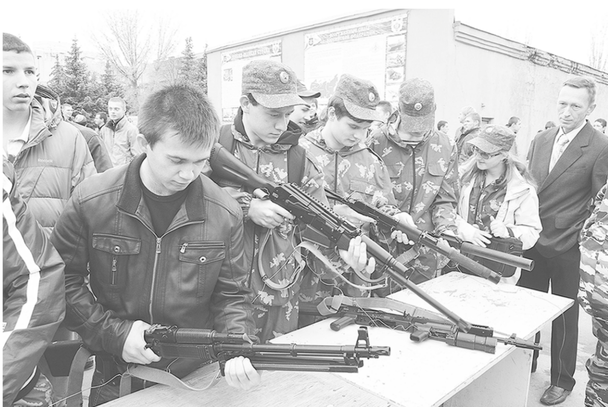
В День призывника многие воронежские новобранцы впервые взяли в руки оружие.

Но больше всего молодёжь собралось у другого ряда столов. На них омониторы выложили стрелко-