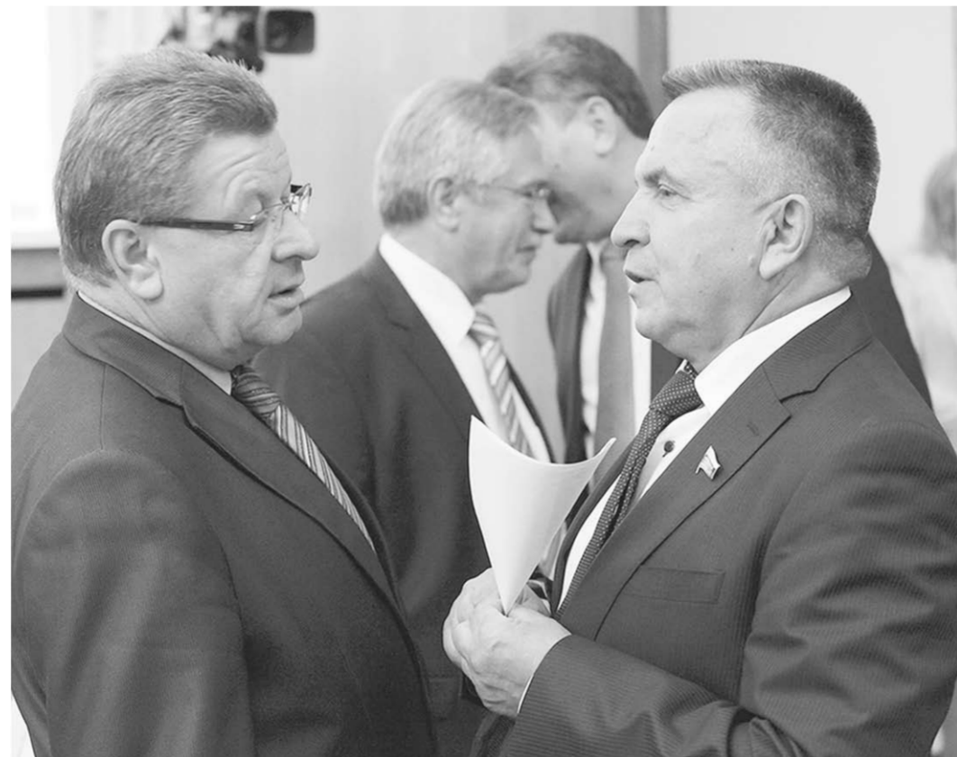
Обсуждение острых тем идёт и в кулуарах областной думы.

Заседание Воронежской областной думы, которое прошло в минувшую пятницу, получило продуктивным. Первым делом депутаты решили кадровые вопросы. Они согласовали кандидатуры трёх вице-губернаторов, которых представил глава региона Алексей Гордеев, а затем своим решением досрочно прекратили полномочия Оксаны Хоронжук в качестве депутата регионального законодательного органа власти. Она заменила в Государственной думе Галину Карелову, которая перешла на работу в верхнюю палату российского парламента. После этого был рассмотрен целый ряд законопроектов, внесенных изменения в нормативные правовые акты.