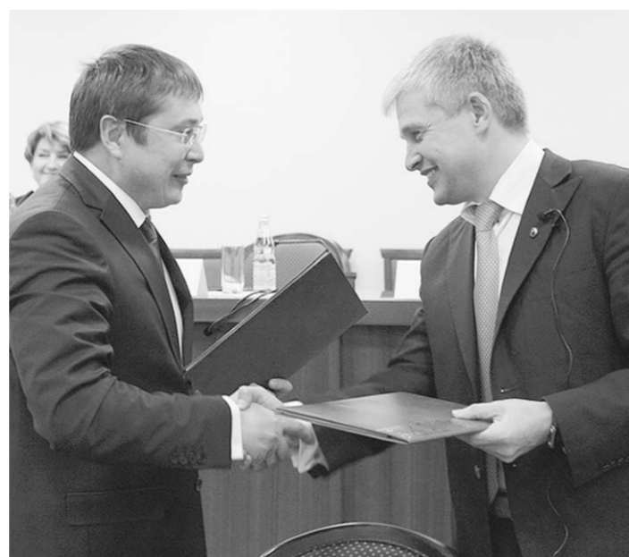
Соглашение о сотрудничестве подписано.

- Мы благодарны ВГУ за выпускников, которые работают у нас. В Сбербанке особое вни-