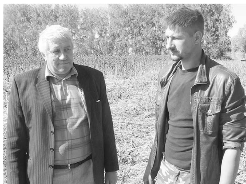
Династия Щепкиных из Краснореченки.

– В этом году мы собрали неплохой урожай и по озимым, и по техниче-