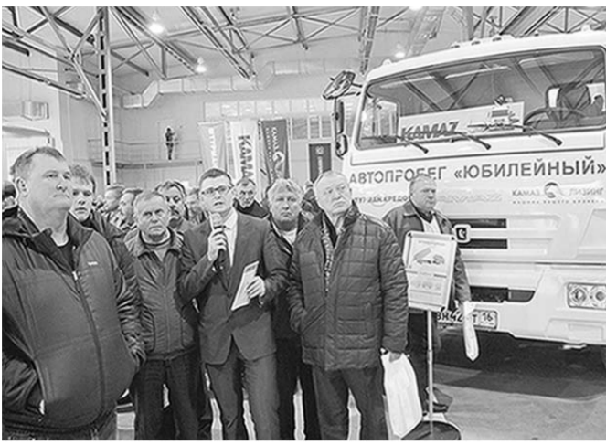
К технике КАМАЗ у воронежских аграриев – неподдельный интерес.