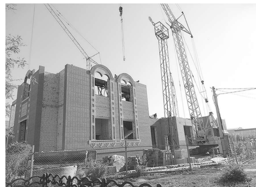
Растут этажи Детского центра.

– Правительством Воронежской области поставлена задача – в будущем году снять эту проблему полностью. Сейчас в Россошанском районе осталось сорок семей, нуждающихся в такой помощи. Мы активно занимаемся решением проблемы, и наеемся благополучно с ней разобраться. Тем более, в районе сейчас хорошими темпами идёт возведение жилья, которое ведут наши строительные компании, включая ЗАО «Коттедж-Индустрия» и «РМУ».