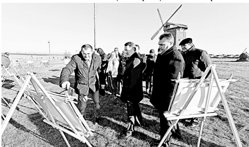
Ломовской парк получит дополнительные возможности для развития под «крылом» области.