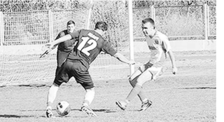
За секунду до гола.

Наращивают мастерство игроки футбольного клуба «Калач», которые участвуют в областном турнире на приз Героя Советского Союза Ивана Евгеньевича Просняного. Победив в своей группе, футболисты вышли в полуфинал.