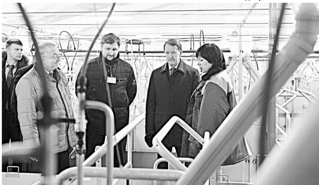
Благодаря таким комплексам, как в Верхней Тишанке, можно решить задачу импортозамещения мясной продукции.