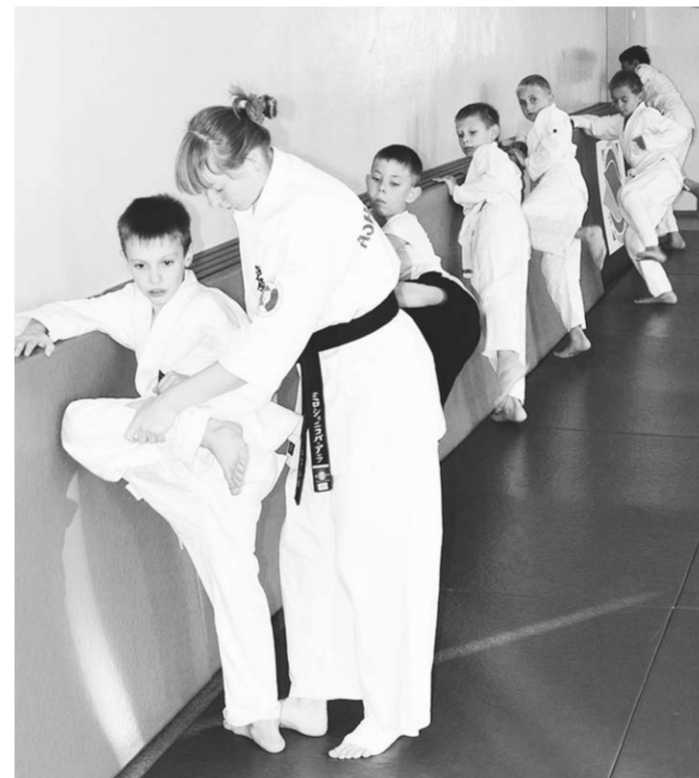
Секция Ашихара-каратэ: здесь воспитывают настоящих мужчин.

Благодаря руководству района и завода дети получили удобное время для тренировок. И самое главное – мощный заряд энергии, пробудивший интерес к хоккею. У мальчишек горят глаза, и они с удовольствием спешат на тренировки, где уже складывается настоящий спортивный коллектив – воспитывающий и закаляющий.