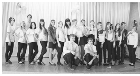
Команда - победительница олимпиады.

Областная олимпиада по избирательному законодательству среди старшеклассников проводится ежегодно, а ее инициатором выступает Избирательная комиссия региона при поддержке и участии департамента образования Воронежской области. В нынешнем учебном году в Калаче в школе №1 состоялась районная олимпиада учащихся старших классов.