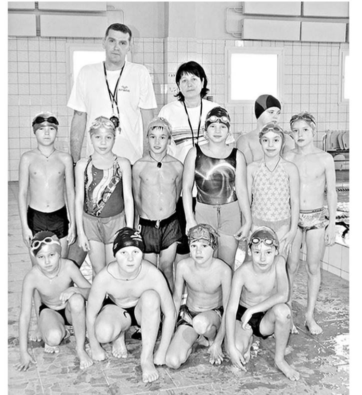
Юные пловцы СК «Химик» – лидеры районных и областных соревнований.

Благодаря руководству района и завода дети получили удобное время для тренировок. И самое главное – мощный заряд энергии, пробудивший интерес к хоккею. У мальчишек горят глаза, и они с удовольствием спешат на тренировки, где уже складывается настоящий спортивный коллектив – воспитывающий и закаляющий.