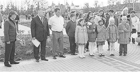
Торжественное открытие сквера.

Ко Дню поселка Пригородный администрация района подготовила для сельчан подарок – в кратчайшие сроки на пустыре был разбит прекрасный сквер. Он построен за счет средств областного и местного бюджетов недалеко от современного физкультурно-оздоровительного комплекса, открывшего свои двери в феврале нынешнего года.