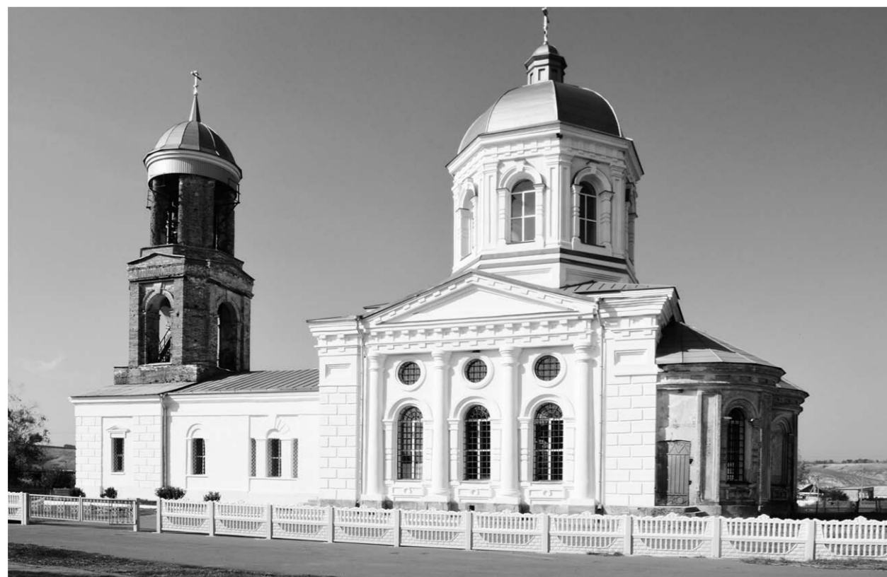
Духовное сердце – старинная церковь Благовещения, украшающая центр села Жилино.

В селе Жилино Россошанского района восьмой год продолжаются работы по восстановлению храма Благовещения Пресвятой Богородицы