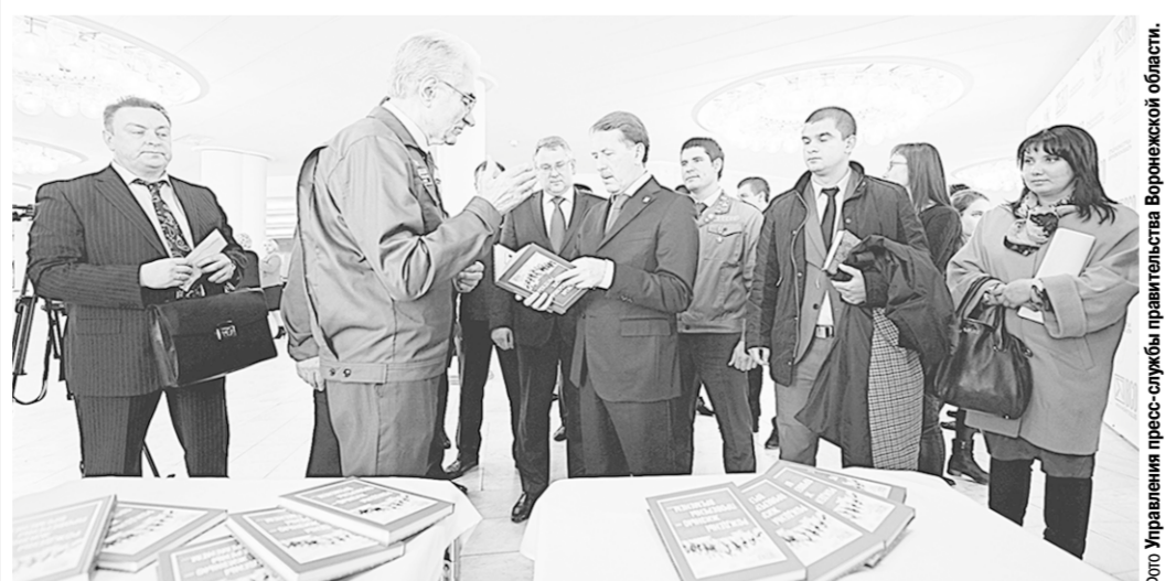
Губернатору Алексею Гордееву подарили книгу об истории студотрядовского движения Воронежской области.

Как отметил Алексей Гордеев, студотрядовское движение было и остаётся важной вехой в истории страны и региона. Сам губернатор несколько раз работал в стройотрядах. Самое же сильное впечатление, по его словам, осталось от строительства БАМа в 1975 году.