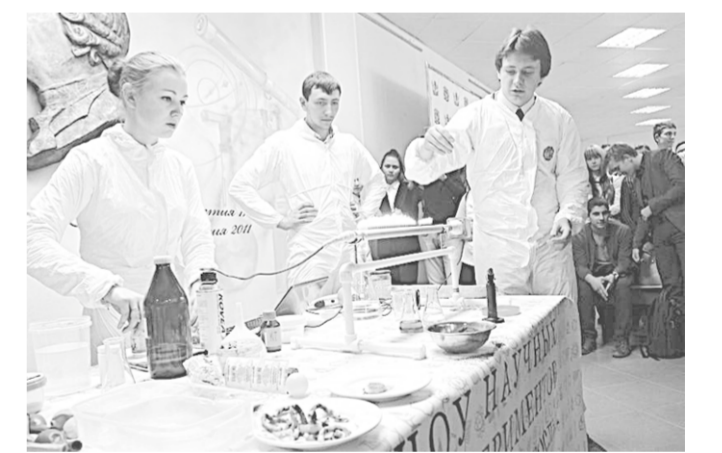
Опыт – хороший учитель.

В рамках Всероссийского фестиваля науки в актовом зале факультета журналистики ВГУ прошёл финал фестиваля науки Воронежской области.