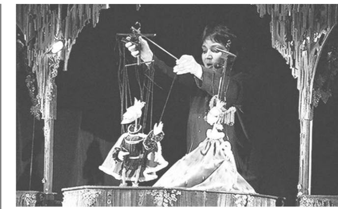
Сцена из спектакля.

– У нас так не делается, – приветливо сказала ей дама в белом халате, – если вы, женщина, плохо себя чувствуете,