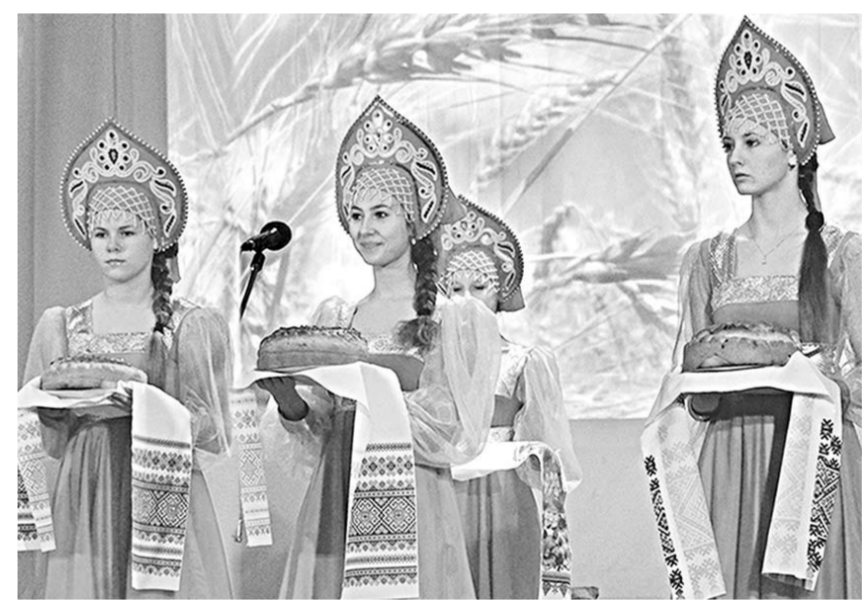
Караван урожая-2014 - почётным гостям.