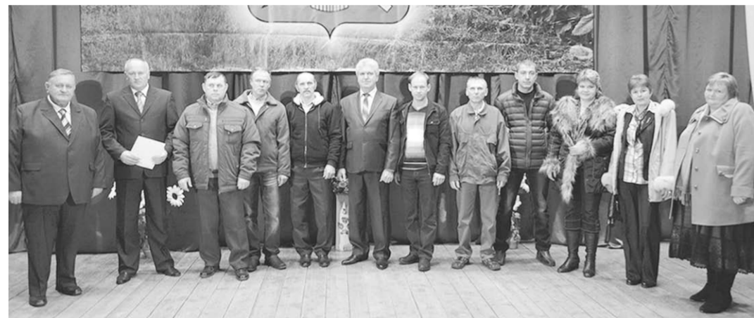
Группа передовиков сельского хозяйства.

На том и стоят испокон века земледельцы: трудом праведным добывают хлеб наш насущный. А песня им – в награду.