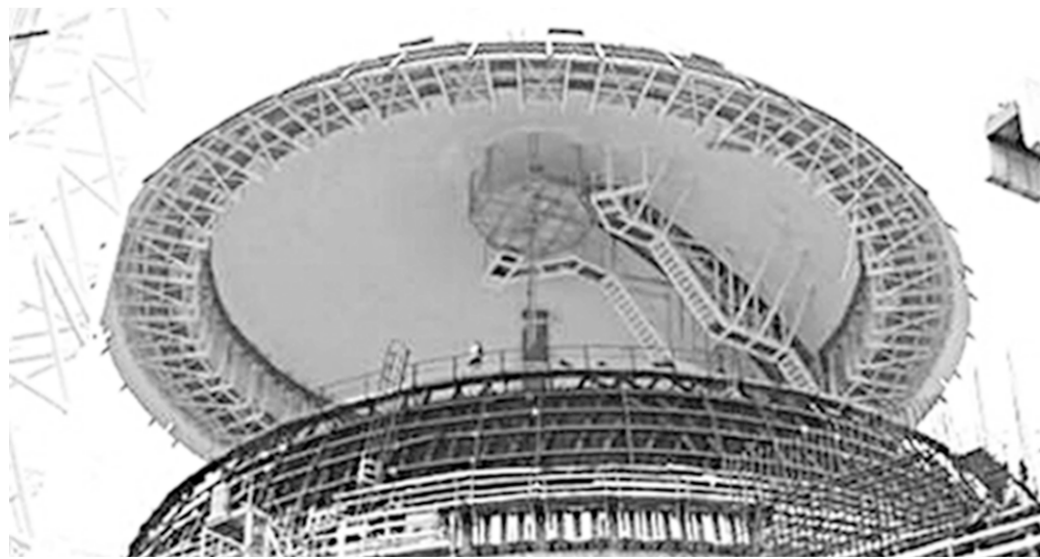
Идёт монтаж купола энергоблока №2.