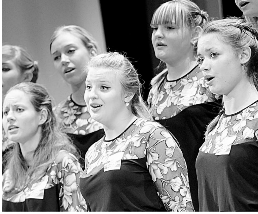
Поёт хор Воронежского музколледжа им. Ростроповичей.