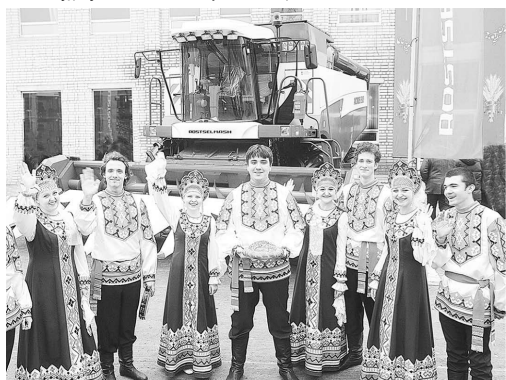
У комбайнов Ростсельмаш – и песня звонче!

Последние две недели в Воронежской области – пора подведения основных итогов завершающегося сельскохозяйственного года. Собрано четыре с половиной миллиона тонн хлеба, более миллиона тонн маслосемян. Несмотря на крайне засушливые лето и осень, выращен неплохой урожай сахарной свёклы, с хорошим «плюсом» идут животноводы. Но не в традициях наших аграриев довольствоваться достигнутым. Вот и на 19-й специализированной выставке «ВоронежАгро-2014», с успехом прошедшей в Экспоцентре Воронежского государственного аграрного университета имени императора Петра I, речь шла не столько о достигнутых результатах, сколько о том, как закрепить их в будущем. Эта тема в диалогах слышна звучит всё острее. Потому как погода ставит под сомнение судьбу сотен тысяч гектаров озимых, посеянных в области.