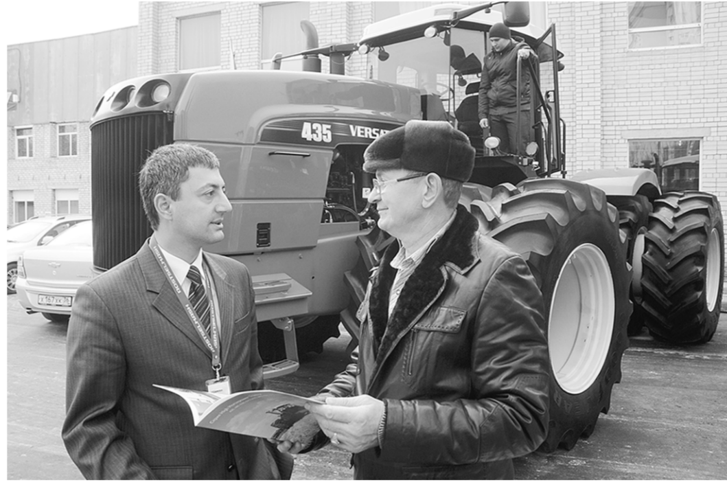
Тракторы VERSATILE вызывают у воронежских аграриев всё больший интерес.

- Отличная машина, на наших полях зарекомендовала