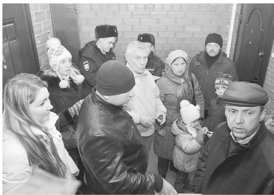
Возмущенные жильцы дома №24 во время активных «боевых» действий с «бойцами» ЧОПа.

Всё происходящее военный пенсионер называет беспределом, имеющим признаки экстремизма. Он убеждён, что нужно принудить руководство ЧОПа прекратить действия по договору с гражданином Б. по охране газовой котельной в доме №24. И вообще