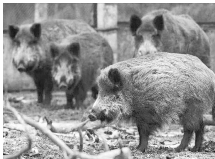
Дикие кабаны могут стать потенциальными разносчиками АЧС.

Напомним, что на территории Воронежской области вспышки АЧС были зарегистрированы в 2011-м и 2013 годах, и уже тогда были приняты необходимые меры, направленные на борьбу с распространением вируса среди диких кабанов, как одного из вероятных его разносчиков – увеличены нормы отстрела, ужесточены требования к способам охоты, усилен контроль за организацией охот. Благодаря слаженным действиям инспекторов отдела госохотнадзора и охотоведов казенного учреждения «Охрана животного мира», это привело