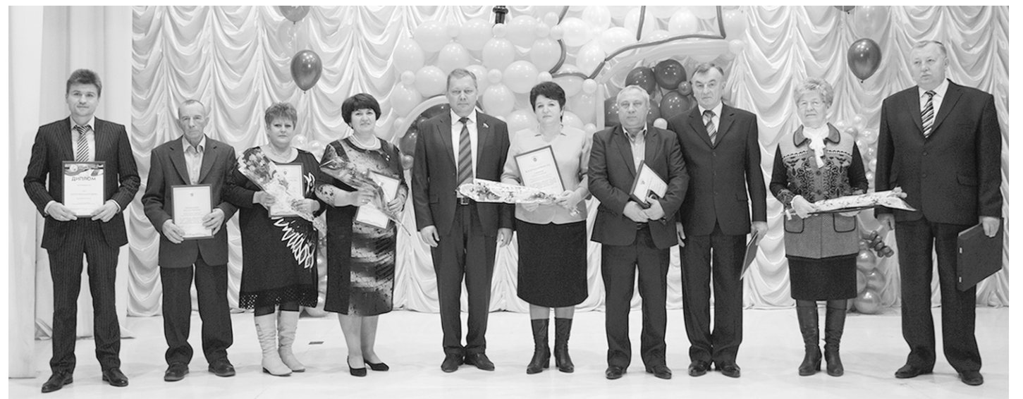
Главные герои праздника – кормилицы России.

ложенный недалеко от села Нижний Ольшан. В настоящее время запущен один комплекс, общее количество свиней составляет 12 000 голов, из них 2500 – маточное поголовье. В следующем году планируется строительство ещё двух площадок. Реализация проекта предусматривает строительство 10 комплексов по выращиванию свиней. Буквально на днях получена информация о том, что Министерство сельского хозяйства РФ приняло по-