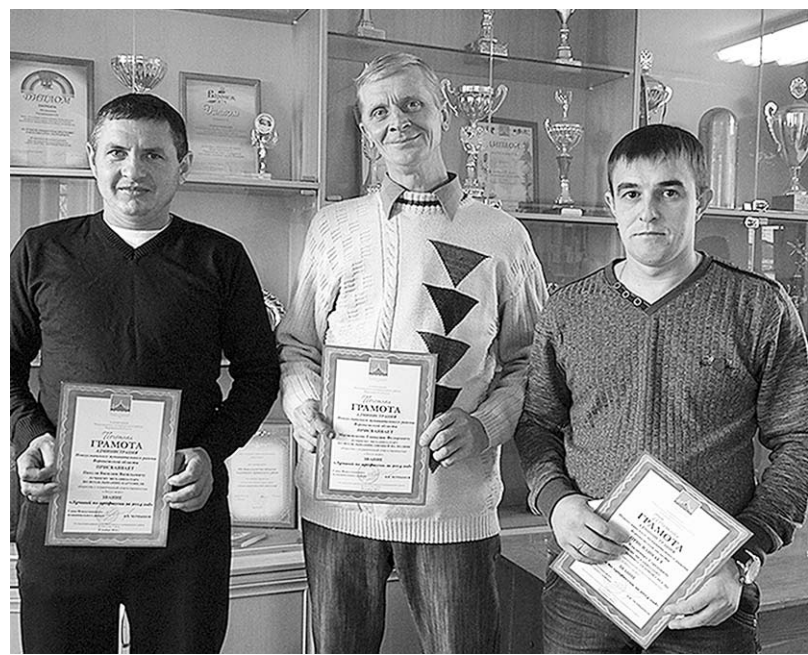
Механизаторы ООО «Логус-Агро» – победители в номинации «Лучший по профессии».