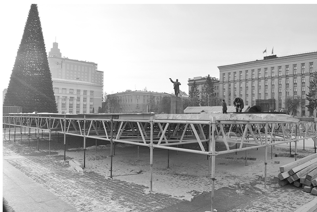
На главной площади Воронежа завершается монтаж ёлки и катка.