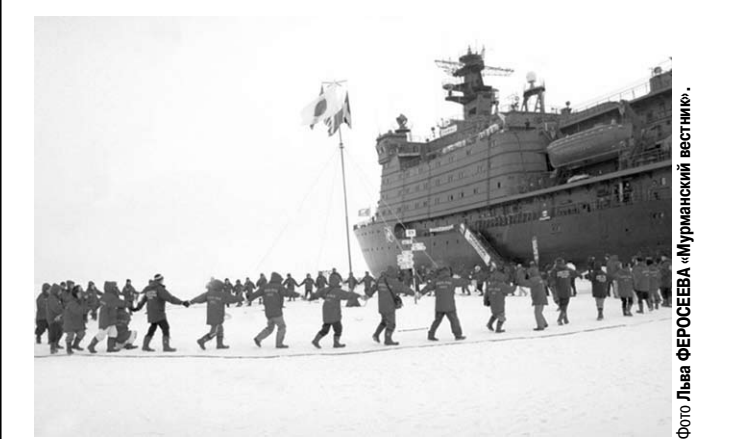
Традиционный хоровод вокруг «земной оси».