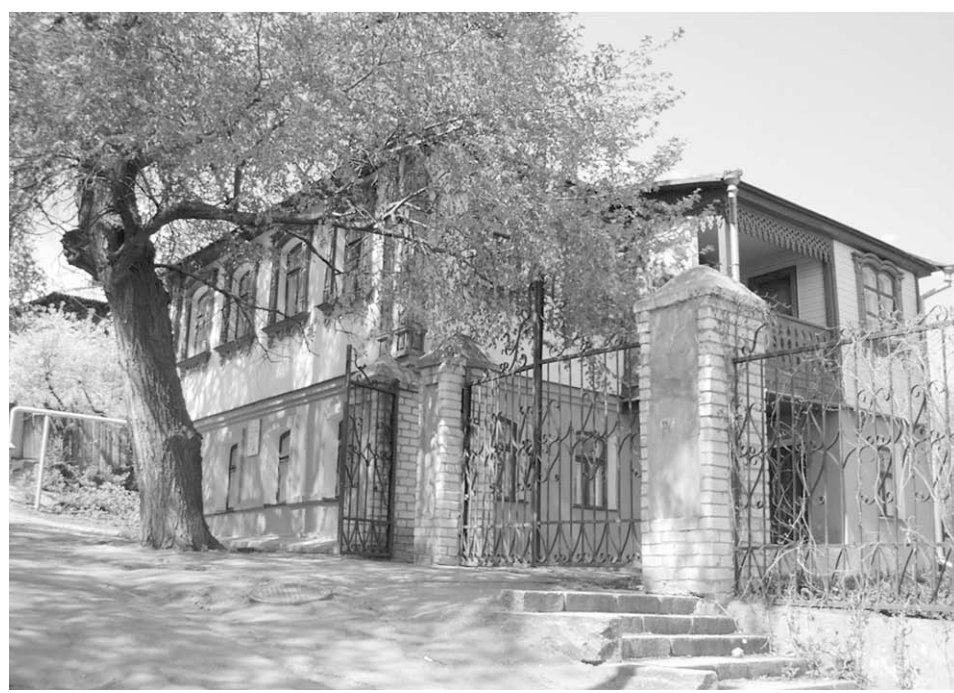
Дом-музей А.Л.Дурова в Воронеже.