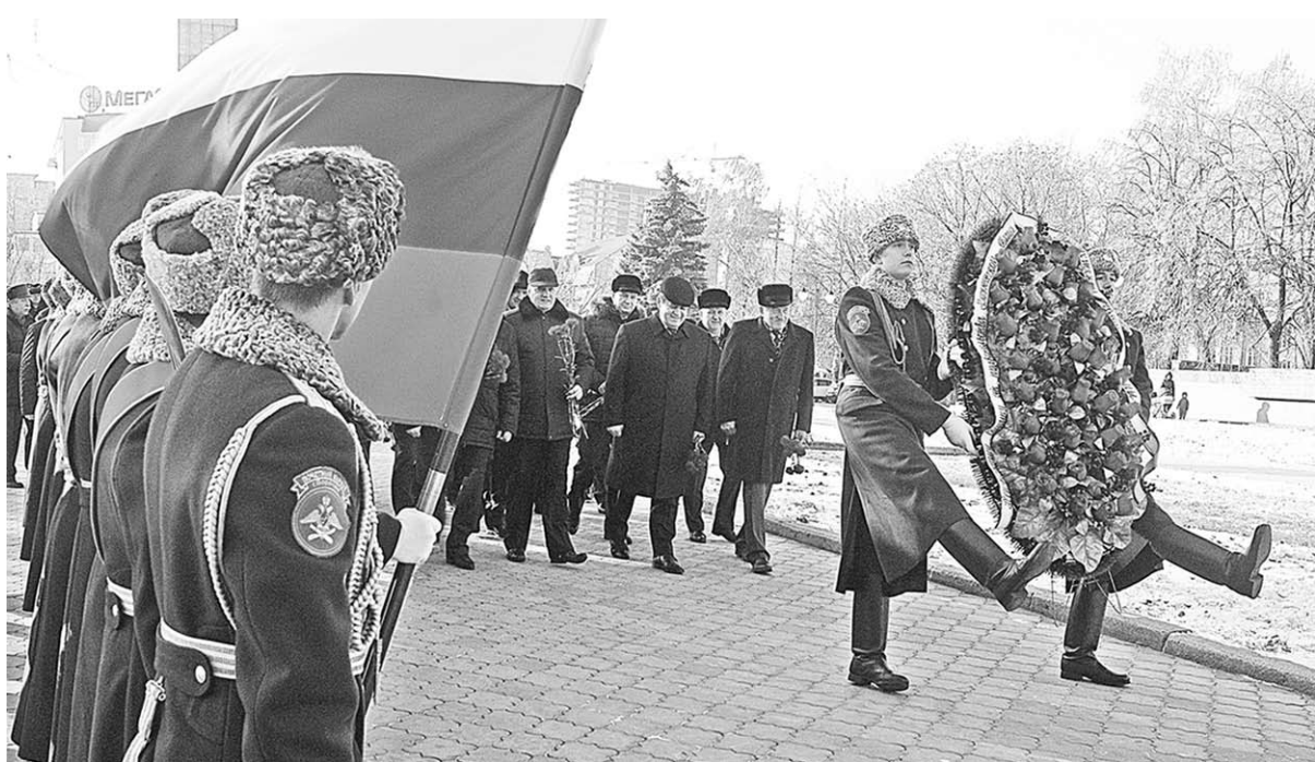
Возложение венков на площади Победы.