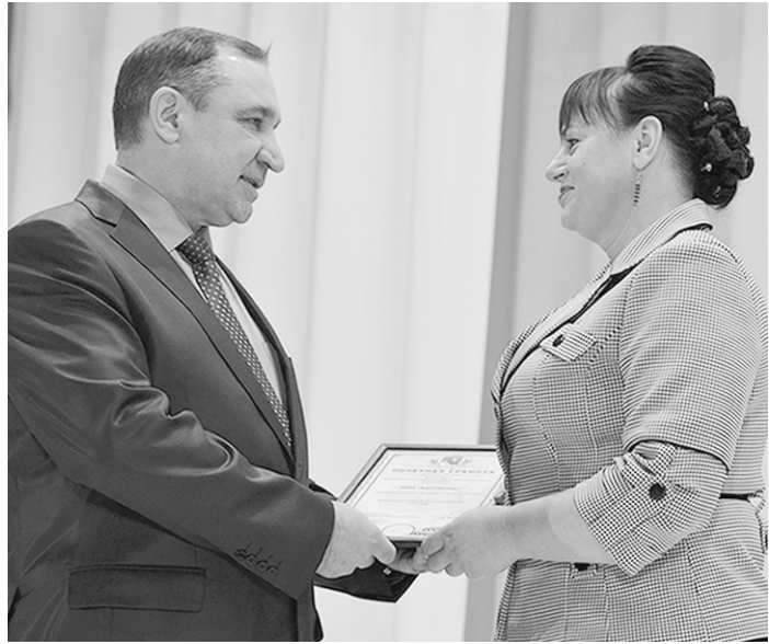
Вклад в экономику района оценили по достоинству.

«В нелёгких экономических условиях сельским труженикам района удалось вырастить хороший урожай. На ноябрь 2014 года валовой продукт составил 3,8 миллиарда рублей (в 2013 году он был – 3,2 миллиар-