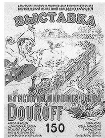
Афиша выставки, приуроченной к 150-летию великого артиста.