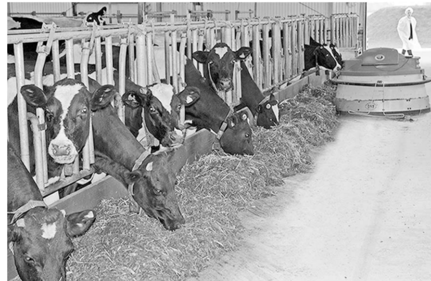
Робот начал движение — и коровы потянулись к кормушкам.

предприятии «Мазоловогаз» ежегодно получают от коровы по восемь и более тысяч литров молока, но доярки здесь не награждают и не чувствуют. Их здесь просто-напросто нет. Всё поголовно — а оно здесь немалое — доят... роботы.