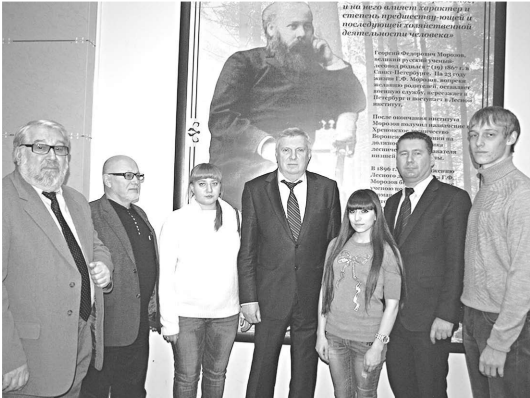
Руководство и студенты академии у стендов, посвящённых Георгию Фёдоровичу Морозову.