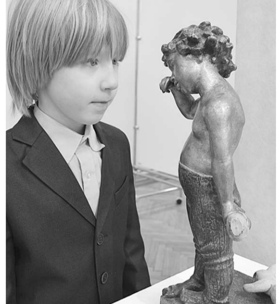
На открытии выставки.

На втором этаже выставочного зала были собраны, насколько я понял, преимущественно работы выпускников недавнего времени. И тематические, и жанровые рамки стали ощутимо шире. Много проектов, направленных на украшение облика Воронежа и