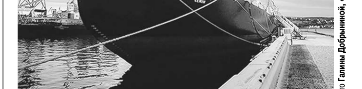
Ледокол «Ленин» - первый в мире надводный корабль с ядерной энергетической установкой.