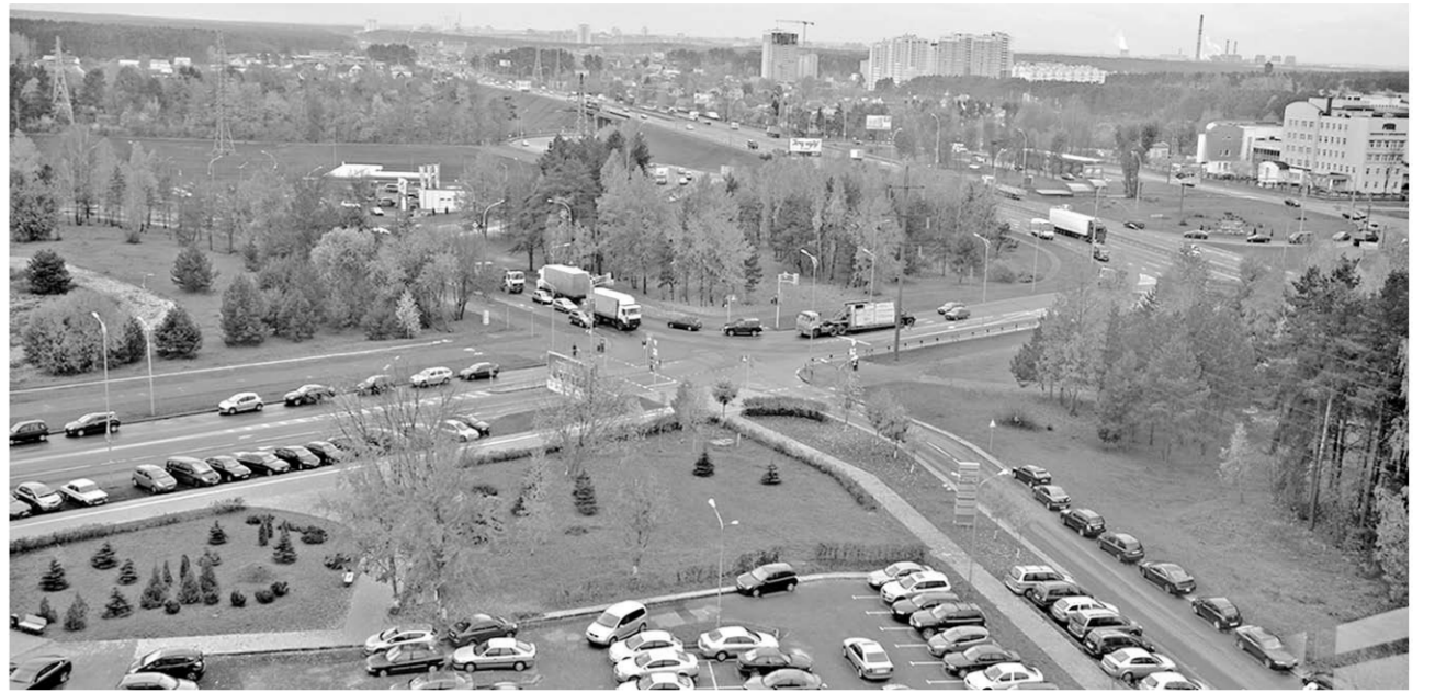
Столица Беларуси Минск. Город зелени и неповторимых просторов.

щиеся вдоль автомобиль и автобусы невольно сбавляют свою скорость. Многие останавливаются, люди выходят, идут по деревне.