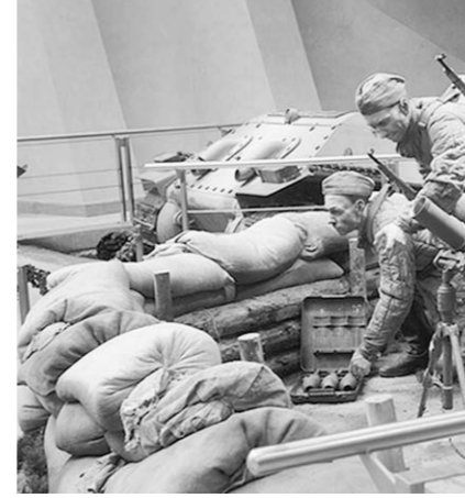
Одна из экспозиций музея истории Великой Отечественной войны.

У этого места нет знаков ни на белом, ни на синем фоне, тем не менее все мча-