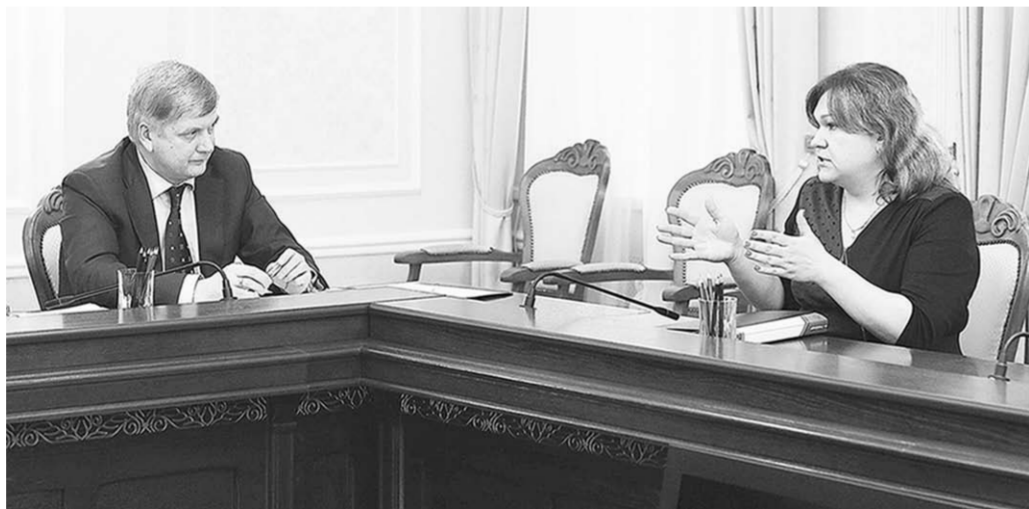
Выслушать и помочь – главное в работе главы города.