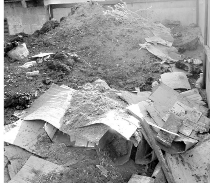
Биоотходы могут стать источником распространения инфекции.

В связи с опасностью АЧС увеличились штрафы и за