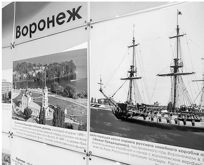
У Воронежа богатое культурное наследие.