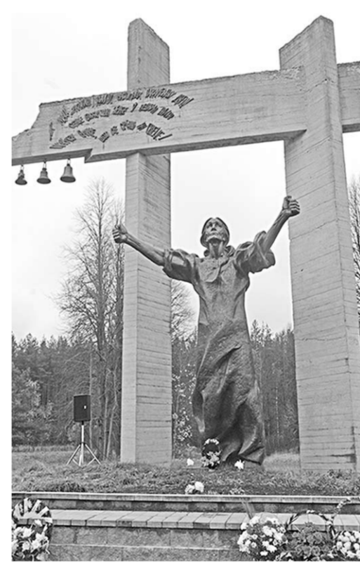
Мемориал в Шуневке.

Лишь иногда гнетущую тишину нарушают скорбные удары двух колоколов. Колоколов на скорбных воротах три, но один из них расколот и никогда не звонит. Его стль же скорбное молчание означают, что в годы Великой Отечественной войны в Докшицком районе Витебской области погиб каждый третий его житель.