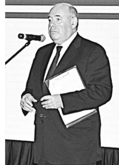
Михаил Швыдкой уверен, что Воронеж – город настоящей культуры.

После пленарного заседания форума и обсуждения вопросов