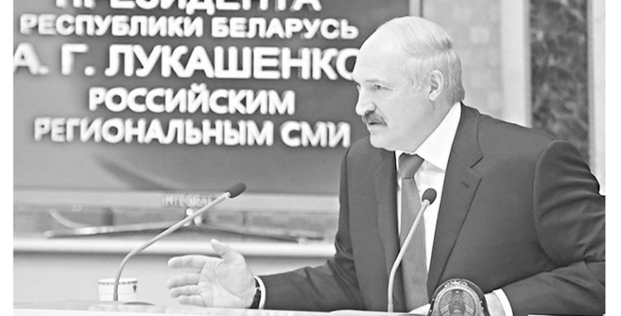
Президент Республики Беларусь Александр Лукашенко.

пресс-конференция президента Республики Беларусь А. Г. Лукашенко с российским региональным СМИ.