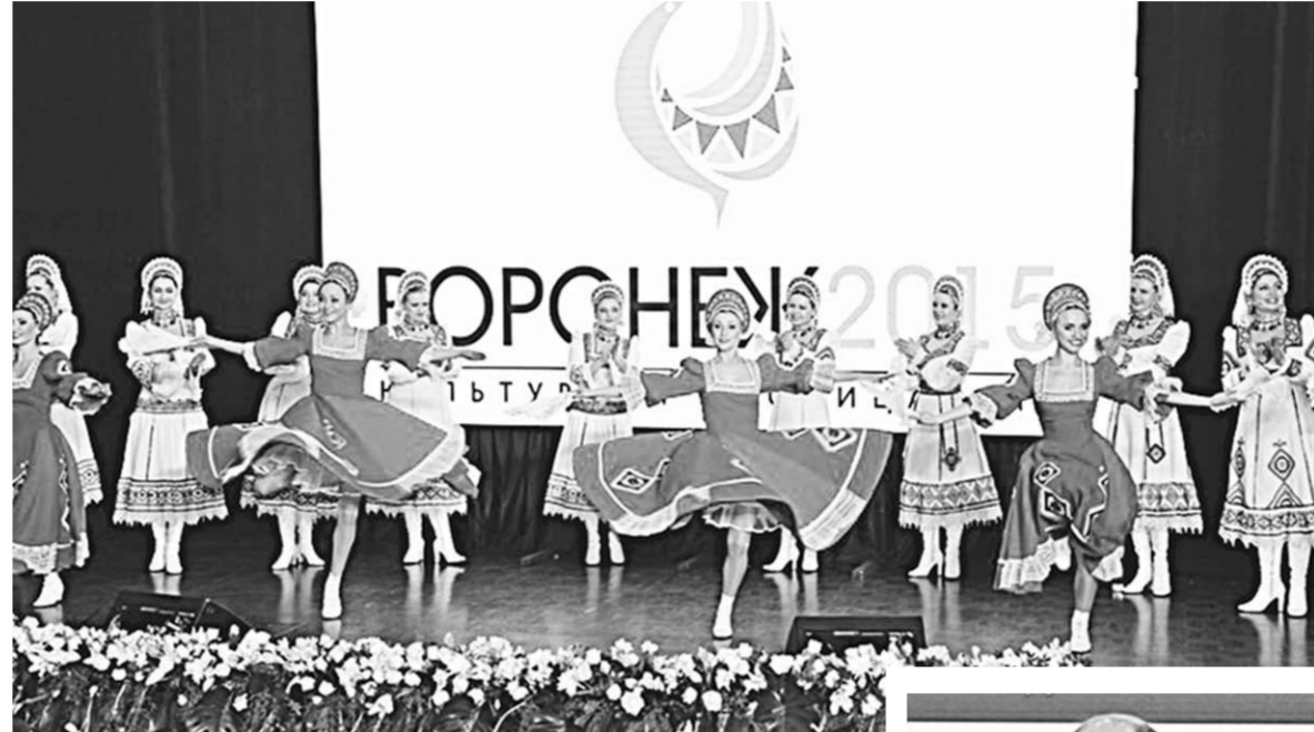
Наших воронежских девчат не раз вызывали на бис.