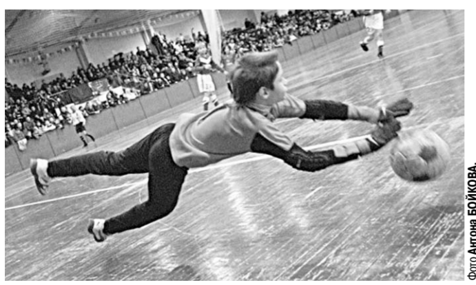
На трибуне снова нет свободных мест.