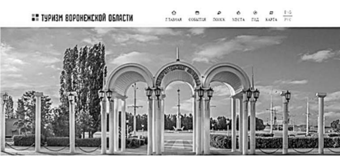
ТУРИСТСКИЙ ИНФОРМАЦИОННЫЙ ПОРТАЛ ВОРОНЕЖСКОЙ ОБЛАСТИ VISIT VORONEZH

С 20 января он начнёт работать в Интернете в тестовом режиме. Его адрес - visitvorn.ru. Портал VisitVoronezh аккумулирует в себе всю информацию о туристском потенциале нашего региона – будут здесь, помимо прочего, и новости, и маршруты, и фотографии, и советы, и конкурсы. Сайт, разработанный для продвижения туристского потенциала области на внутреннем межрегиональном и международном рынках, содержит ряд популярных туристских маршрутов, а также актуализированную информацию