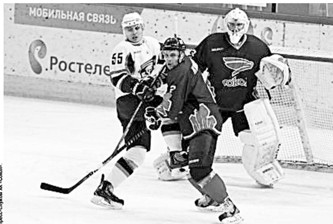
В Красноярске воронежцы уступили с минимальным счётом.

Нужно отметить, что регулярный чемпионат ВХЛ близится к завершению, и «Бурану» необходимо занять место не ниже восьмого, чтобы иметь преимущество своей площадки над соперниками в стадии плей-офф.