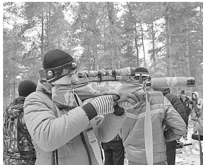
Новая игра собрала полторы сотни подростков.

В минувшую субботу в Россоши впервые прошли соревнования по лазертагу на кубок главы городской администрации, посвященные 72-й годовщине освобождения города от немецко-фашистских захватчиков