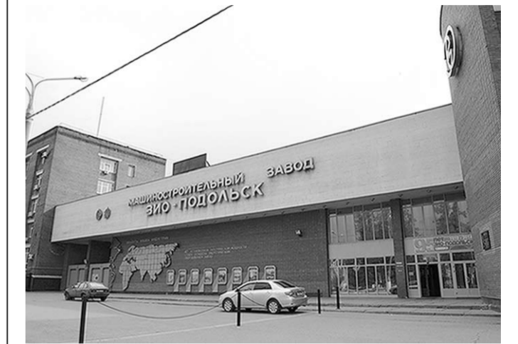
История завода, которому в прошлом году исполнилось 95 лет, продолжается.

В Подольске изготовят корпус атомного реактора для ледокола нового поколения. Он станет самым большим и мощным в мире