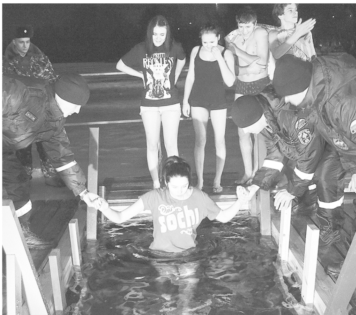
Спасатели помогли всем желающим окунуться в крещенскую купель.

Места массового омовения были оборудованы по всем стандартам: установлены палатки для обогрева, развёрнута торговля чаем и продуктами питания, проведено