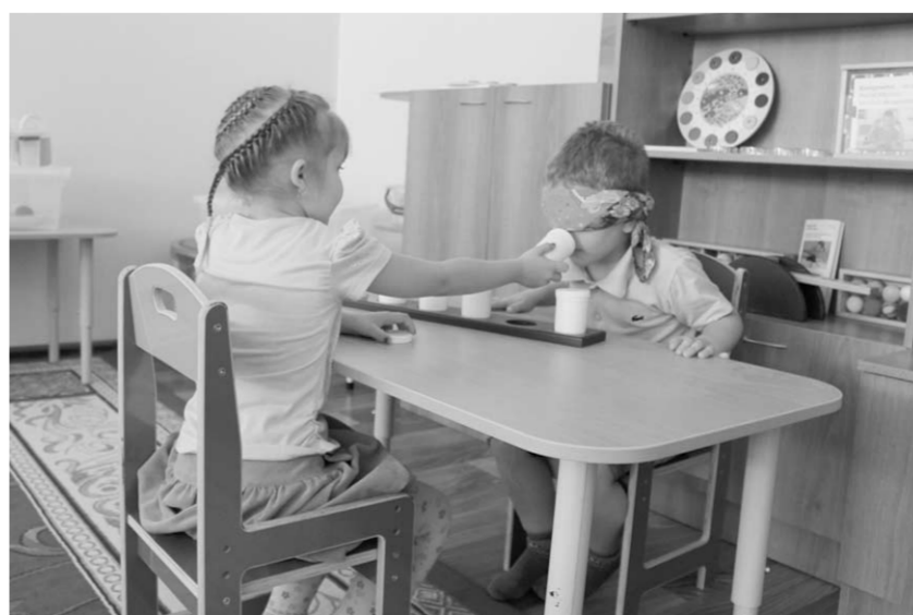
Познавать мир легче всего в игре.

С начала этого года детскому саду присвоен статус региональной инновационной площадки по направлению «Разработка моделей развивающей предметно-пространственной среды в соответствии с требованиями федерального государственного образовательного стандарта дошкольного образования». В рамках поддержки инновационного проекта департаментом образования Воронежской области было приобретено специальное оборудование DUSIMA германского производства на сумму более одного миллиона рублей. Оно незаменимо для развития тактильно-двигательного восприятия, мелкой