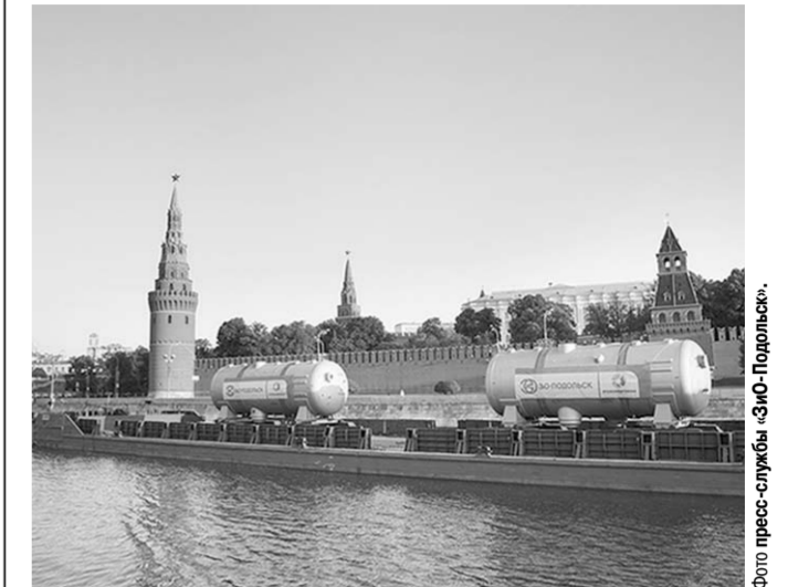
В 2014 году подольские машиностроители впервые произвели транспортировку парогенераторов по Москве-реке.