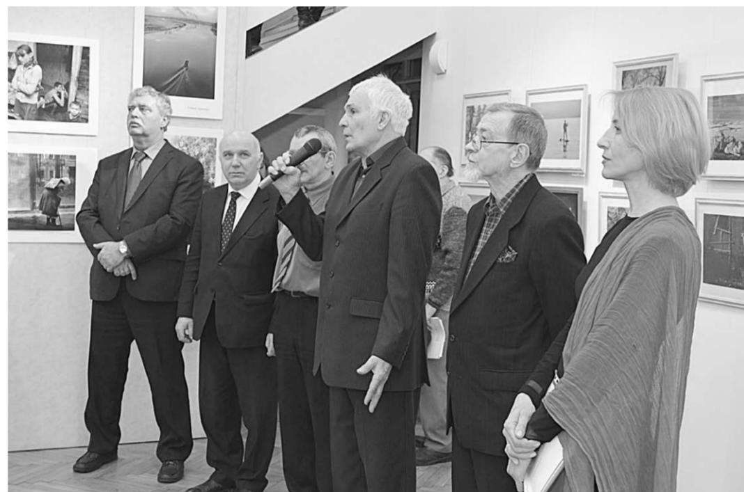
Церемония открытия фотовернисажа.

Приходите на выставку. Фотографировать лучше один раз увидеть, чем много раз услышать о них чужое мнение. Департамент культуры Воронежской области сообщает, что фотовыставка продлится до 22 февраля.