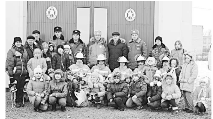
Ещё одной добровольной пожарной командой в Воронежской области стало больше.

Новая добровольная пожарная команда (ДПК) появилась в Комсомольском сельском поселении Рамонского района, сообщило ГУ МЧС России по Воронежской области 23 января. Добровольцы будут помогать тушить пожары в трёх населённых пунктах и в случае необходимости выезжать на ДТП на близлежащем участке федеральной трассы М-4 «Дон».