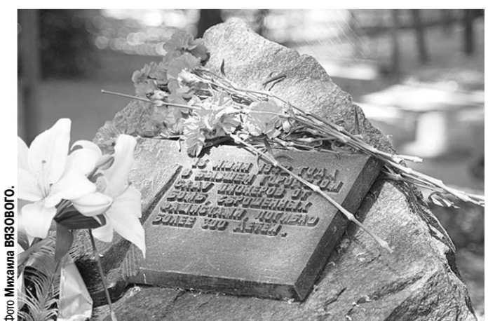
Памятник жертвам трагедии в «Саду пионеров».

Каждый город имеет свою историю, за каждым стоит судьбы живых людей. Много есть не преданных земле защитников Родины. Достаточно выбраться в покорённый войной природный Долгий лес, чтобы через пару сотен метров наткнуться на кости. Много ещё работы у тех, кто мечтает об окончании войны, много возможностей у тех, кто интересуется военным прошлым нашего города, взглянуть на него пристальней, понять, почувствовать «военное эхо».