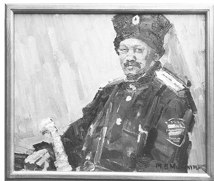
Картины с выставки продемонстрировали всю широту возможностей участников пленэра.