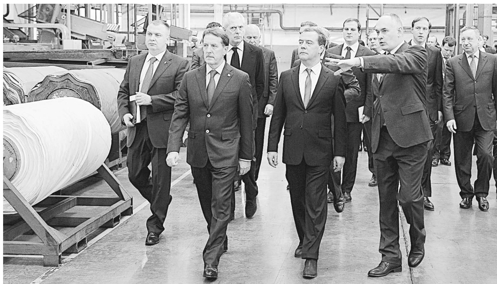
Премьер-министр Дмитрий Медведев, губернатор Алексей Гордеев на Воронежском шинном заводе.

Власть | Побывавший вчера в Воронеже премьер-министр России Дмитрий Медведев провёл совещание на площадке шинного завода о стабильном функционировании отраслей промышленности в части развития химического и нефтехимического комплекса