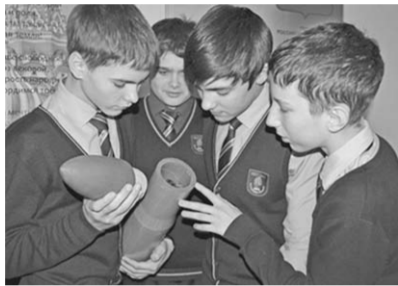
С символом «Третьего поля России».

Учащиеся Бутурлиновской средней школы получили от ветеранов Великой Отечественной войны района капсулу с землей с Прохоровского поля, ситникогосея Третьим ратным полем России. Привезли капсулу в прошлом году на майские праздники из Белгородской области. Теперь с её «участием» положено начать эстафету «Величие подвига народа. Земля с Третьего ратного поля». Акция проводится в рамках месячника патриотического воспитания. До Дня Победы капсула, как «живая память», побывает в каждой базовой школе района.