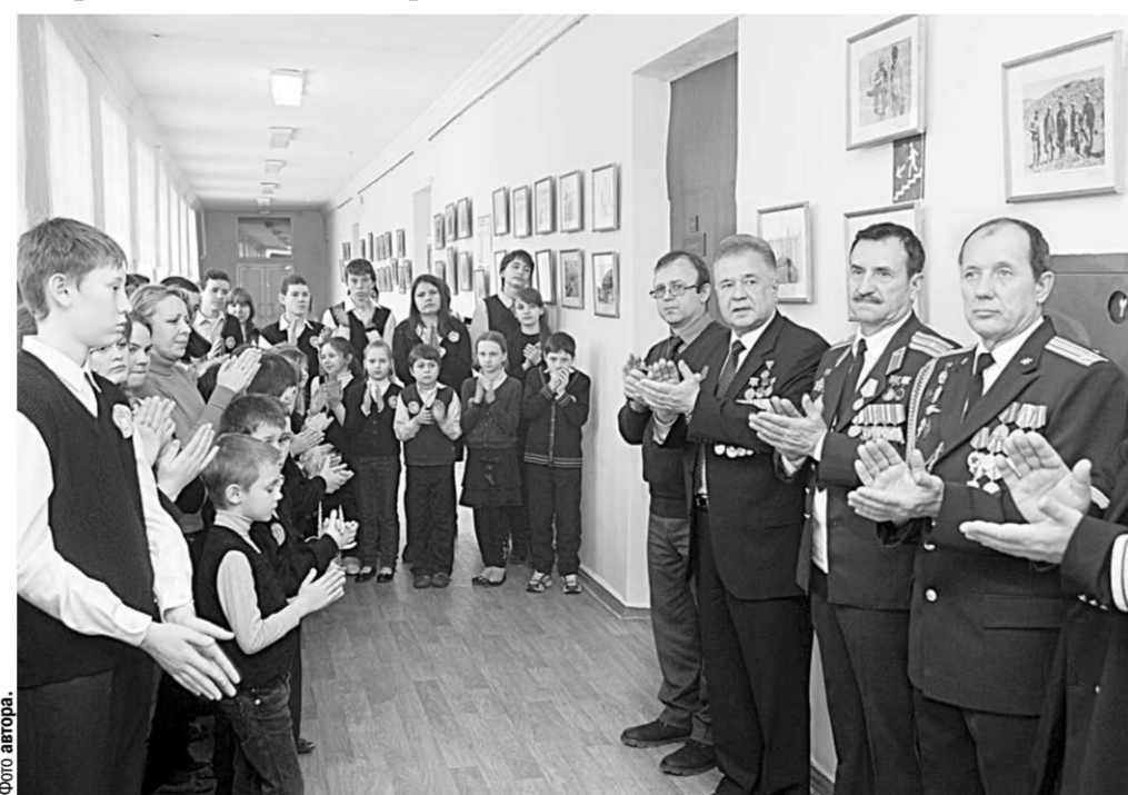
Для нынешних мальчишек и девчонок война в Афганистане – событие совсем далёкого прошлого.

Встречи | Накануне 26-й годовщины со дня окончания советскими войсками боевых действий в Афганистане в Воронежском музыкально-педагогическом колледже прошла встреча с воинами-«афганцами»