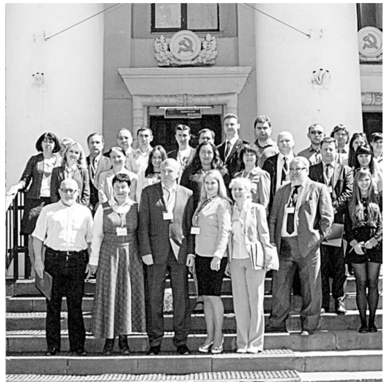
Участники I европейского лесопромышленного форума молодёжи.