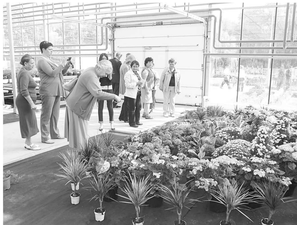
В питомническом комплексе.