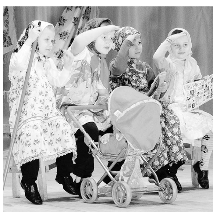
На сцене – юные артисты.

Наш детский фольклорный ансамбль «Кукушечка» участвовал в областном фестивале-конкурсе народного творчества «Адрес детства – Воронежский край», затем – в московском фестивале «Созвучие сердец» (он был приурочен к проведению Года культуры в Российской Федерации и организован Международной Академией Развития Образования). Ансамбль народной песни «Донские родники» украсил своей