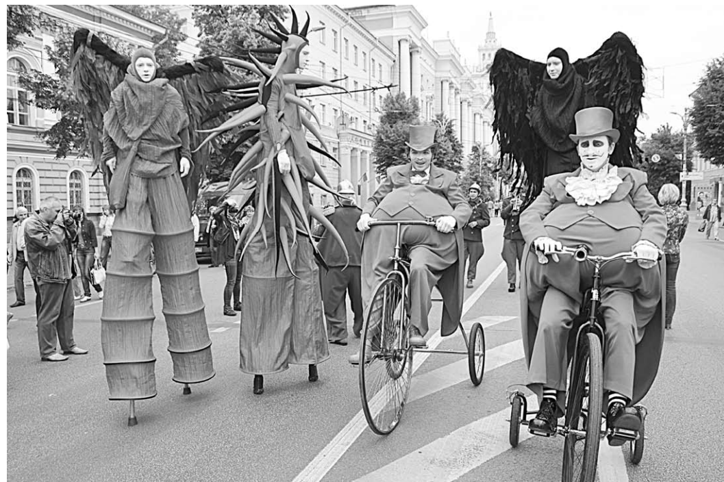
Организаторы надеются, что парад уличных театров пройдет в Воронеже снова.

На российской сцене «Рис» будет впервые исполнен имен-