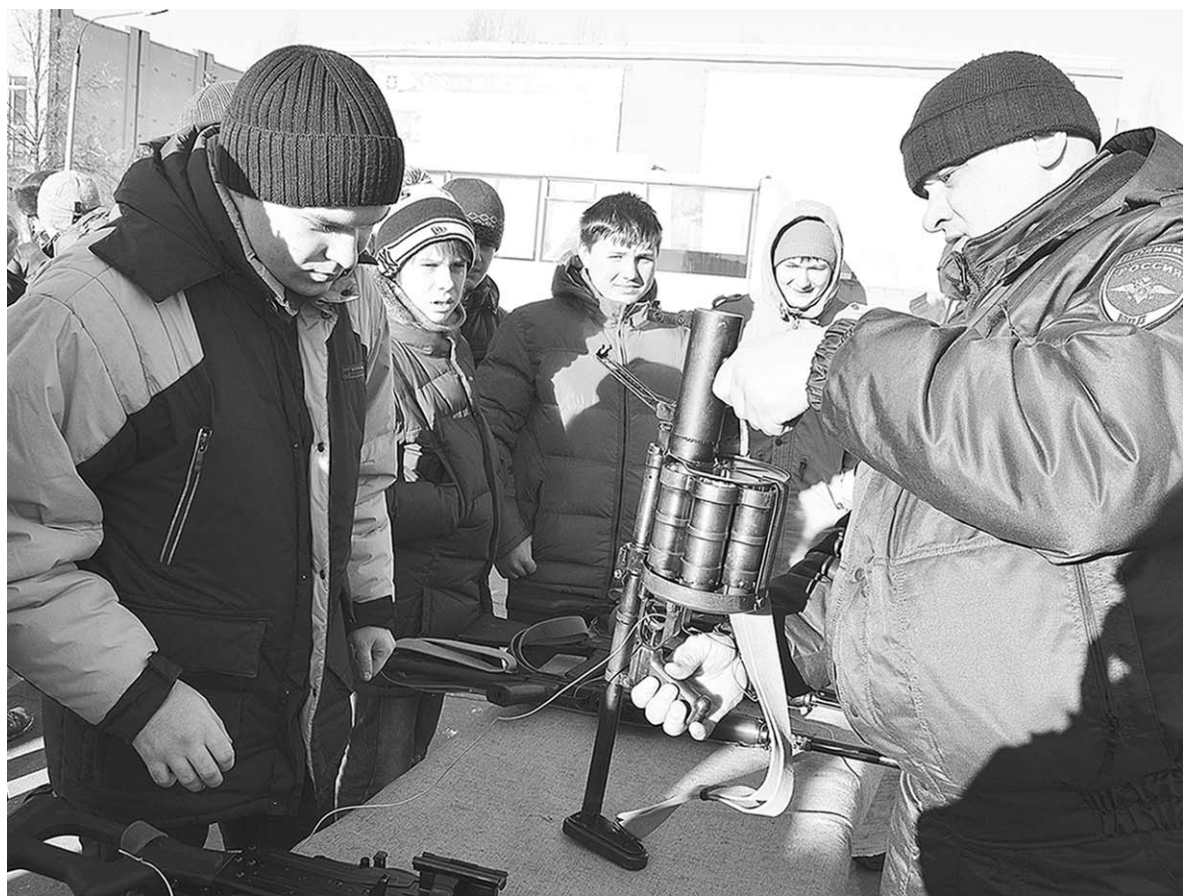
Огромный интерес у призывников вызвала выставка оружия.

Затем в холле возле актового зала будущим защитникам Родины показали обмундирование российского солдата и его сухой паёк. А ещё им разрешили пострелять из оружия. В миг обра-