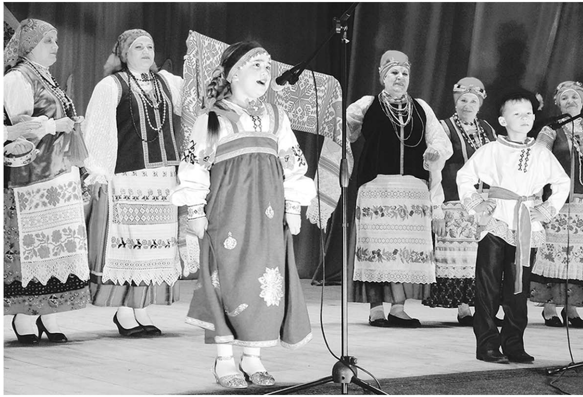
«Кукушата» – смена именитых «Донских родников».