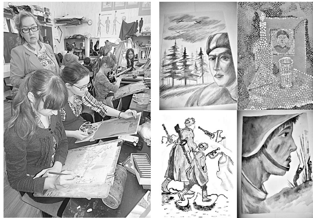
Юные художники Воронежской области и их рисунки.

Подведены итоги регионального этапа Всероссийского конкурса детского рисунка для выпуска маркированной продукции, посвященной 70-летию Победы в Великой Отечественной войне. На творческое состязание жители Воронежа и Воронежской области прислали 75 рисунков.