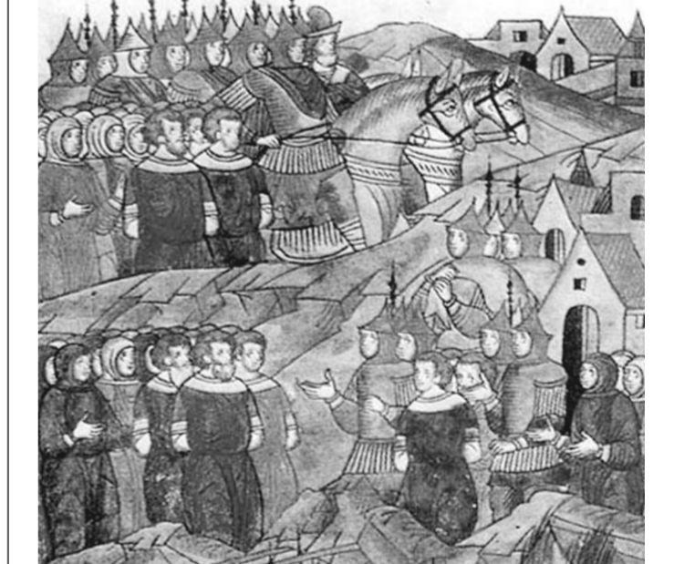
Нашествие Батыя на Рязанскую землю. Миниатюра XVI века.

Нет сомнений, что левобережные дубравы претерпели огромные утраты еще в Петровское время. Например, в 1700 году стольник Афанасий Захаров выяснил: в районе впадения в реку Усмань реки Девницы, в лесах, отведенных куманству Святейшего патриарха, «по обе стороны реки Усмань чернолесье, а в нем дубовый лес и сосновый местами по сучодолам рублен». Ныне здесь северо-восточная окраина Воронежского заповедника. Обратите внимание: хотя росли и дубы, и сосны, все-таки весь массив назван чернолесьем из-за явного преобладания дубов. Для древнерусского населения ландшафты с такими лесами тоже выглядели «темными», то есть, на языке того времени, «вороньими».