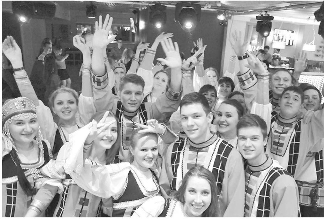
Хористы «Весенних зорь» сразу после гала-концерта.

Песня русская, родная | Известный воронежский коллектив вернулся с очередной творческой победой из Архангельска