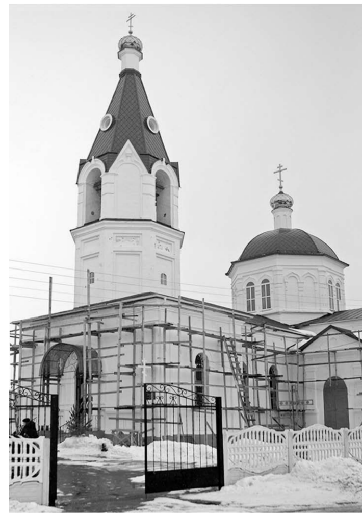
Реставрация Покровского храма продолжается.

Их писали по сырой штукатурке, поэтому держатся полтора века, - поясняет батюшка. - Мы не можем нанести новый рисунок, храм охраняется государством. По центру купола изображена Святая Троица. Она не каноническая, но ещё встречается в некоторых храмах. Видите Бога Отца, Бога Сына, над ними можно ещё разглядеть голубя – Духа Святого. В трапезной на куполе изображена икона Покрова Пресвятой Богородицы. Не