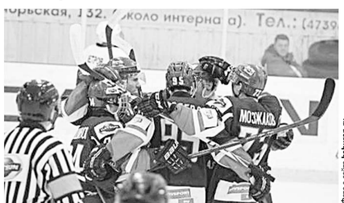
В регулярном первенстве ХК «Россошь» сопутствовал успех. Что же ждет команду в плей-офф?

Теперь по восемь лучших команд дивизионов «Запад» и «Восток» поведут спор за звание лучшей команды МХЛ. Первым соперником «Россоши» стал занимавший восьмое место ХК «Брянск». Стартовые игры плей-офф прошли на выезде. Сначала гости без особых проблем победили 6:2, но в повторной встрече хозяевам льда удалось взять реванш в серии буллитов - 5:4. Теперь противостояние команд переместится в Россошь.