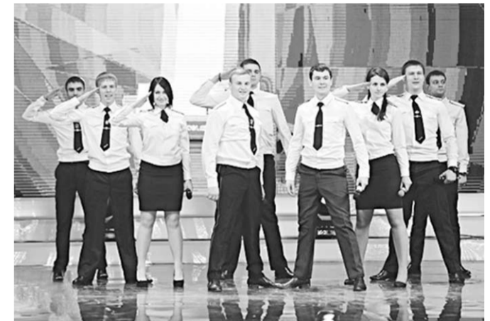
На сцене – команда КВН «Приказ 390».

Сборная команда КВН «Приказ 390» Воронежского института ФСИИ России с успехом прошла в четвертьфинал Первой телевизионной лиги международного союза КВН.