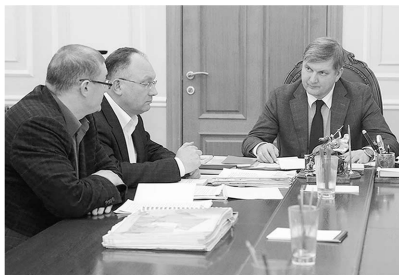
Об облике города - откровенно и принципиально.

В настоящее время проект нормативного акта об утвер-