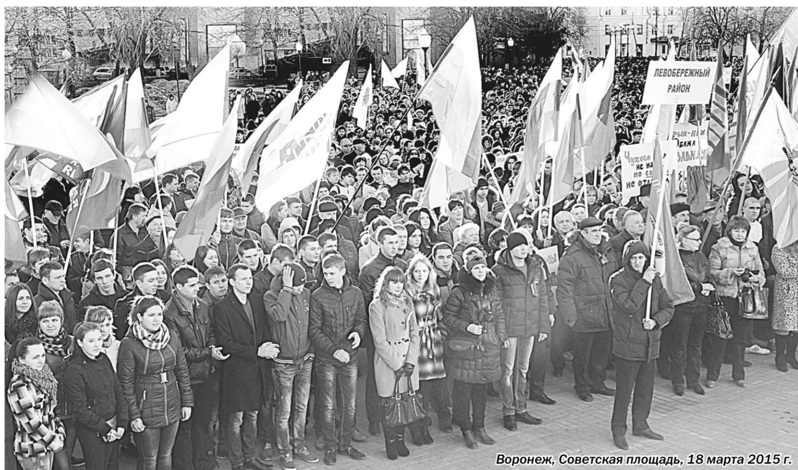
Воронеж, Советская площадь, 18 марта 2015 г.

С места события | Вчера в рамках Всероссийской патриотической акции «Воссоединение» на Советской площади в Воронеже состоялся митинг-концерт, посвящённый годовщине принятия Республики Крым и города Севастополя в состав Российской Федерации