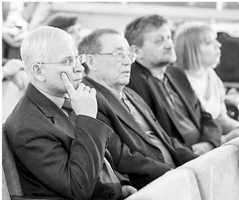
Специалисты как никогда требовательно подходят к анализу концепций застройки городских кварталов.