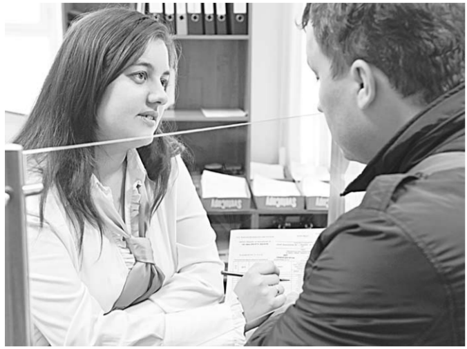
Специалисты готовы ответить на самые сложные вопросы.