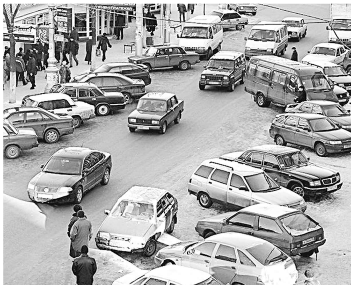
Нелегко приходится в эти дни автовладельцам.

Сосед вчера за свою «копейку» лохматого года выпуска отдал восемь тысяч, почти всю пенсию потратил на то, чтобы бабку свою на дачу возить, - услышали, протискиваясь к окошку. - Я в прошлом году неделю «убил», прежде чем оформил страховку по нормальной цене... Второй офис, третий, пятый, восьмой... Там, где народу было мало, агенты называли суммы,