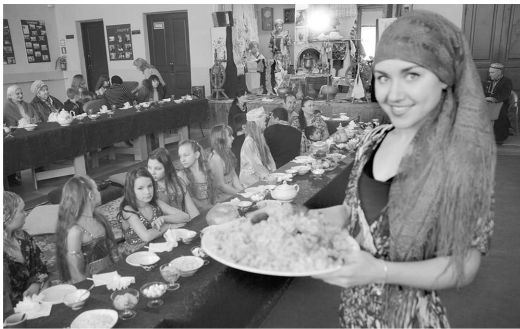
В Сомово приехали гости из узбекской диаспоры.

Так откликнулись здесь на присвоение Воронежу звания культуры столицы СНГ в 2015 году. Виталий ЧЕРНИКОВ