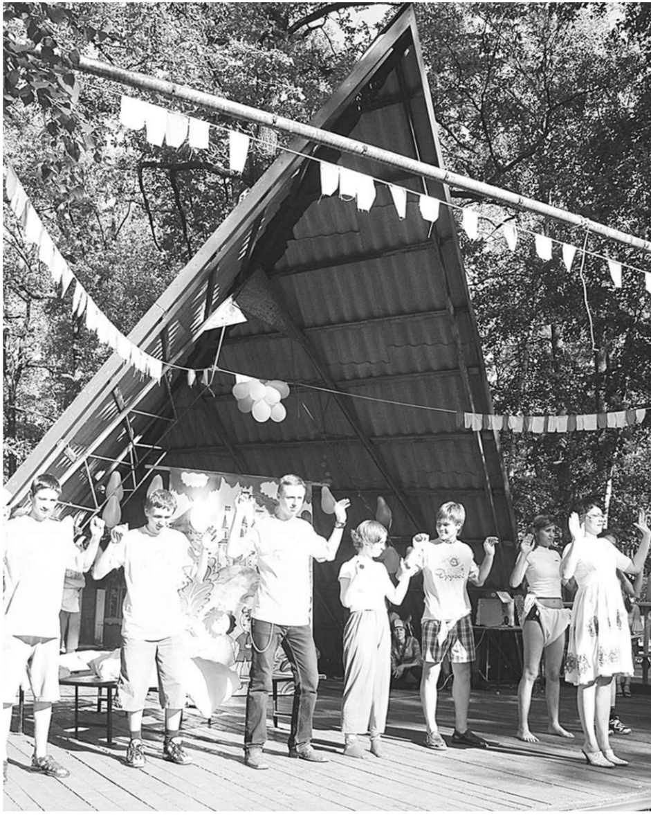
Главное, чтобы детям в лагерях было интересно.

«Предлагаю внимательно посмотреть качество выполняемой руководителями этого звена работы, и тех, кто не справляется, снять с занимаемых должностей. Главам муниципальных районов необходимо взять эти вопросы под особый контроль, – подчеркнул Алексей Гордеев.