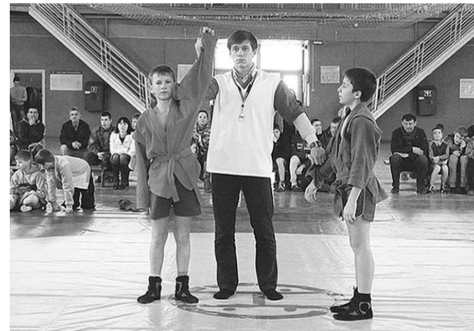
Юные самбисты показали настоящие бойцовские качества и волю к победе.

В Семилуках состоялся XI турнир по самбо памяти бойца отряда специального назначения «СКИФ» лейтенанта внутренней службы Сергея Антипова, инструктора-взрывника, погибшего 10 июля 2000 года в Грозном. Посмертно он был награждён орденом Мужества.