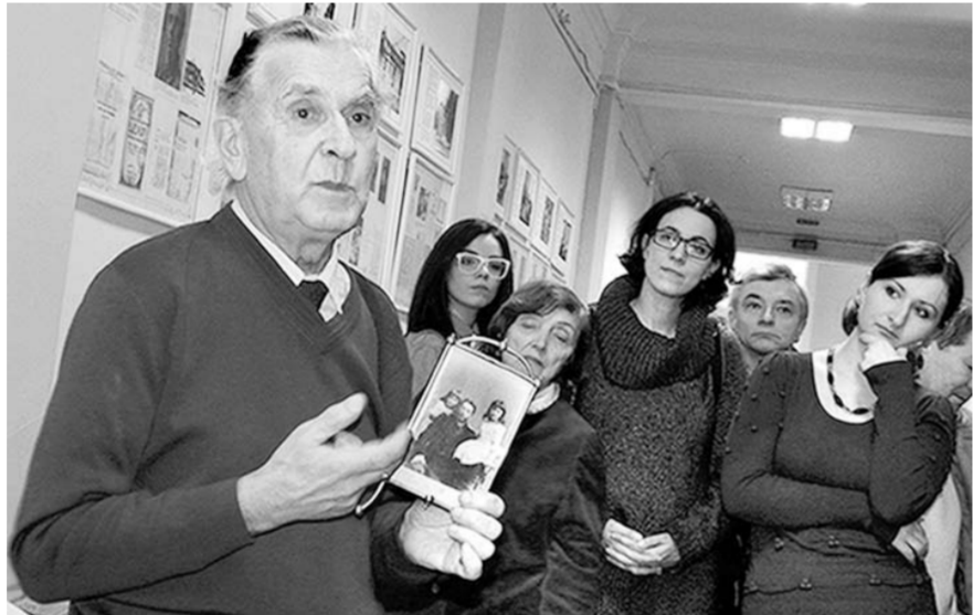
На выставку некоторые пришли с фотографиями из семейного архива.