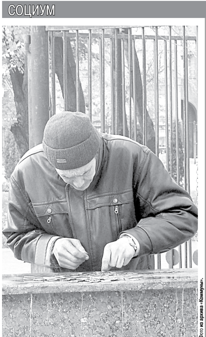
Хватит ли мелочи на буханку хлеба?