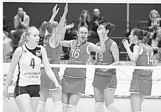
Воронежские волейболистки уступили «Ленинградке» по всем статьям.