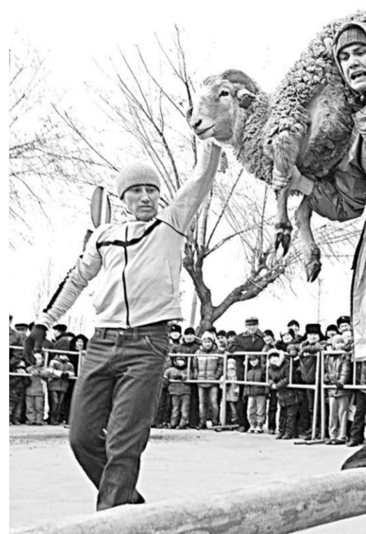
Картина с выставки.

Международная фотовыставка «Соцветие», организованная в рамках программы «Воронеж – культурная столица СНГ», открылась в Воронежском выставочном зале на улице Кирова ещё в первый день весны.