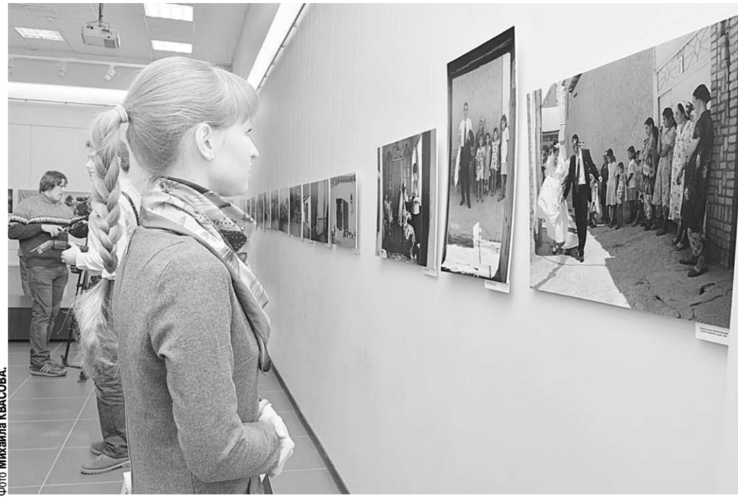
Представленные фотоработы вызывают неизменный интерес посетителей.