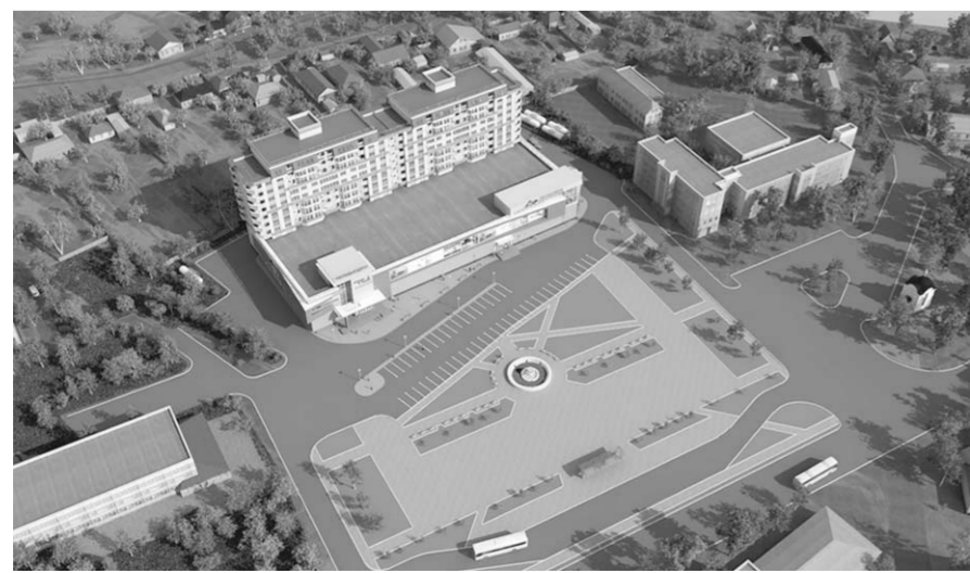
Такой станет Новая Усмани в будущем (один из проектов).

Администрация Новоусманского района активно поддерживает начинающих сельхозпроизводителей, в том числе, помогая в поиске инвесторов и деловых партнёров. В этом году район готовится принять на своей территории ежегодную выставку «День воронежского поля», где будет представлено на вса Россия. Площадка в селе Трудовое вызывает большой интерес и сама по себе. Именно здесь расположено знаменитое форелевое хозяйство, где