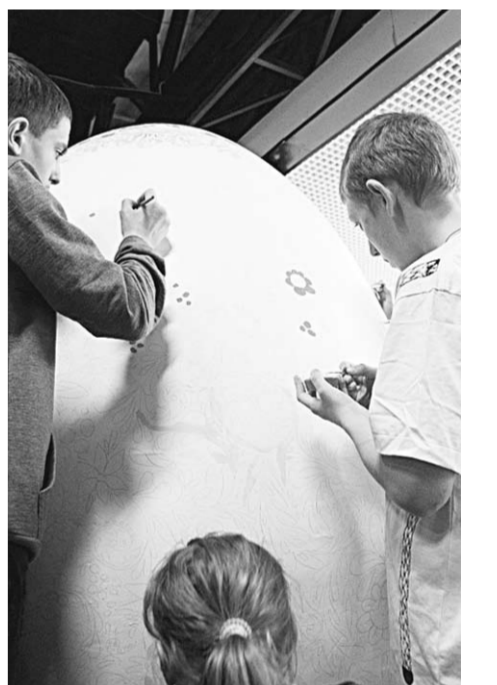
Огромное пасхальное яйцо привлекло внимание юных художников.

Митрополит Воронежский и Лисинский Сергей открыл мастер-класс по изготовлению пасхальных сувениров в ТРК «Сити-парк «Град».