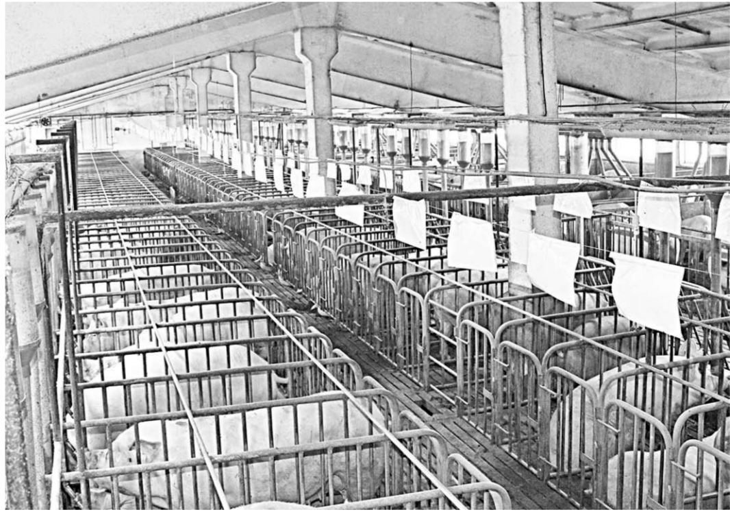
Содержать свиней, заниматься их убоем и хранением продукции сегодня можно только в том случае, если ты в состоянии обеспечить безопасность и соблюдение ветеринарно-санитарных требований.

Учитывая то, что проблема АЧС является не только чисто ветеринарной, но и экономической и политической, специалисты Россельхознадзора работают в тесном контакте со специалистами Управления ветеринарии, не дублируя, а взаимодополняя друг друга, а также с региональными департаментами аграрной политики и экологии и природопользования, УФД, прокуратурой, Роспотребнадзором, таможенной службой, муниципальными органами и другими ведом-