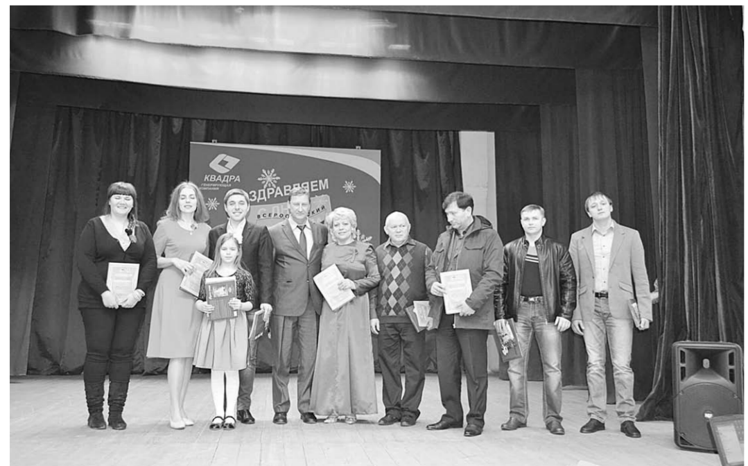
Конкурсанты в полном составе.