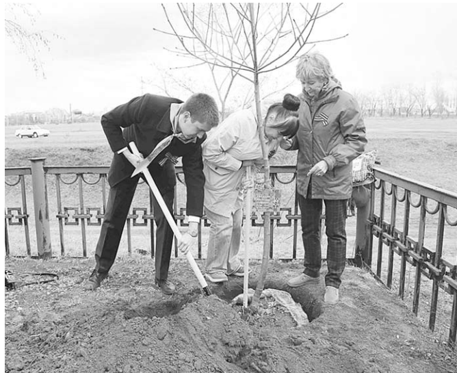
Пусть приживутся деревья!