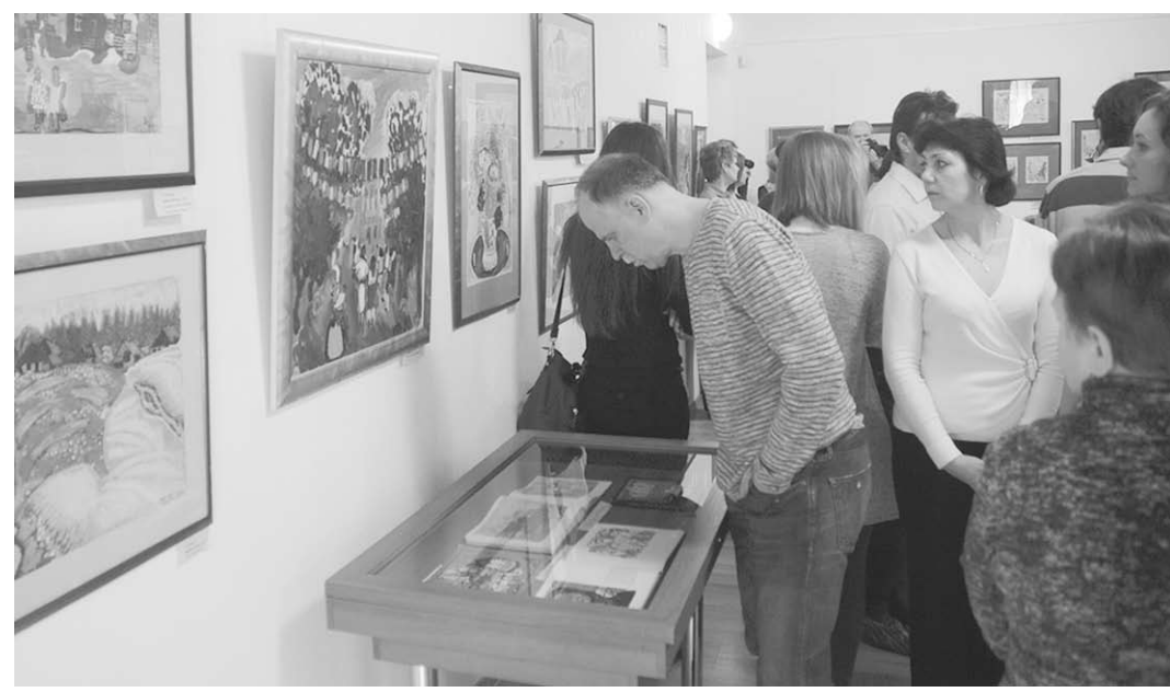
На открытии выставки.

Они стали известны в начале 1930-х. Тогда эти двое входили в «Группу 13», объединявшую художников-графиков. Кузьмин, впрочем, заявил о себе ещё до революции, сотрудничая с такими журналами, как «Аполлон» и «Лукоморье». Знаком XIX века, он с середины 1920-х начал активно работать как иллюстратор произведе-