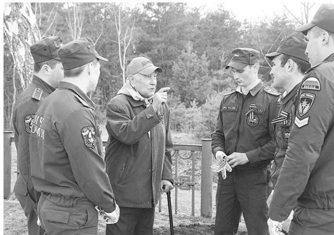
Ветеран даёт наказ молодому поколению.

15 семей читателей газеты «Ва-банк», фотографии и фронтовые рассказы о близких родственниках, которые были в этом году уже опубликованы, также высадили именные деревья в память о воронежских фронтовиках и тружениках тыла.