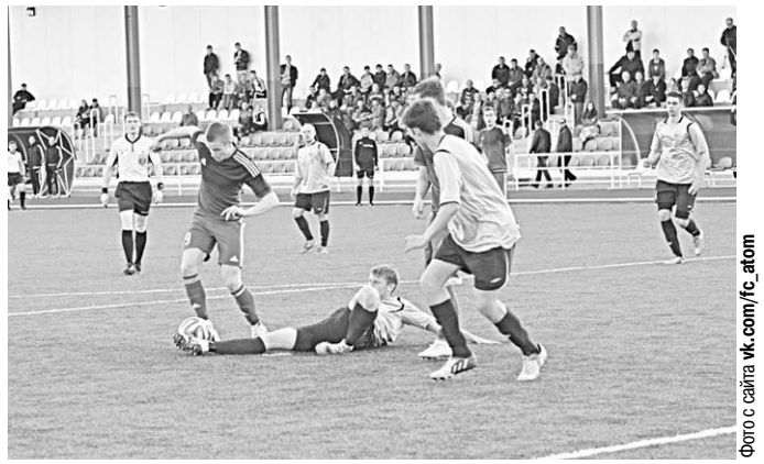
«Атом» много атаковал, но для победы дебютанту турнира хватило всего одного точного удара.