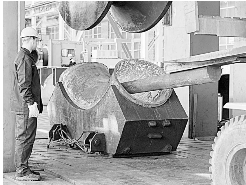
В цехе изготовления деталей трубопроводов.

619 тыс. гектаров, кормовые культуры разместятся на площади 335 тыс. гектаров. Сахарную свёклу посеют на площади 112 тыс. гектаров.