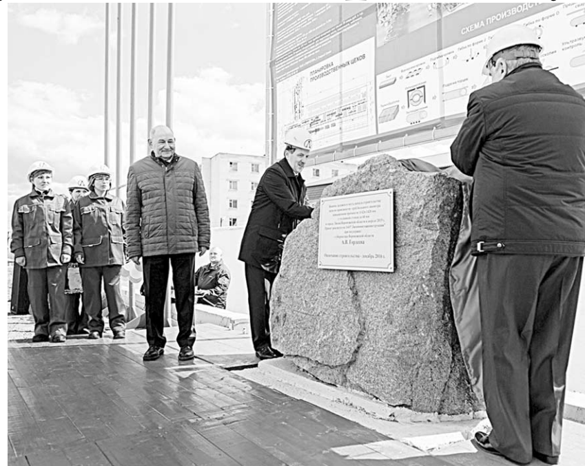
Губернатор принял участие в закладке камня на месте возведения нового цеха.

Он побывал на полях сельхозпредприятия «Маяк», которым руководит Роман Боровских. Десять дней назад здесь приступили к сезонным сельскохозяйственным мероприятиям. Губернатор отметил, что в нашей области посевные работы набирают темп. Аграрии региона во время весенней полевой кампании планируют засеять площадь 1,7 млн. гектаров. Зерновые и зернобобовые культуры займут площадь в 1530 тыс. гектаров, что на 100 тыс. гектаров больше, чем в 2014 году, технические – площадь в