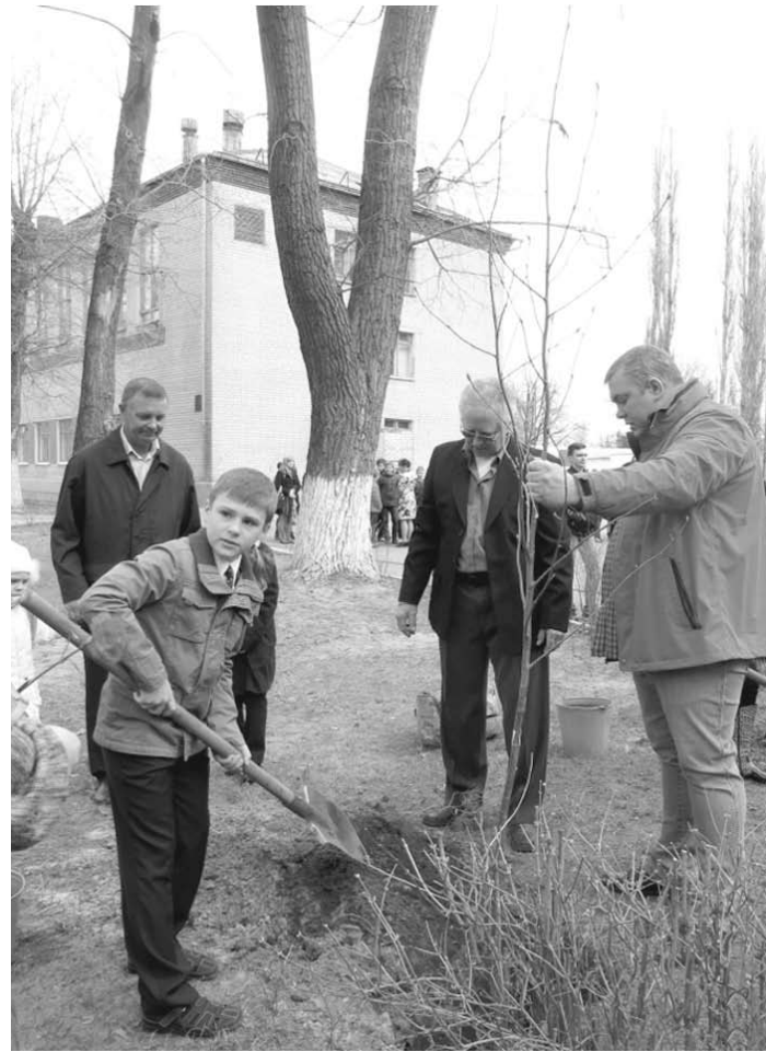
На новой Аллее памяти.

Первые шаги по возделыванию новой культуры «Нива» тщательно выверяла с ГНУ ВНИИЗК имени Калиненко, где и приобретались семена сорго «Орловское». Да и сейчас ученые научного учреждения — постоянные консультанты и главный агроном, и дру-