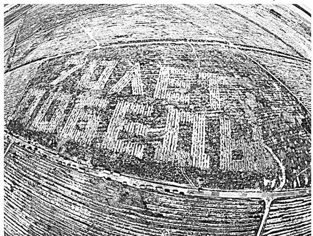
Вид на лес Победы с высоты птичьего полёта.

Патриотическая акция собрала около 500 участников, среди которых – неравнодушные жители и представители различных общественных организаций