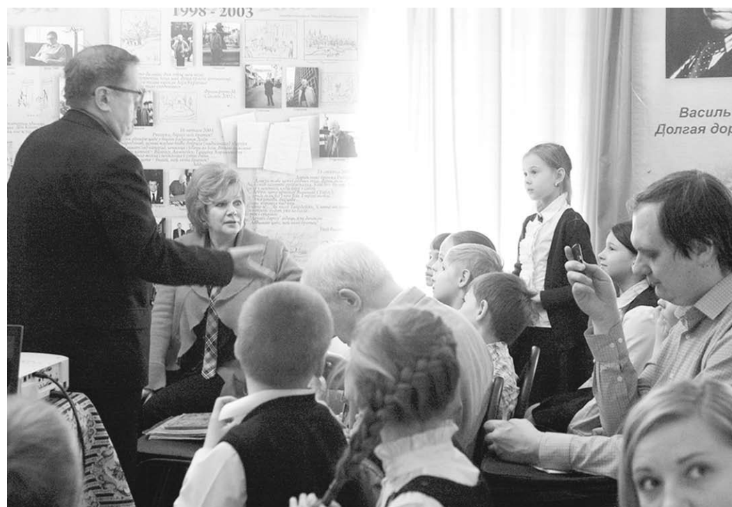
Юные гости музея.

Затем для них сотрудники Литературного музея провели