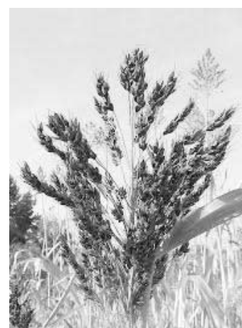
набрал должную силу. Посевы сорго стояли как ни в чем не бывало.

По группе медицинских товаров на 9,8–16,1 процента выросли цены на медицинские термометры, аспирин, анальгин, корвалол и валокордин. Тарифы на услуги, оказываемые населению, с начала года подорожали на 2,9 процента. На 17,9–24,1 процента возросла плата за проезд в городском пассажирском транспорте, изготовление коронки и съёмных протезов, сообщает пресс-служба Воронежстата.