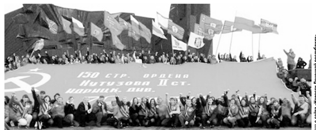
В Донецке, у монумента освободителям Донбасса, в рамках Всероссийского проекта «Наша Великая Победа» была развернута большая копия Знамени Победы в Великой Отечественной войне.

О позиции Президента РФ Владимира Путина информирует ТАСС: «Под конъюнктуру сегодняшней политической повестки дня, как кто бы ни старался что-то изменить, в том числе используя такие методы, как героизация нацизма, ничего у них не получится. Невозможно переписать историю под политическую конъюнктуру».