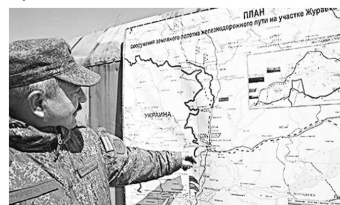
В планах у военных – построить шесть железных дорог до 2018 года.

Железнодорожные войска приступили к строительству двухпутной электрифицированной железной дороги на участке Журавка (Воронежская область) – Миллерово (Ростовская область), что позволит пустить поезда на юг России в обход Украины.