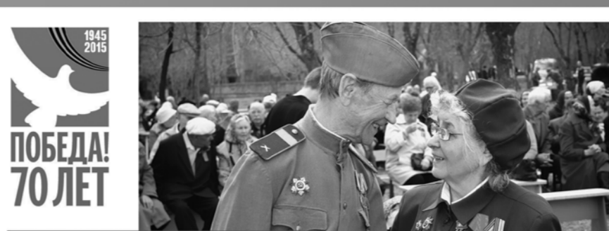
МОЕ «СПАСИБО» ЗА МИР

Само по себе захоронение – вполне типичное для шестидесятых годов прошлого века. Однако нас очень тронула одна деталь – принесённая кем-то из местных жителей полусгнившая каска советского солдата. Мы её нашли на одной из дорожек. Эта каска стала своеобразным символом, в одно повествование соединившим судьбы всех погребённых в этой братской могиле. Состояние захоронения оценили как полностью готовое к приёму делегаций. Видно, что недавно проводили субботник: убран мусор, надписи на памятных плитах подкрашены. Недалеко от братской могилы появилась аллея из молодых рябин, высаженная в память о войнах-освободителях.