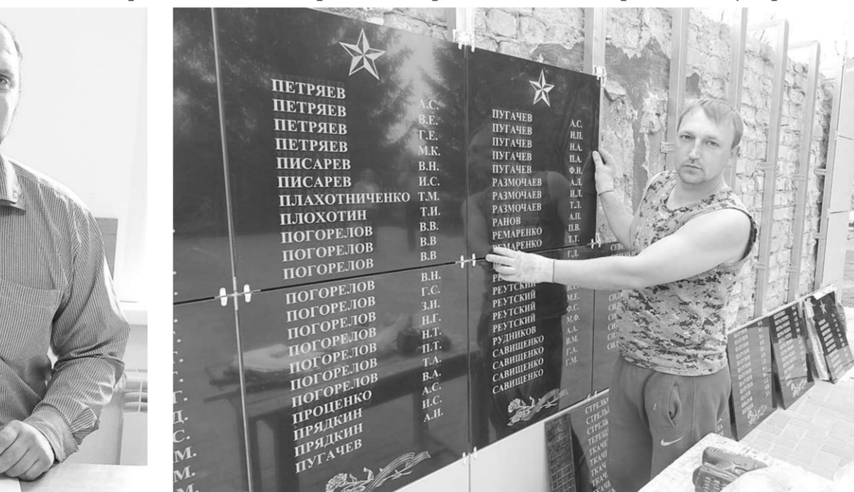
Землякам, шагнувшим в бессмертие.

В обновлённом Доме культуры, где за последние три года произошли колоссальные перемены, проходят последние репетиции концерта ко Дню Победы.