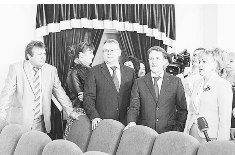
Алексей Гордеев знакомится с обновлённой репьевской средней школой.

Помимо стадиона, в райцентре тогда же появились и спортивный комплекс «Победа». Стоимость работ составила свыше 70 миллионов рублей. В стенах «Победы» расположились, среди прочего, универсальный игровой и тренажёрный залы. Особенно долгожданным оказалось для многих местных жителей, и прежде всего, конечно, для репьевской молодёжи, появление оборудованного танцзала. До недавнего времени танцевальным коллективам приходилось заниматься в приспособленном помещении в подвале здания районной администрации.