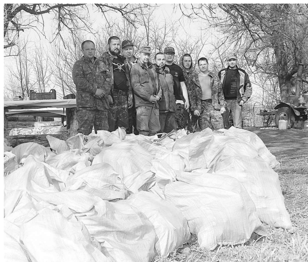
Горькая память войны - пока в мешках поисковиков.

«Берлинка» звали её для краткости местные жители. Там, где сейчас ямы, открытые поисковиками, находились сараи для совхозных животных Евдаковского мажориркомбината. В них и загнали фашисты более тысячи узников, превратив территорию в концлагерь. «Железку» же предполагалось протянуть по ярам и болотам, преодолев почти сорок километров от Острогжска до Евдаково, за три-четыре месяца - невероятный для гитлеровцев поспех к Сталинграду и к Кавказской нефти. Дорогу тянули с двух сторон - на дармовой рабочей силе не экономил: в Острогжском районе оборудовали 14 концлагерей, семь - в Каменском. Свыше 100 тысяч человек втиснули в вонючую скученность здешних овчарен и коношен. Второй лагерь советских военнопленных в Каменке оборудовали в Кутняковской круче. В 60-е на его месте над захоронением узников построили стадион - часть останков перенесли в братскую могилу. Сколько осталось в земле - неизвестно.