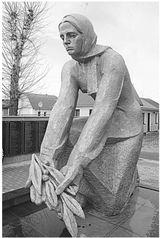
Братская могила №24.

На тему дня | Корреспонденты «Коммуны» завершают свой рейд по воинским захоронениям, начатый в декабре прошлого года