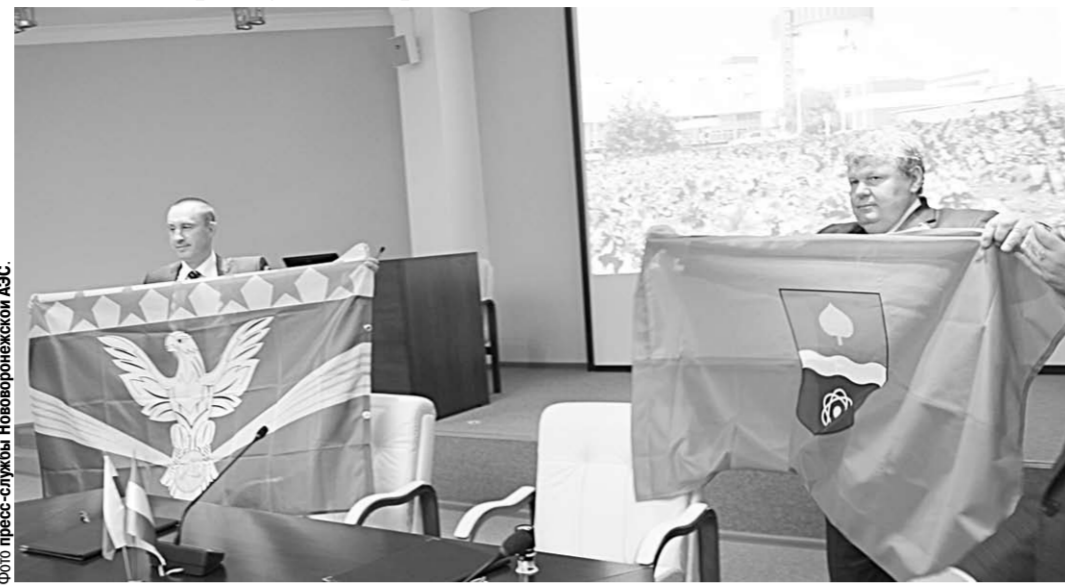
После подписания меморандума мэры Нововоронежа и Пакша обменялись флагами.

О значении подписанного документа позитивно отозвался и первый заместитель председателя правительства Воронежской области Андрей Ревков: «Сотрудничество будет носить практический характер. Во-первых, потому что блок аналогичный Нововоронежскому шестому энергоблоку будет построен в городе Пакш. Это и постоянный обмен специалистами, опытом. Это, конечно же, расширит возможные горизонты для будущего сотрудничества с такими странами, как Венгрия, готовыми размещать и эксплуатировать у себя наши промышленные объекты».