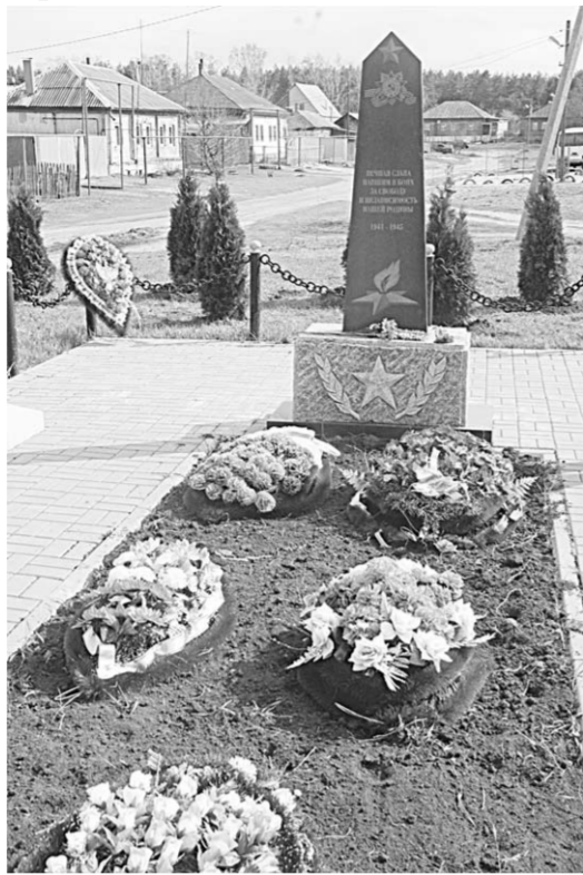
Братская могила №214.

А вот братская могила №214 находится в селе Таврово. Летом 1942 года поселению угрожал полное уничтожение, так как оно оказалось на пути немецких захватчиков. Но советские воины остановили врага на берегах рек Дон и Воронеж, тем самым спасли село от гибели.