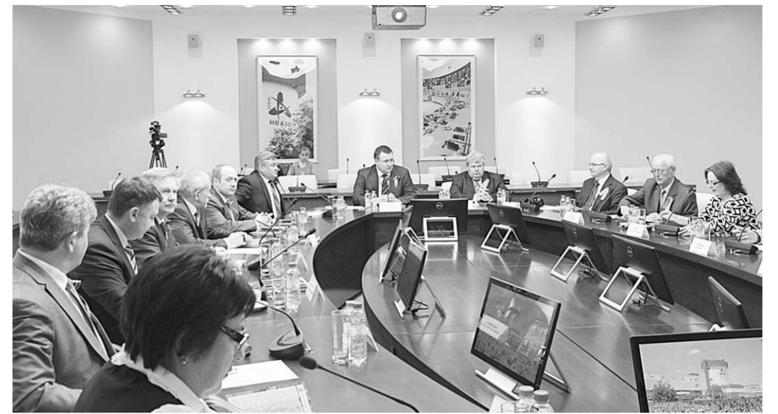
Обсуждение за «круглым столом».