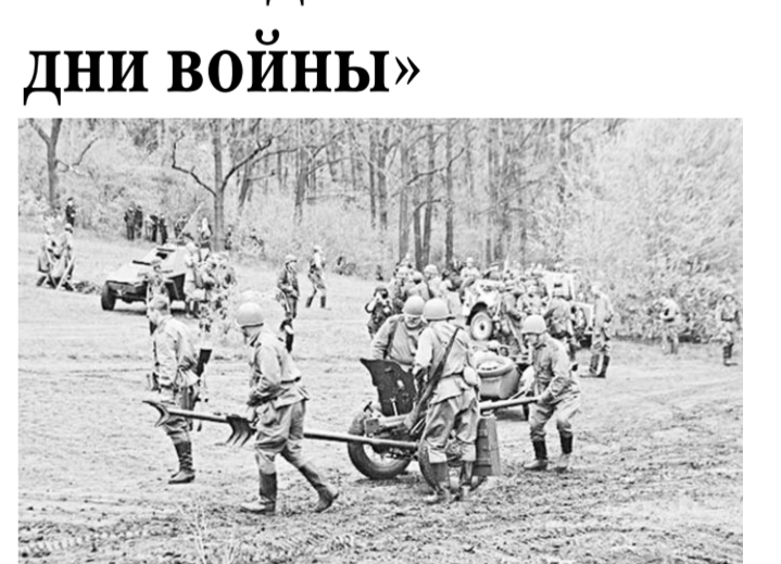
Так называется военно-историческая реконструкция, проведённая в Воронежском центральном парке («Динамо») в рамках мероприятий, посвящённых 70-летию Победы.