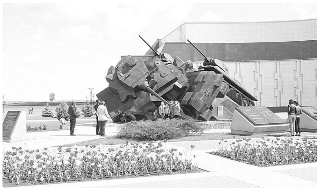
На входе в музей всех встречает скульптурно-художественная композиция «Танковое сражение под Прохоровкой. Таран».

«Третье ратное поле России» - именно так называется это место, на котором состоялось крупнейшее танковое сражение. Очевидцы описывают его как настоящий ад, в котором горела техника, и казалось, что небеса обжаты дымом и пламенем. Ожесточенная битва, ставшая залогом победы Советской Армии на Курской дуге, оставила неизгладимый след в воспоминаниях участников сражения. Экскурсоводы рассказывают, что после сражения на Прохоровском поле