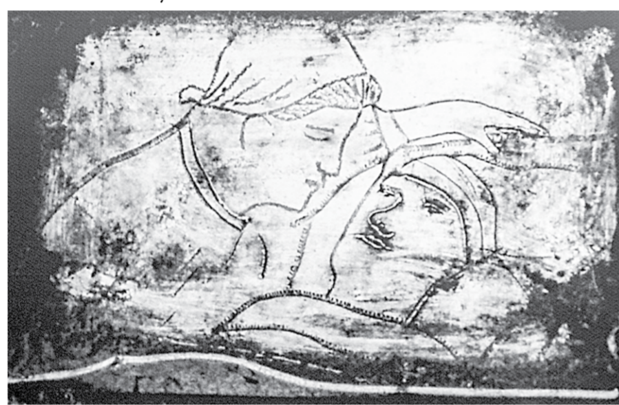
Крышка портсигара - находка смоленских поисковиков.

Вернисаж | В Воронежском областном художественном музее имени И.Н.Крамского проходит выставка «Окопное искусство»