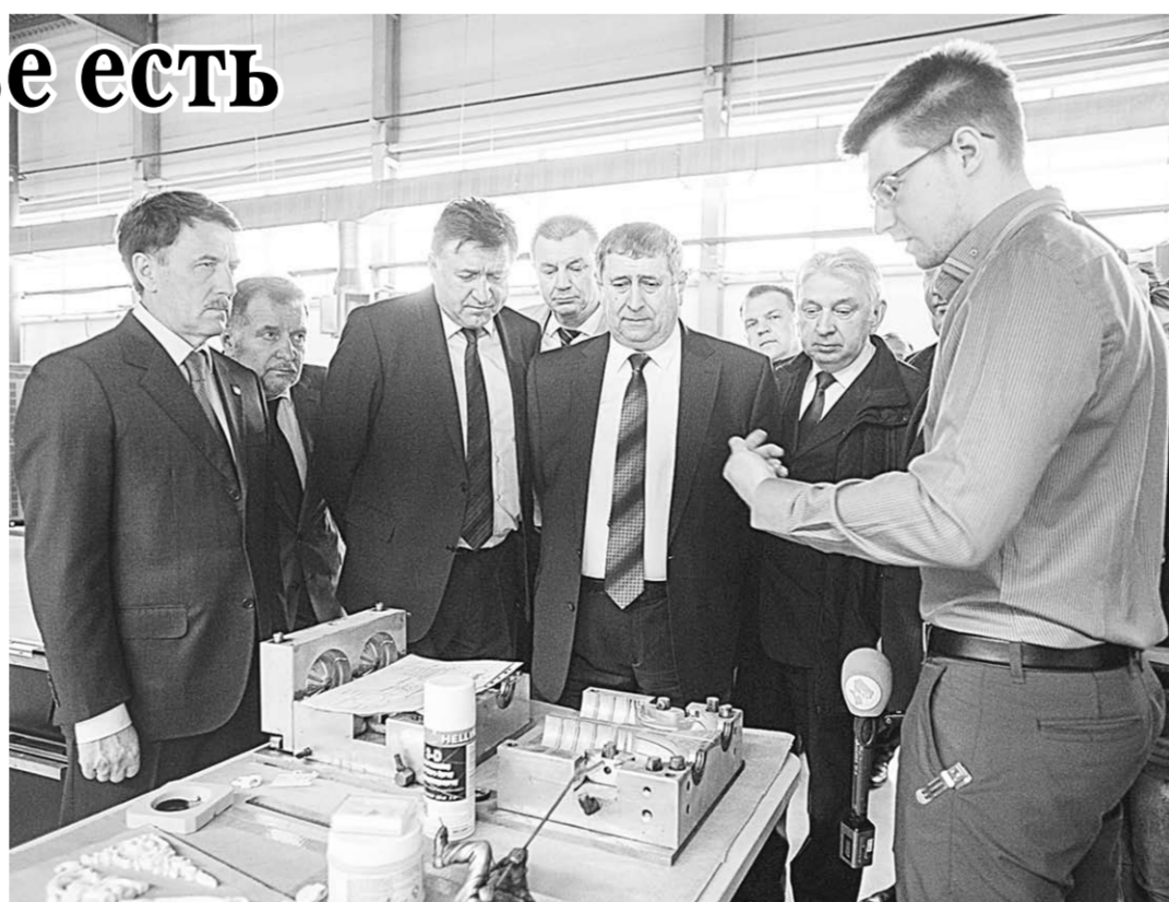
Продукция воронежцев заинтересовала гостей из Белоруссии.