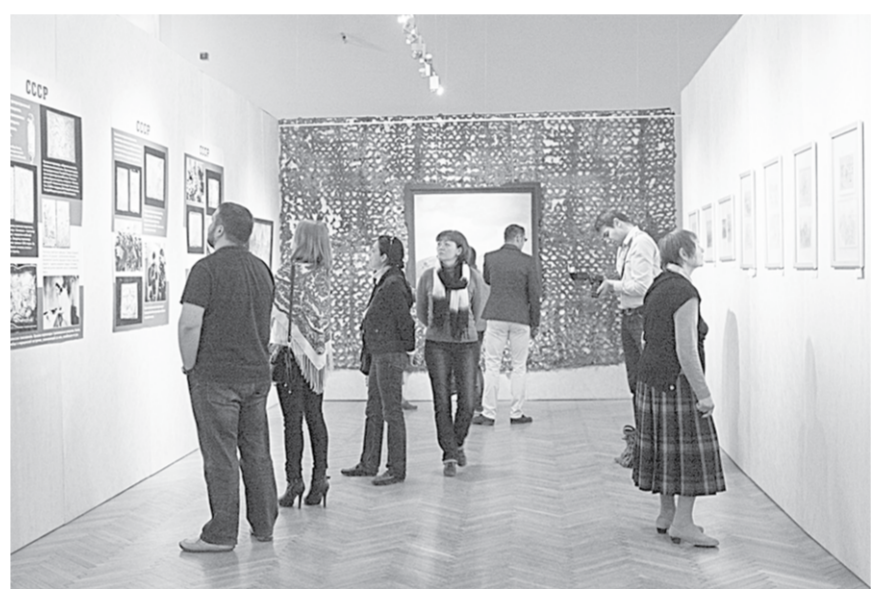
«Окопное искусство» привлекло многих воронежцев.