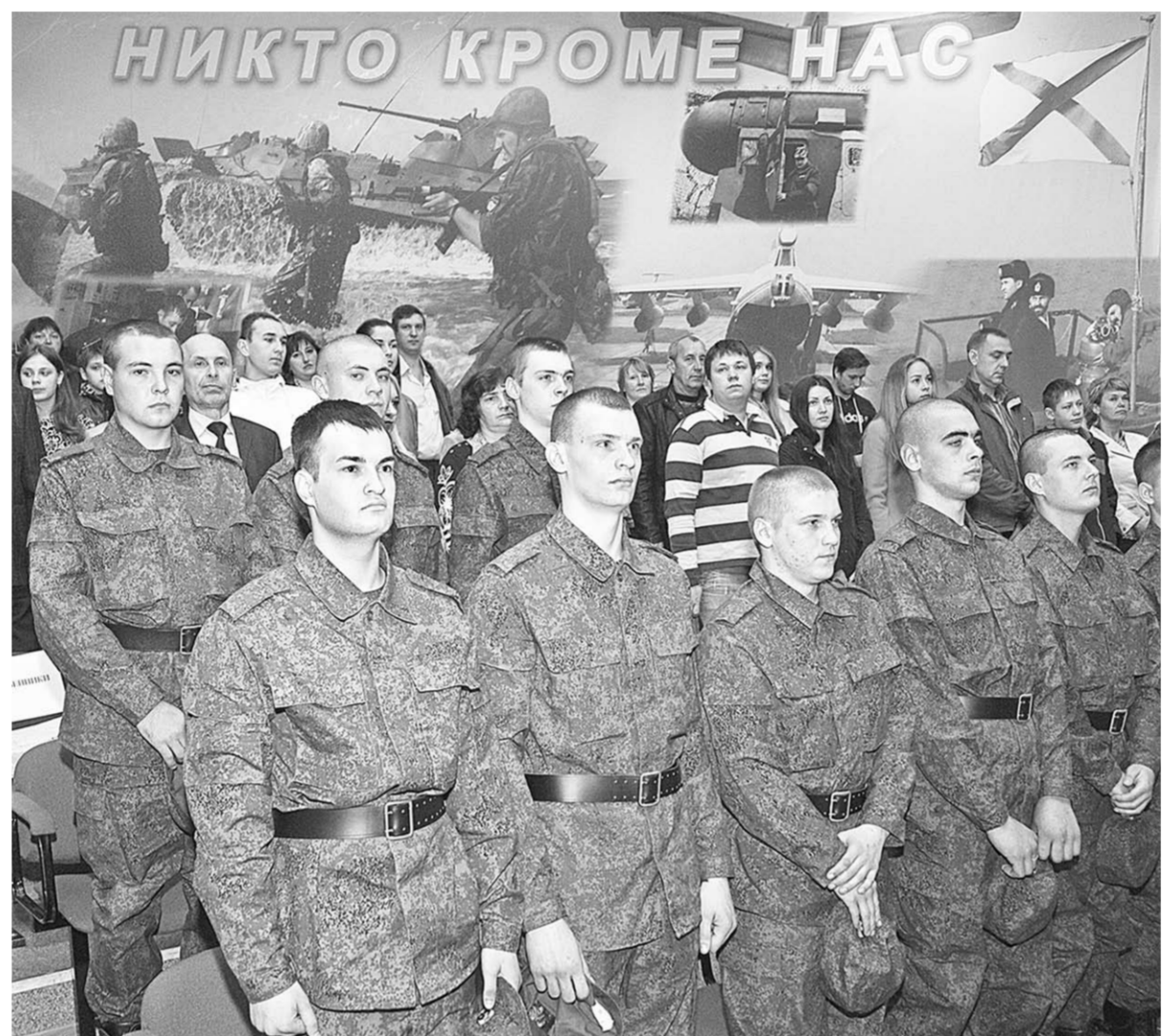
Все как на подбор – достойная смена военнослужащим Президентского полка.

Армия | Пятнадцать призывников из Воронежской области отправились служить в элитный кремлёвский полк