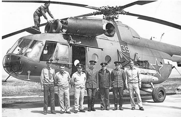
Проверка командиров экипажей алма-тинского полка, 1977 г.

Мургаб - это самый высокогорный аэродром бывшего Советского Союза, он располагается на высоте 3760 метров над уровнем моря, окружен со всех сторон горами, высотой от пяти до семи тысяч метров, а нехватка кислорода, по сравнению с равнинной местностью, там составляет почти 40 процентов. Полеты были важны для пограничных войск. Они позволяли решать вопросы доставки оперативных групп и важных грузов в труднодоступные районы. Поначалу какой-то специальной подготовки вертолётчиков никто не занимался, хотя даже непрофессионально понято, что ведение боя в горных условиях требует особого мастерства, иной тактики и при этом какой-то дерзости и смелости.