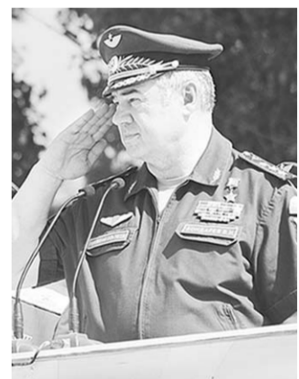
Виктор Бондарев приветствует участников «Авиадартса».

Обращаясь к участникам соревнования, Главнокомандующий ВВС РФ, Герой Рос-