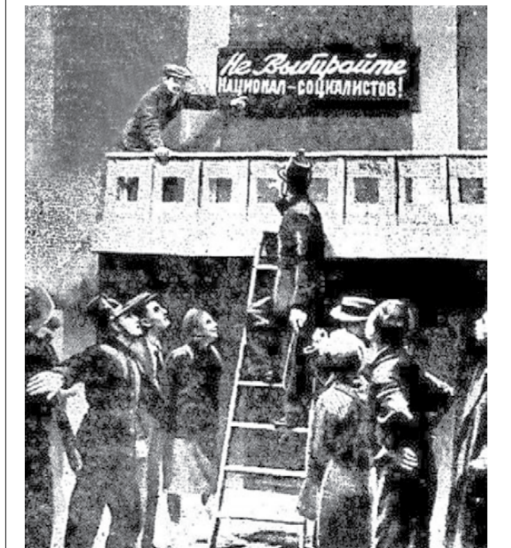
Сцена из спектакля театра драмы «Продолжение следует».