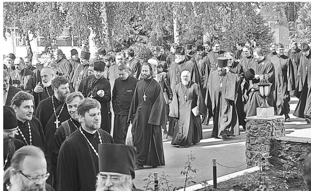
В Воронеже священники со всех военных округов России впервые собрались на учебно-методические сборы, чтобы обсудить насущные вопросы деятельности военного духовенства в контексте задач, которые решают сегодня Вооруженные силы.

Роль и место военного священника в решении задач, стоящих перед Вооружёнными силами Российской Федерации, обсудили в Воронеже. На учебно-методический сбор, который прошёл на базе Военного учебно-научного центра ВВС «Военно-воздушная академия имени профессора Н.Е.Жуковского и Ю.А.Гагарина» (ВУНЦ ВВС «ВВА»), собрались 155 штатных помощников командиров по работе с верующими военнослужащими – православными священниками, представителями мусульманского, буддийского, иудейского духовенства со всех военных округов России.