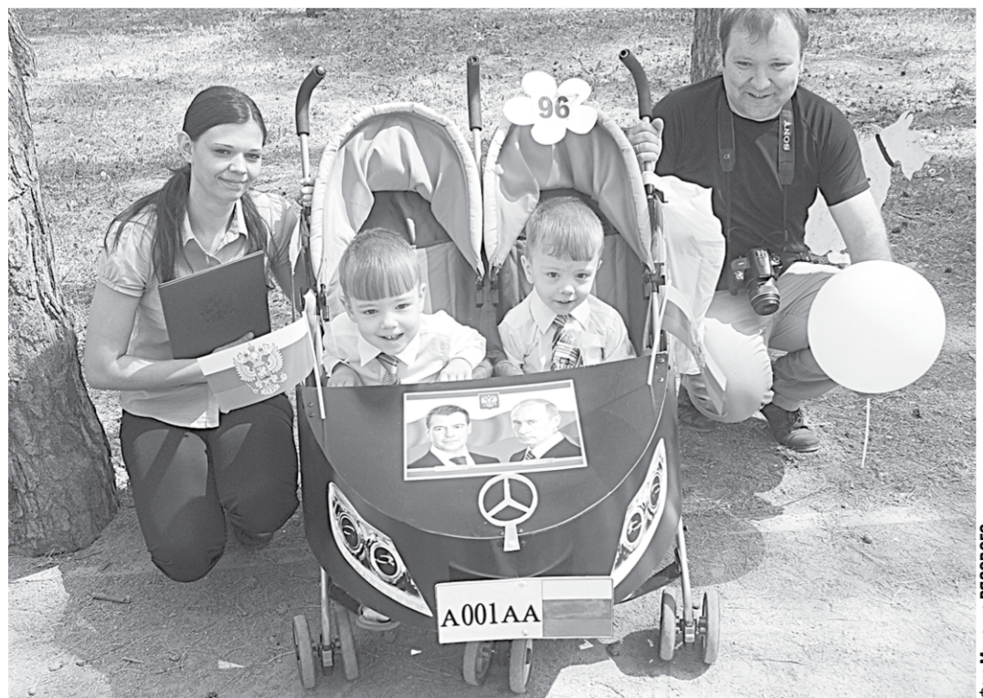
Есть мечта стать президентом. А почему бы и нет?!

Нашим нардепам озабочиться бы тем, как ликвидировать уязвимую сексуальную безграмотность населения, а не изобретать кары для представителей слабого пола.