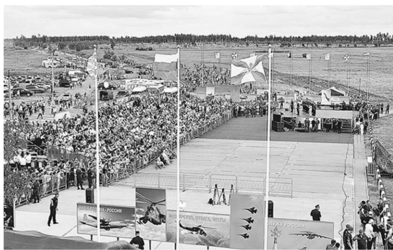
Тысячи воронежцев и гостей праздника собрались, чтобы увидеть в небе мастерство российских лётчиков, пилотирующих боевые машины.

Впервые экипажи учебно-боевых самолётов Як-130 осуществили пуски неуправляемых ракет и сброс бомб на различные мишени авиационного полигона. Пилоты также продемонстрировали лётные и