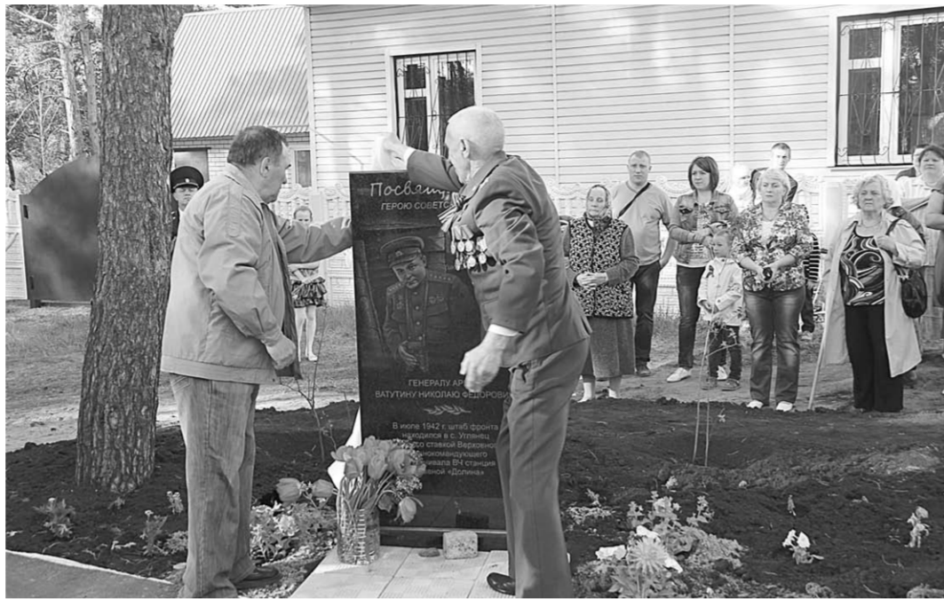
На церемонии открытия памятного знака.

Ставка Верховного Главнокомандования, понимая серьезность положения наших войск на Дону, приняла решение о разделении Брянского фронта и создании Воронежского фронта. 14 июля приказом №170509 командующим фронтом был назначен генерал-лейтенант Н.Ф. Ватутин. Его войска оттягивали на себя основные силы немецких дивизий, которые двигались на Сталинград, не дав врагу возможности ввести в бой резервы для вывода из окружения 6-й армии Паулюса.