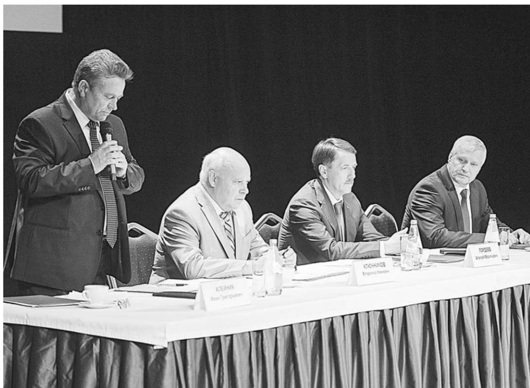
На заседании обсуждались основные направления деятельности органов местного самоуправления в современных экономических условиях.

— Можно спорить, хорошо это или плохо. Но вспоминается известное высказывание: «Перемены к лучшему