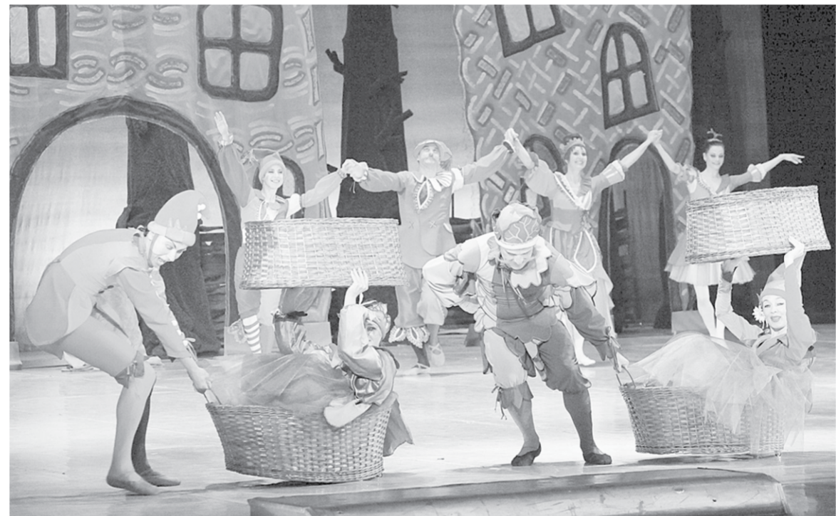
Спектакль «Чиполлино» на сцене театра оперы и балета.